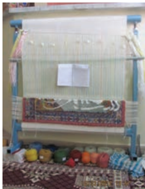
شکل ۱۰-۱- زیردار ثابت و سردار متحرک (مدل ۲)