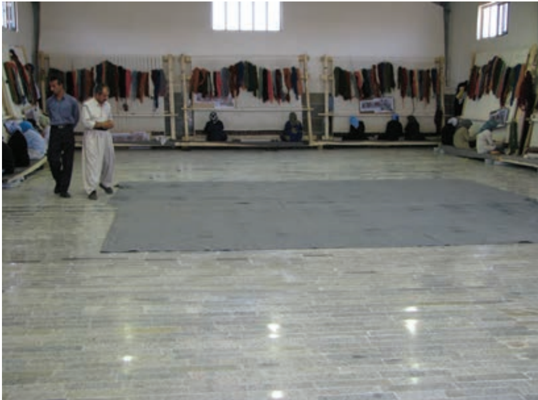
شکل ۲۳-۱- فضای کارگاه قالی بافی نیمه متمرکز

طراحی فضای کارگاه قالی بافی نیمه متمرکز باید به گونه‌ای باشد که استانداردهای فضای کارگاه آموزشی در آن رعایت شود. هدف از این طراحی دسترسی راحت به تجهیزات و مواد اولیه و همچنین جابه‌جایی ایمن هنرآموز و هنرجویان در کارگاه و محل قرارگیری دارهاست.