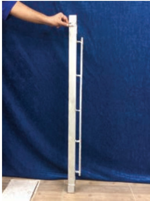
شکل ۱۷-۱- زیر دار