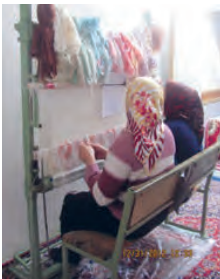
شکل ۱۲-۱- زیر دار و سردار هر دو گردان (شفتی)

۵- زیر دار و سردار هر دو گردان (شفتی یا چرخ‌دنده‌ای)