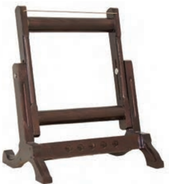
شکل ۸-۱- زیر دار و سر دار هر دو ثابت (مدل آموزشی)