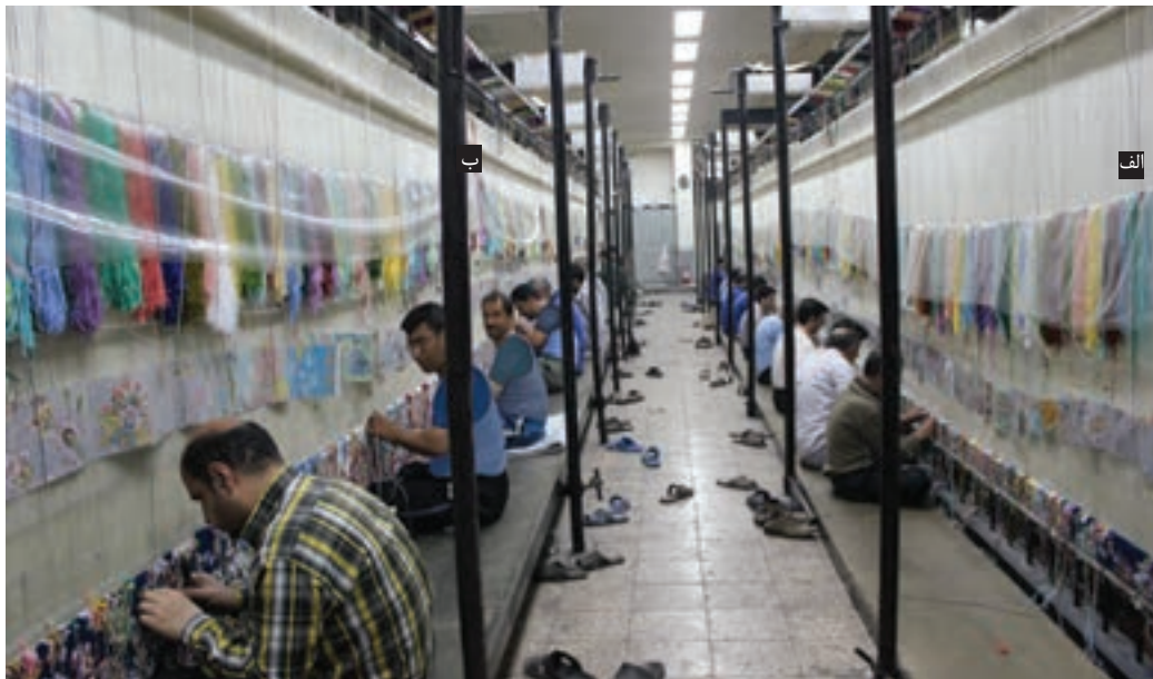
شکل ۲۴-۱- فضای کارگاه قالی بافی متمرکز