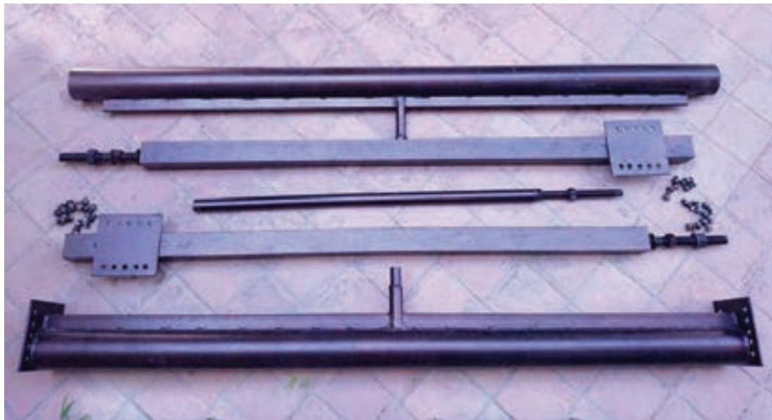
شکل ۱۵-۱- متعلقات یک دار قالی بافی (دو راست رو، زیر دار، سردار، جک، پیچ و مهره)

متعلقاتی نیز، بسته به طرح دار، به کار گرفته می شود. گوه، پیچ، مهره، هاف، کوچی، زیر کوچی، جک، پایه های نگه دارنده، نردبان، نیمکت، صندلی، چراغ روشنایی، دیلم و آچار و ... از متعلقات گفته شده محسوب می شوند.