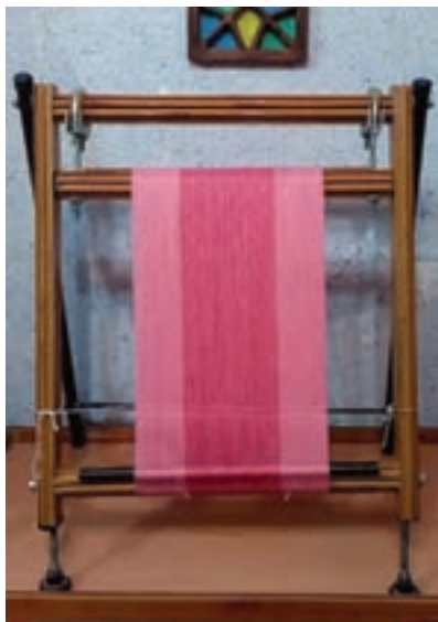
شکل ۱-۴- دار قالی بافی عمودی