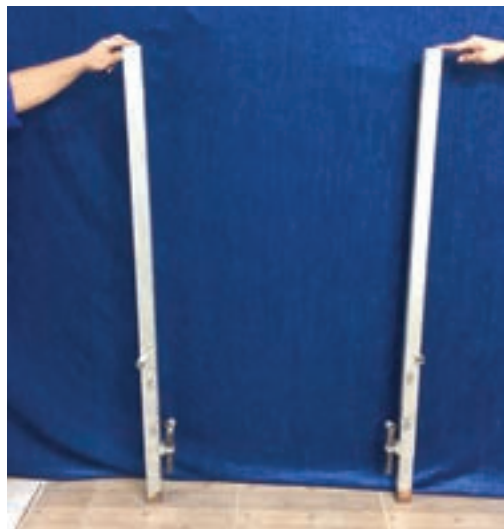
شکل ۱۶-۱- راست روها

راست روها حکم ستون های اصلی را در دارها دارند. از این رو بسته به نوع فرش مدل و جنس آن، تعیین می گردد. چنانچه راست روها از جنس چوب ساخته شوند، باید از استحکام لازم برخوردار باشند. اگر از جنس فلز ساخته شوند، باید در مقابل فشار وارده استحکام داشته باشند و به بیرون قوس بر ندارند.