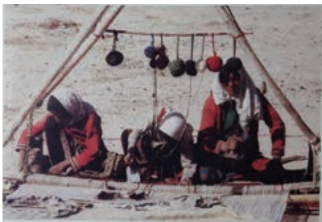
شکل ۵-۱- دار قالی بافی افقی

این نوع دار ویژه عشایر و برخی از اقوام مناطق است و طراحی آن به گونه‌ای است که مثلاً برای عشایر در هنگام کوچ، دچار مشکلات مربوط به جمع‌آوری و انتقال آن از محلی به محل دیگر نمی‌شود. دار قالی افقی از دو تیرک بالایی و پایینی تشکیل یافته است. از یک تیرک برای ابتدای کار و از تیرک دیگر برای انتهای کار استفاده می‌شود. جنس آنها معمولاً از چوب است و به وسیله طناب و میخ‌های مخصوص فلزی یا چوبی سفت و محکم می‌گردد.