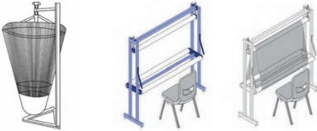
شکل ۱۴-۱ مدلی از دار قالی برای حجم بافی