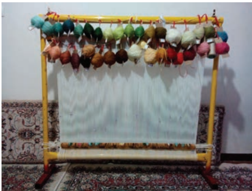
شکل ۶-۱- دار قالی بافی عمودی

این نوع دار قالی بافی به‌طور عمودی نصب می‌شود و اجزای آن به وسیله اتصالاتی به همدیگر مربوط می‌شوند. مدل‌های مختلفی از این نوع دار ساخته می‌شود و مورد استفاده قرار می‌گیرد.