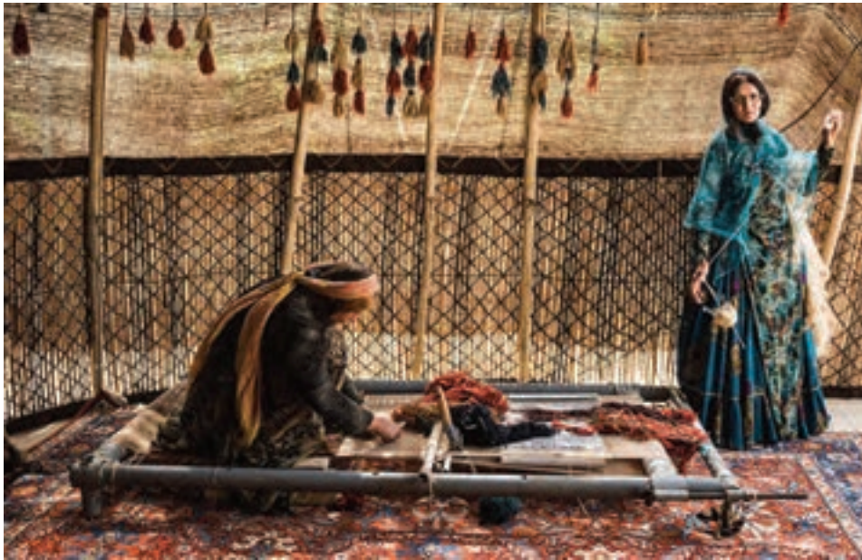
شکل ۷-۱- دار قالی بافی قابل استفاده به دو صورت عمودی و افقی

امروزه از دارهای عمودی به صورت افقی نیز استفاده می‌شود. حتی می‌توان برخی فرش‌ها مانند جاجیم را، که به صورت سنتی بر روی دستگاه‌های افقی بافته می‌شوند، بنا بر ضرورت بر روی دارهای عمودی چله‌کشی کرد و بافت. برای مثال در تصویر پایین مشاهده می‌کنید از یک دار عمودی (فندک دار فلزی)، با تغییر در پایه‌های آن، در حالت افقی استفاده شده است.