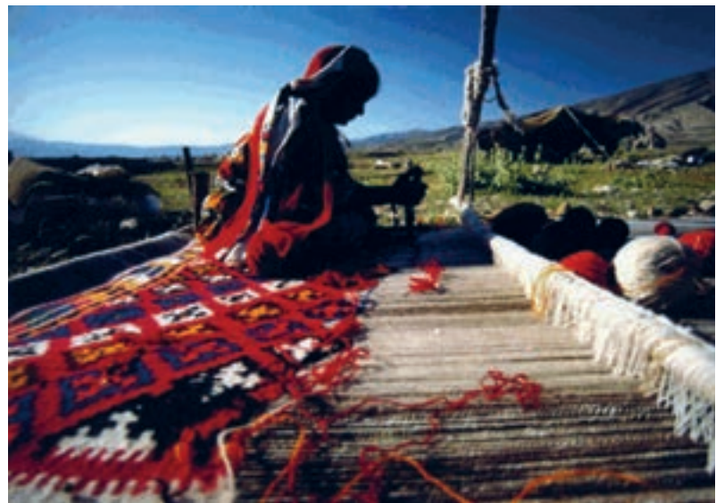
شکل ۱-۳- دار قالی بافی افقی