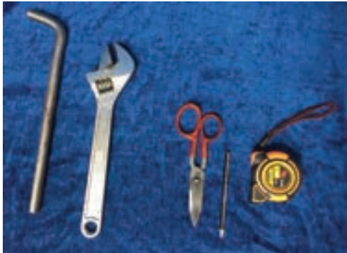
شکل ۱-۲- ابزار و تجهیزات

نصاب دار قالی بافی برای رعایت اصول بهداشت کار و اجرای دقیق و راحت تر آن، به ابزار و تجهیزات مناسب نیاز دارد. ابزار و تجهیزات زیر بسته به ابعاد و نوع دار، برای نصب و کنترل مورد استفاده قرار می گیرند: