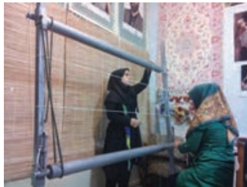
شکل ۲۵-۱- نمایی از رابطه نوع چله کشی و نوع دار

انتخاب نوع دوخت چله دوانده شده در مرحله چله ریزی به زیر دار نیز در انتخاب نوع داری تأثیر نیست. یعنی اگر دوخت به روش نخ پنبه ای ضخیم انجام شود باید روی زیردار (از داخل) میله ای نازک مانند میل گرد جهت