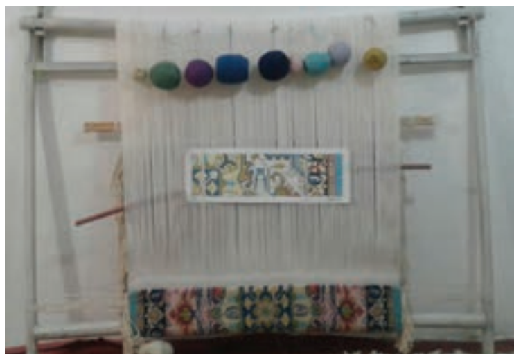
شکل ۲۰-۱- مقاوم نبودن سر دار و زیر دار در این تصویر کاملاً مشهود است.

مورد دارهای چوبی، باید بیشتر مورد توجه قرار گیرد. چوب مورد استفاده برای سر دار و زیر دار باید خشک، سالم و در صورت امکان «عمل آورده شده» باشد. انواع چوب سفید (چوب روسی)، به سبب مقاومت، کشش، برش و قابلیت انعطاف در مقابل نیروی بیشتری که از طرف چله‌ها وارد می‌شود، با دوام‌ترند.