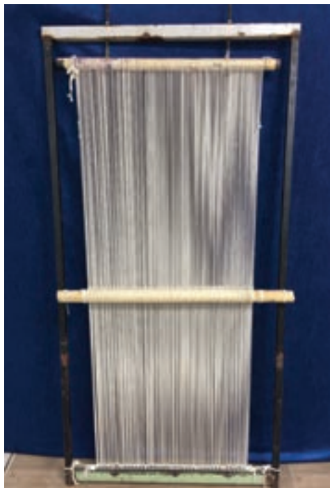
شکل ۱۱-۱- دار قالی فندک‌دار

۴- زیردار ثابت و سردار متحرک به صورت فندک‌دار