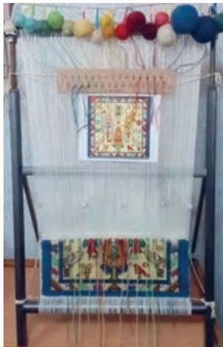
شکل ۹-۱- زیردار ثابت و سردار متحرک (مدل ۱)

۵- زیر دار و سردار هر دو گردان (شفتی یا چرخ‌دنده‌ای)