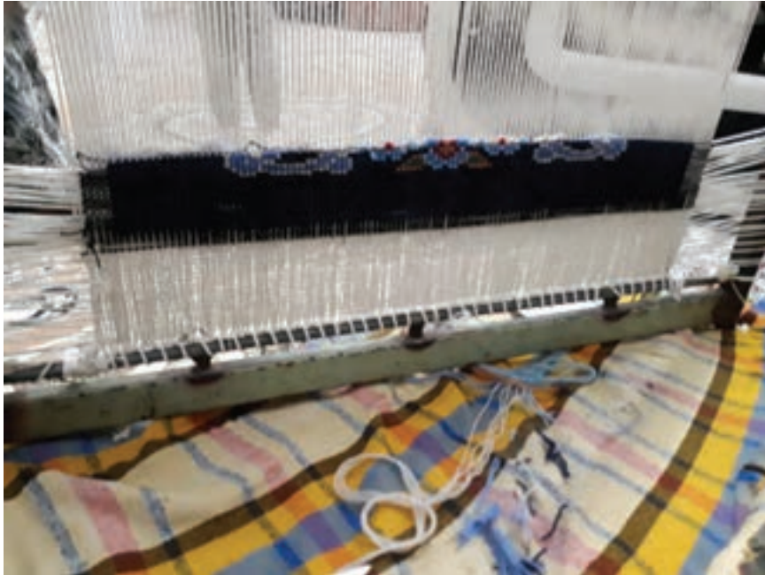
شکل ۲۶-۱- میله جوش شده، روی زیر دار از داخل، جهت دوخت ابتدای چله بعد از چله ریزی با نخ پنبه ای ضخیم

راحتی اجرای دوخت جوش شده باشد و اگر دوخت به روش میله کمکی انجام شود نیازی به میله جوش شده نیست. روش های دوخت در فصل سوم به طور کامل آمده است.