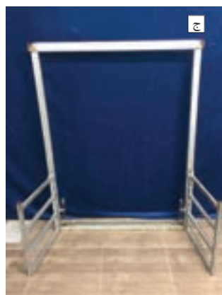
شکل ۱۹-۱- مراحل اتصال اجزای دار به یکدیگر

۲- کنترل مقاومت سردار و زیردار: این مقاومت باید نسبت به تعداد گره‌ها و عرض و طول فرش محاسبه گردد تا از صدمات احتمالی، نظیر خم شدن پیچیدگی و شکستن دار، جلوگیری شود. این محاسبه در