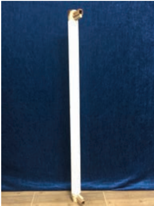
شکل ۱۸-۱- سر دار

در حقیقت چله بر روی سر دار و زیر دار قرار می‌گیرند. جنس، قطر و طول آنها بسته به نوع طراحی دار متفاوت است. چنانچه نحوه اتصال سر دار و زیر دار به راست روها پیچ و مهره باشد، باید نصب آنها با دقت انجام شود. در اغلب دارها سر دار یا زیر دار و گاهی هر دو متحرک‌اند، یعنی قابلیت جابه‌جایی و ثابت شدن دارند.