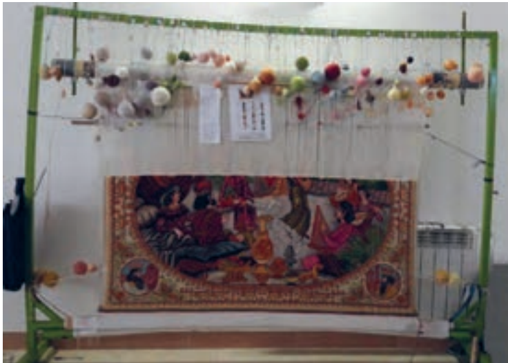
شکل ۲۱-۱- مقاوم نبودن راست روها در این تصویر کاملاً مشهود است

۳- کنترل مقاومت راست روها؛ راست روها نیز مانند سر دار و زیر دار، با توجه به ابعاد و نوع دار، باید از استحکام لازم برخوردار باشند.