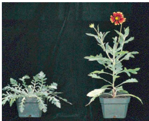
تأثیر هورمون جیبرلین بر اندازه گل و گیاه