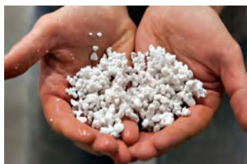
پرلیت مورد استفاده در بستر کشت

پرلیت: این ماده معدنی منشأ آتشفشانی دارد. این مواد را از گدازه‌های آتشفشان جمع‌آوری نموده و سپس در کوره‌های مخصوص دوباره حرارت می‌دهند. در اثر خروج رطوبت از این گدازه‌ها آن را تبدیل به دانه‌های بسیار سبکی می‌کند که کاملاً ضد عفونی می‌باشد. این ماده خنثی بوده و فاقد هر ماده غذایی می‌باشد. ولی معمولاً باعث افزایش تهویه در محیط‌های کشت می‌شود و در ترکیب با بقیه بسترها به کار می‌رود.