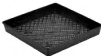
انواع سینی کاشت (توبی و معمولی)