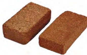
بلوک کوکوپیت قبل از مصرف باید کاملاً جدا و نرم شود