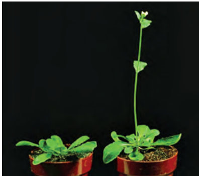
تأثیر ورنالیزه شدن بر روی گیاه

بذر بعضی از گل‌ها و گیاهان باغچه‌ای بسیار بد جوانه می‌زنند و درصد بذرهایی که تلف می‌شوند بسیار زیاد است و گاهی به ۴۰ درصد نیز می‌رسد.