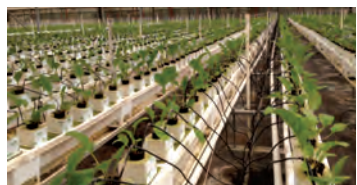
بستر کشت پشم سنگ برای گیاهان باغچه‌ای

پشم سنگ (راک وول): این ماده منشأ معدنی داشته و پس از استخراج تحت دمای بسیار بالایی ذوب شده و به صورت رشته‌هایی درمی‌آید. سپس با اضافه کردن موادی آنها را به صورت بلوک‌هایی درآورده و به بازار ارائه می‌نمایند. مهم‌ترین خصوصیت این ماده نگهداشتن آب فراوان به همراه تهویه بالا می‌باشد. از این جهت از این ماده در کشورهای صاحب نام در تولید و در ترکیب با بسترهای دیگر استفاده فراوان می‌شود ولی در ایران کمتر مورد استفاده قرار می‌گیرد.