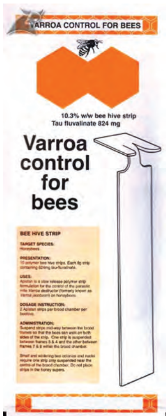
برخی از داروهای ضدکنه زنبور عسل