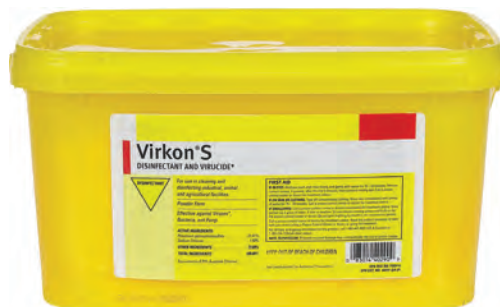
برخی از مواد ضدعفونی مورد استفاده در پرورش آبزیان

در زمینه چگونگی تهیه محلول‌های ضدعفونی کننده در پرورش آبزیان بحث کنید؟