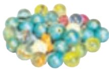
مهره و تیله