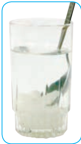
آب و قند

وقتی دو یا چند ماده را روی هم می‌ریزیم، گاهی مخلوط‌های شفاف به دست می‌آوریم؛ مانند آب و نمک یا آب و قند. اما گاهی مخلوط‌های شفاف به وجود نمی‌آیند. برای مثال، اگر ماست را با آب مخلوط کنیم، دوغ به دست می‌آید که شفاف نیست و پس از مدتی ته‌نشین می‌شود. این نوع مخلوط‌ها، محلول نیستند.