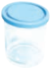
ظرف شیشه‌ای دردار