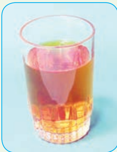
زعفران دم‌کرده و صاف شده