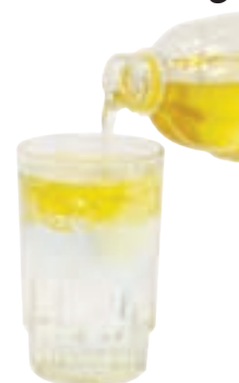
آب و روغن