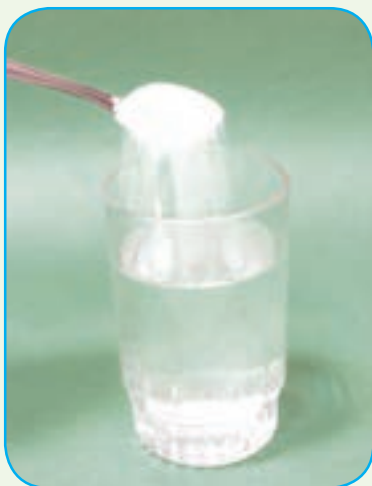
آب و نمک

در نمونه‌های زیر، مخلوط‌های یک‌نواخت را مشخص کنید. دلیل خود را بیان کنید.