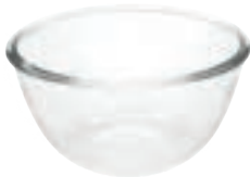
کاسه ی بزرگ