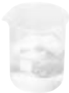
آب نیم گرم