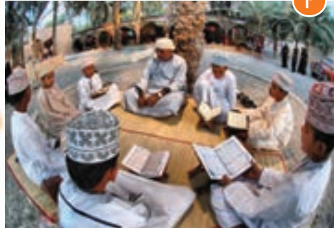
انس با قرآن کریم در کشورهای یمن ①، عمان ② و امارات ③