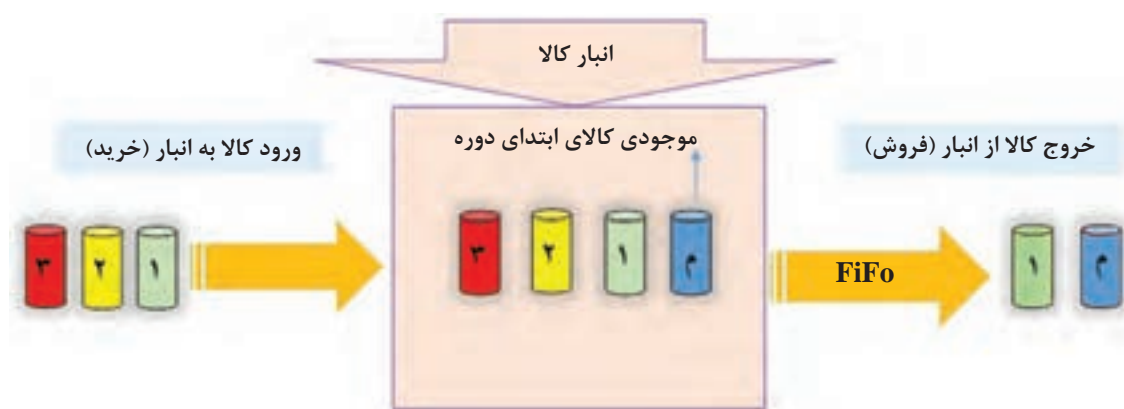
تصویر ۸-۳- جریان بهای تمام شده در روش اولین صادره از اولین وارده

در این روش کالا به همان ترتیبی که وارد انبار شده، از انبار خارج می‌شود. به عبارت دیگر در روش FIFO فرض بر این است که کالاهایی که زودتر خریداری شده‌اند، زودتر هم فروخته می‌شوند و کالاهایی که دیرتر خریداری شده‌اند، دیرتر فروخته می‌شوند و یا در موجودی کالای پایان دوره باقی می‌مانند. بنابراین می‌توان نتیجه گرفت که در این روش، مبنای محاسبه بهای تمام شده کالای فروش رفته به ترتیب قیمت موجودی کالای ابتدای دوره و خریدهای اولیه (خریدهای قدیمی) می‌باشد و مبنای محاسبه بهای تمام شده موجودی کالای پایان دوره، قیمت آخرین خریدها می‌باشد. در شرکت‌هایی که کالاهای آنها حاوی تاریخ انقضای در معرض فاسد شدن، از مد افتادن و یا از زده خارج شدن قرار دارند، استفاده از روش FIFO مناسب می‌باشد. تصویر ۸-۳ به درک این مطلب کمک می‌کند.