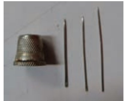
انواع سوزن و انگشتانه تصویر ۳-۴ ▲

سفید برای قسمت های تیره کار از روی طرح، نقش ها را با دست بر روی زمینه گلیم منتقل می کنند. ۳- پس از پایان انتقال طرح بر زمینه گلیم بافته شده، نقش ها در جاهای مختلف (از نظر کامل بودن و صحیح بودن انتقال)، کنترل می شوند (تصویر ۳-۵).