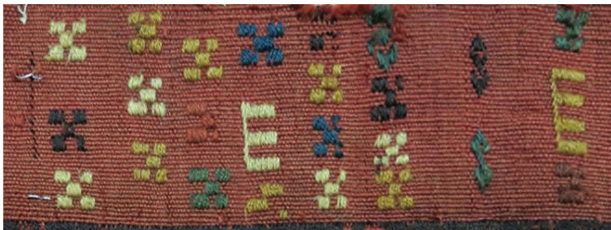
نقش‌های رنگارنگ و متنوع در بخشی از یک گلیم سوزنی تصویر ۹-۳ ▲

- برای دوخت نقوش مجاور هم رنگ، می‌توان پود را از پشت کار از یک نقش به نقش دیگر به شکل عبوری گذرانید. - انتهای پودهای رنگی را پس از دوخت قایقی و تمام شدن نقشه در پشت کار، رها می‌کنند و گره می‌زنند. - اگر جهت دوختن رج‌ها از یک سمت انجام شود دیگر فرم جناغی ایجاد نمی‌شود. اما اگر رفت و برگشت از دو جهت باشد، فرم جناغی شکل می‌گیرد.