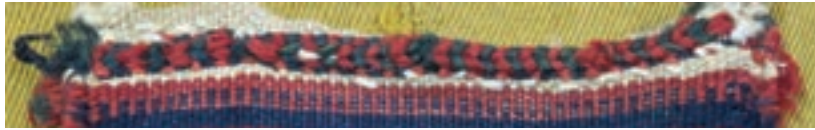
نمونه سربندی قایقی تصویر ۲-۳ ▲

در هنگام تمام شدن پود رنگی در میانه بافت، پود رنگی جدید روی کدام چله درگیر می شود؟ چرا؟