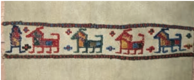
بخشی از یک گلیم سوزنی ظریف تصویر ۳-۳ ▲

پس از پایان سربندی، بافت بدنه اصلی گلیم برای سوزنی آغاز می شود. باید دانست که بدنه اصلی گلیم را به روش گلیم ساده می بافند. ضمناً غیر از گلیم عبوری یا پود معلق از انواع گلیم ساده نیز می توان به عنوان زمینه گلیم سوزنی استفاده نمود. گلیم های سوزنی زمینه یک رنگ یا چند رنگ