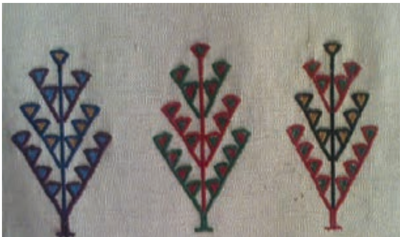
بخشی از یک گلیم سوزنی تصویر ۳-۱ ▲

آیا تاکنون گلیم سوزنی دیده‌اید؟ فکر می‌کنید چرا به این نوع گلیم سوزنی می‌گویند؟ تصویر ۳-۱ را مشاهده کنید. این تصویر یک گلیم سوزنی است. اکنون سعی کنید از روی تصویر شيوه بافت آن را حدس بزنید. فکر می‌کنید نقوش روی این گلیم چگونه بافته شده‌اند؟