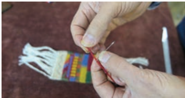
▲ تصویر ۳-۶ نخ کردن سوزن با پود رنگی

۴- چند سوزن را که با پود در رنگ مورد نیاز نخ شده است، آماده می‌کنند.