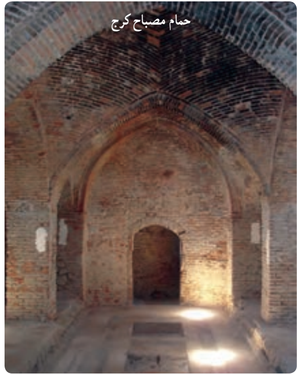
حمام مصباح کرج