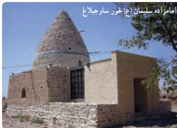
شکل ۵-۱۲- امامزاده ها اصلی ترین مکان های زیارتی استان