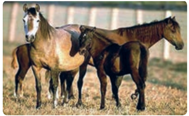
شکل ۶-۱۳- پرورش اسب و شترمرغ

موقعیت کوهستانی همراه با دامنه‌های سرسبز و سودآوری مناسب سبب شده که استان یکی از کانون‌های مهم فعالیت زنبورداری باشد. شهرستان طالقان و ارتفاعات کهار از مراکز اصلی تولید عسل محسوب می‌شوند.