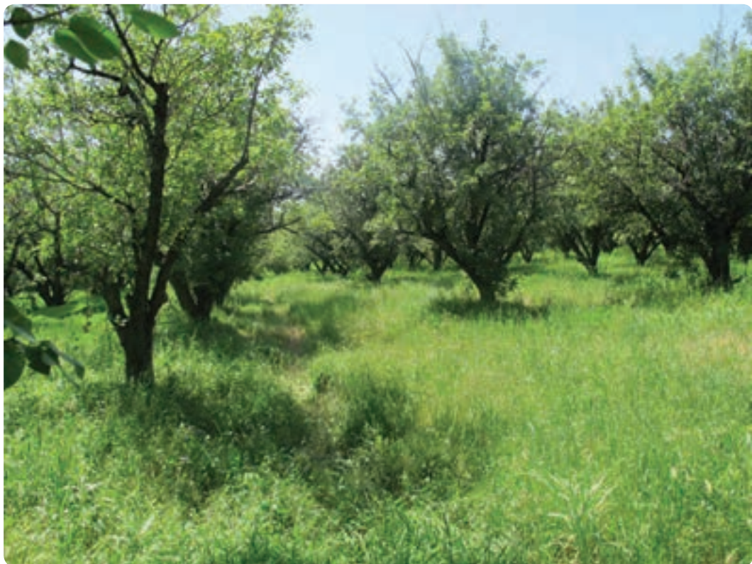
شکل ۳-۱۳- باغ‌های میوه در ناحیه دشت

شهرستان‌های ساوجبلاغ، کرج، اشتهارد و طالقان از نظر وسعت اراضی زراعی در رتبه‌های بعدی قرار دارند. بیشتر فعالیت‌های کشاورزی در این مناطق به صورت باغداری است.