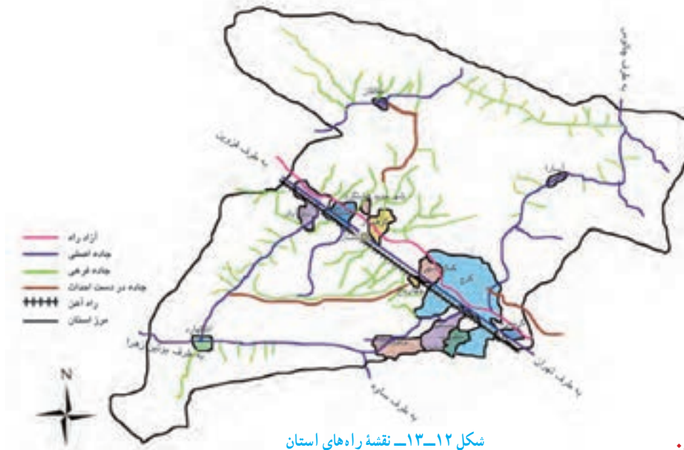
شکل ۱۲-۱۳- نقشه راه‌های استان