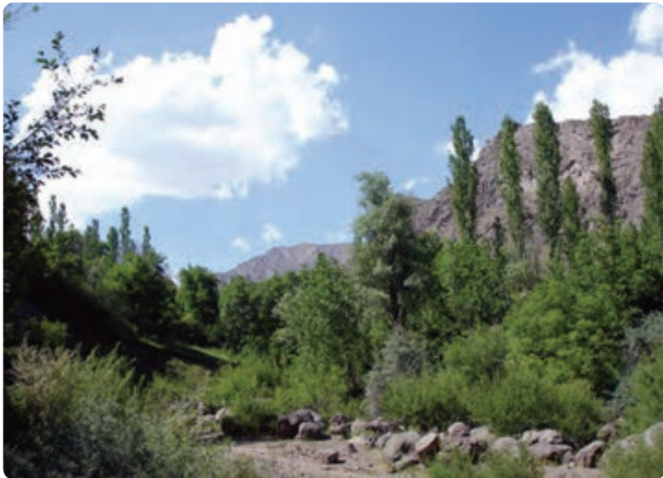
شکل ۱-۳- باغ‌های میوه در ناحیه کوهستانی

نواحی کشاورزی استان به دو بخش تقسیم می‌شود که عبارت‌اند از: ۱- ناحیه کوهستانی، ۲- ناحیه دشت ۱- ناحیه کوهستانی: این ناحیه به علت آب و هوای معتدل کوهستانی، وجود رودخانه‌های پر آب و زمین‌های ناهموار بیشتر به صورت باغ‌های میوه در امتداد دره‌های کوهستانی و رودخانه‌ها مورد استفاده قرار می‌گیرد.