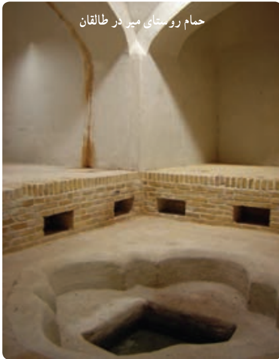
حمام روستای میر در طالقان

۲- بناهای تاریخی: این بناها شامل کاروانسراها، حمام‌های تاریخی، عمارت‌ها و کاخ‌های دوران پهلوی، پل‌ها، آسیاب‌ها و برج‌های تاریخی می‌باشند که گردشگران فرهنگی و تاریخی را به خود جذب می‌کنند. پل شاه‌عباسی، برج کردان، برج میدانک جاده چالوس، حمام مصباح کرج و شهرک طالقان، کاخ مروارید مهرشهر، آسیاب آبی مهدی آباد نظرآباد شاخص‌ترین این بناها محسوب می‌شوند.