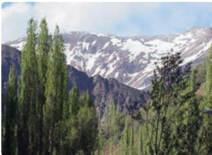
شکل ۲-۱۲ ارتفاعات شمال استان از مناطق عمده گردشگری