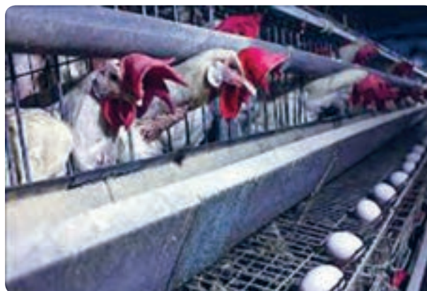
شکل ۵-۱۳- واحدهای مرغداری و گاو‌داری صنعتی

پرورش شتر، اسب، شترمرغ، بلدرچین و ...، از دیگر فعالیت‌های دام و طیور است که در سال‌های اخیر مورد توجه قرار گرفته است.