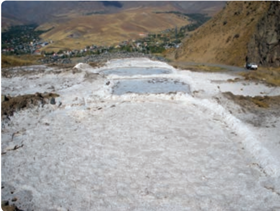
شکل ۱۱-۱۳- معدن نمک در طالقان

معادن : استان البرز وسعت چندان زیادی ندارد اما ۱۱۱ معدن دارای پروانه بهره‌برداری در شهرستان‌های آن فعال‌اند. وجود ۳۸ معدن غیر فعال و ۳ معدن در حال اکتشاف نیز از دیگر ظرفیت‌های استان است. معادن در حال بهره‌برداری بیشتر سنگ‌های ساختمانی، گچ و معدن زغال سنگ باریت، سنگ‌های تزئینی می‌باشند.