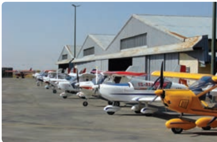
شکل ۹-۱۲- مرکز آموزش هوایی صالحیه نظرآباد

دریاچه سد کرج و طالقان، مرکز آموزش هوایی در صالحیه نظرآباد، پیست اسکی خور «در جاده چالوس» و ارتفاعات نورالشهدای عظیمیه از دیگر توان‌های استان برای گردشگری است.