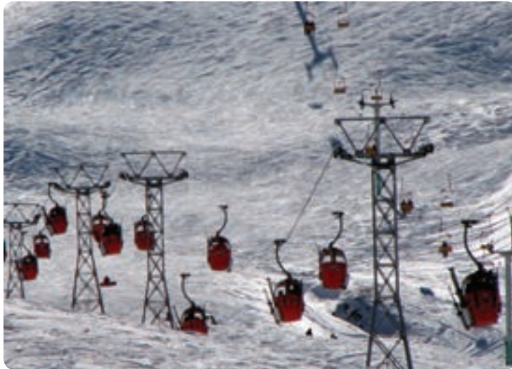
شکل ۸-۱۲- پیست دیزین

علاوه بر این مسیر جاده‌های کردان و جاده طالقان از دیگر محورهای گردشگری استان محسوب می‌شوند. پیست اسکی دیزین: این پیست از مهم‌ترین پیست‌های اسکی کشور است و به دلیل وجود امکانات رفاهی، تله‌کابین، تله اسکی، برگزاری مسابقات بین‌المللی، علاقه‌مندان ورزش‌های زمستانی را به خود جذب می‌کند. در فصل تابستان نیز علاوه بر اسکی روی چمن، ارتفاعات این پیست پوشیده از انواع گل‌های وحشی و گیاهان دارویی است. هوای مطبوع و مجموعه‌های آموزشی-رفاهی خانواده‌ها را به سوی خود می‌کشاند.