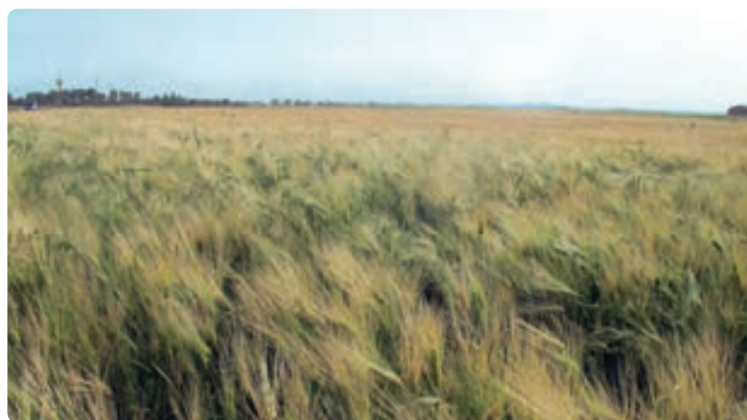
شکل ۲-۱۳- ذرت علوفه‌ای و گندم اصلی‌ترین محصولات کشاورزی دشت‌های استان