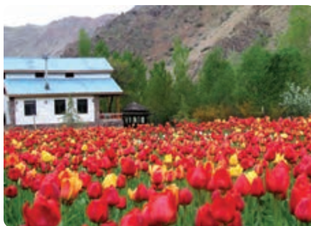
شکل ۱-۱۲- جاذبه‌های عمده گردشگری استان