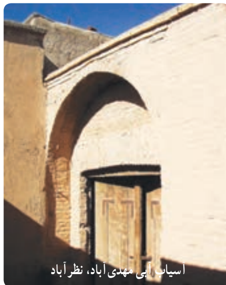
اسیاب آبی مهدی آباد، نظرآباد