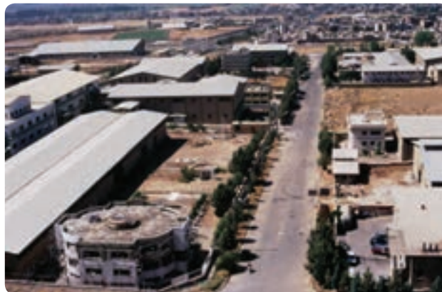
شکل ۹-۱۳- شهرک صنعتی در استان

در استان ۲۸۳۰ واحد صنعتی فعال وجود دارد که ۳ درصد از کل صنایع و ۴ درصد از نیروی شاغل صنعتی کشور را در بر می‌گیرد. بخش قابل توجهی از نیروی فعال اقتصادی در واحدهای صنعتی استان‌های مجاور مشغول به کارند؛ که این تعداد جزء نیروی شاغل صنعتی استان به حساب نیامده‌اند. استان البرز با هفت شهرک صنعتی فعال یکی از مراکز مهم صنعتی کشور محسوب می‌شود. صنایع غذایی، برق، الکترونیک، فلزی و سلولزی از مهم‌ترین واحدهای فعال آن به‌شمار می‌روند.