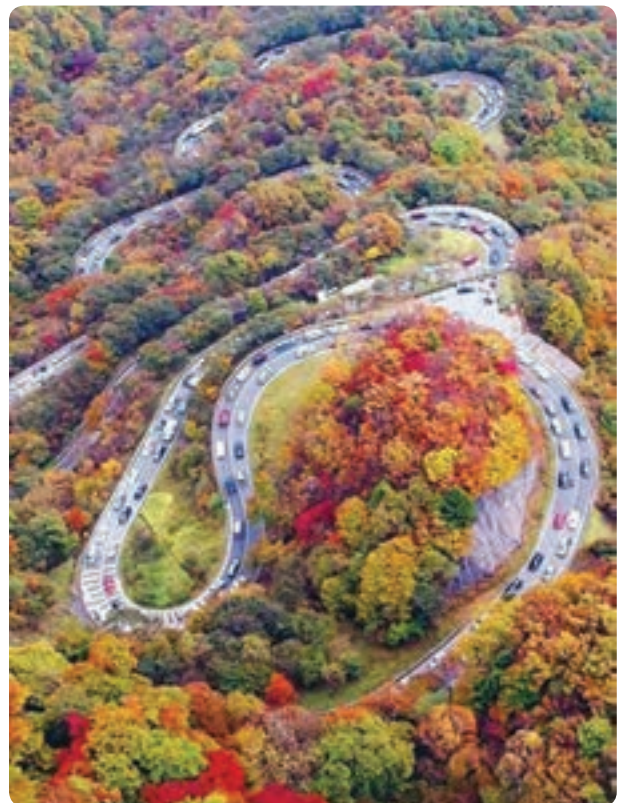
شکل ۷-۱۲- منظره طبیعی – تاریخی محور ارتباطی کرج، چالوس