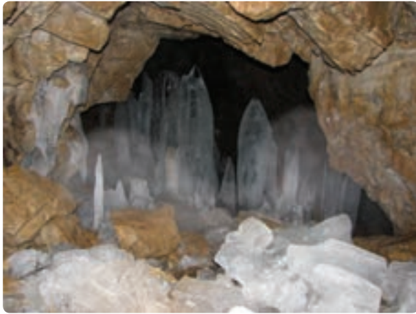
شکل ۳-۱۲- غار یخ مراد

۲- غارهای طبیعی : این غارها در اثر عوامل فرسایش ایجاد شده‌اند و مشاهده آن برای جغرافیدانان، زمین‌شناسان و دوستداران طبیعت لذت‌بخش است. از جمله این غارها یخ‌مراد در محور کرج - چالوس است که در دوره دوم زمین‌شناسی ایجاد شده و در اغلب اوقات سال دارای قندیل‌های یخی است. از دیگر غارهای طبیعی می‌توان به غار «وایسوار» در روستای هیو ساوجبلاغ اشاره کرد.