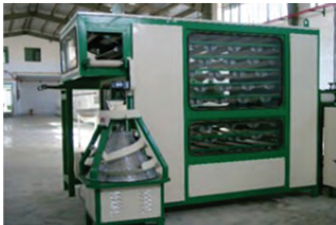
شکل ۱۴- گردکن و اتاق تخمیر ثانویه