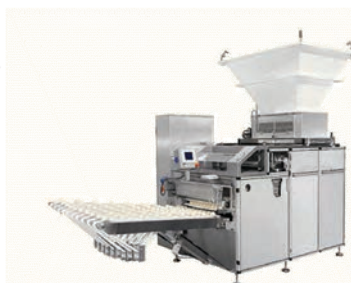
شکل ۱۰- تصاویر دستگاه چانه‌گیر