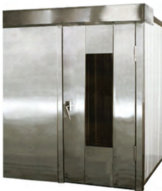
شکل ۸- اتاق تخمیر