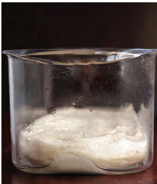
تصویر خمیر قبل از تخمیر اولیه