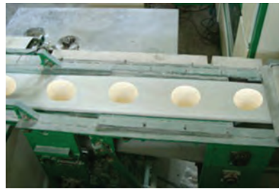
شکل ۱۳- دستگاه گردکننده