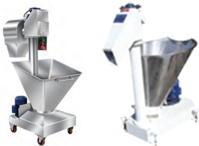
شکل ۴- دستگاه الک آرد