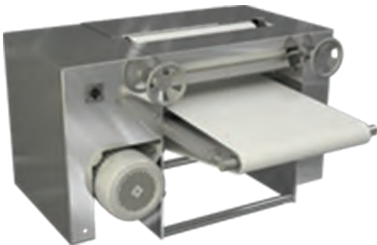
شکل ۱۷- دستگاه پهن‌کن دو غلتکی

پس از تخمیر میانی، به منظور شکل‌دهی چانه‌ها باید عملیاتی مانند لوله‌کردن، دو یا چندقلو کردن، بافتن، گره‌زدن و یا روی هم قرار دادن و سایر عملیات فرم‌دهی انجام شود. عملیات قالب‌گیری روی ویژگی‌هایی مانند شکل ظاهری، درجه پوکی، خلل و فرج و در نتیجه حجم نان تأثیر می‌گذارد. پس از فرم‌گرفتن، چانه‌ها در سینی‌های مخصوص قرار می‌گیرند.