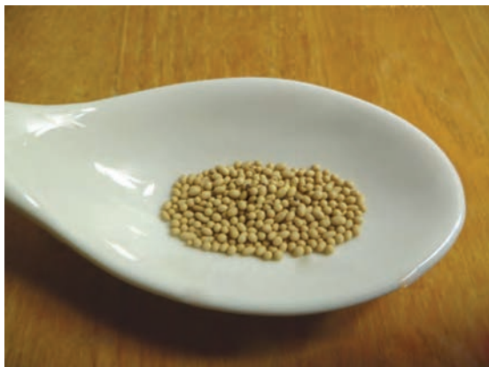
مخمر خشک معمولی

۵ قدرت آرد: آرد حاصل از گندم‌های مختلف دارای مقادیر متفاوت از گلوتن و سایر ترکیبات است. این امر، سبب تفاوت قدرت خمیر حاصل از آردهای گوناگون می‌شود. مخمر نانوایی: انواع مخمر مورد استفاده در تهیه نان به شرح زیر است: – مخمر خشک: مخمر خشک به دو صورت فوری و معمولی تولید می‌شود و رطوبت آن بین ۳ تا ۸ درصد است. نوع معمولی، ابتدا باید آماده‌سازی و فعال شود. به این صورت که مخمر با بخشی از آب و کمی شکر مخلوط شده به مدت ۱۵ دقیقه در دمای ۳۵-۴۰ درجه سلسیوس قرار می‌گیرد. نوع فوری، نیازی به آماده‌سازی و فعال شدن نداشته و می‌تواند مستقیماً به خمیر اضافه شود.