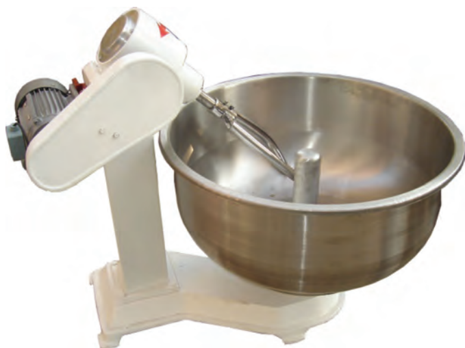
شکل ۶- خمیرگیر دوکی

خمیرگیرها به دو نوع مداوم و غیرمداوم تقسیم می شوند. بسیاری از تولیدکننده های نان صنعتی از نوع غیرمداوم استفاده می کنند. چون کنترل میزان اختلاط و نسبت آرد به آب در آنها به آسانی انجام می شود. خمیرگیرهای غیرمداوم دو دسته اند: برخی دارای تغار دوار بوده و برخی تغار ثابت داشته و از یک یا دو بازو (اهرم) که به صورت مارپیچ هستند تشکیل شده اند. خمیرگیرهای مرسوم در صنعت نان از لحاظ نوع بازو به انواع دوکی و مارپیچی تقسیم می شوند که در زیر تصویر آنها آمده است.