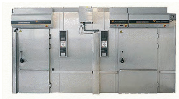
شکل ۱۸- تصاویر فر چندطبقه

۲ فر طبقه‌ای با پایه متحرک: این نوع فر شبیه فر طبقه‌ای است. در این فر، خمیر روی طبقات فلزی قرار می‌گیرد.