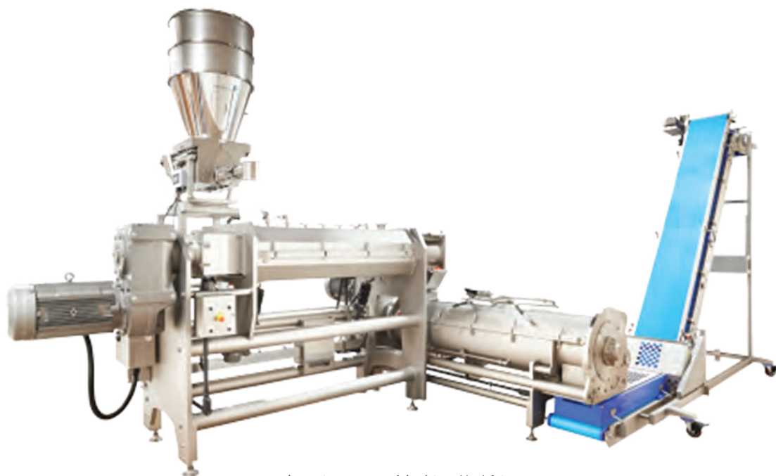
شکل ۷- مخلوط کردن به روش مداوم

در اثر مخلوط کردن، مواد اولیه جامد با آب مخلوط شده، ذرات آرد به صورت همگن و یکنواخت در آب حل شده و متورم می‌شوند.