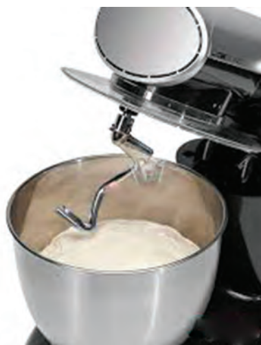
شکل ۵- خمیرگیر مارپیچی

کاربرد روش مداوم نیاز به دانش و تخصص بیشتری دارد. در این روش مواد اولیه توسط دستگاه های توزین به طور خودکار وارد محفظه خمیرگیر شده و عملیات مخلوط شدن و انتقال خمیر به بخش های بعدی به طور پیوسته انجام می شود. (شکل ۷) ظرفیت تولید خمیر این دستگاه ها، در مقایسه با انواع غیرمداوم بالاتر است.