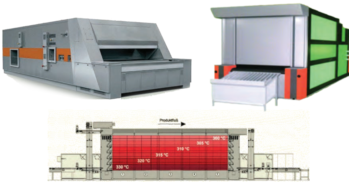
شکل ۲۰- تصاویر فر تونلی

۵ فر تونلی: در این نوع فر، نان روی تسمه‌ای که طول آن تا ۳۰ متر می‌رسد حرکت کرده و از فضای داخلی فر که دمای آن در قسمت‌های مختلف قابل تنظیم است، عبور می‌کند، سرعت نقاله فر را می‌توان تغییر داد و بر این اساس مدت زمان پخت تنظیم می‌شود. در فرهای تونلی حرارت غیرمستقیم بوده و براساس سیستم هوای داغ، گرما به درون فضای داخلی فر پخت فرستاده می‌شود. نان ابتدا حرارت زیادی دیده و به مرور در معرض حرارت کمتری قرار می‌گیرد. (شکل ۲۰)