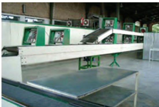
شکل ۲۲- باند خنک‌کننده نان