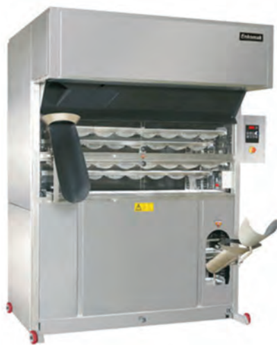
شکل ۱۵- دستگاه تخمیر میانی