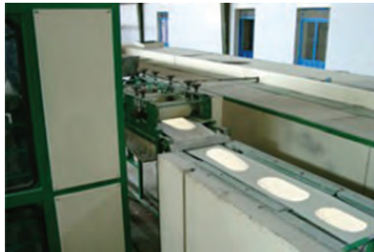
شکل ۱۶- فرم‌گرفتن خمیر نان مسطح

پس از قالب‌گیری تخمیر نهایی انجام می‌گیرد. تخمیر نهایی در اتاقک‌های مخصوص و یا واگن‌های تخمیر با رطوبت نسبی ۸۵-۸۰ درصد و دمای ۳۷-۳۵ درجه سلسیوس به مدت ۳۰ تا ۶۰ دقیقه انجام می‌شود. در این مرحله فرایندهایی به شرح زیر رخ می‌دهد: