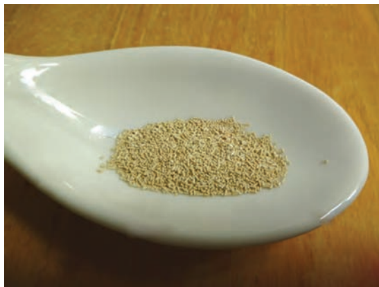
مخمر خشک فوری