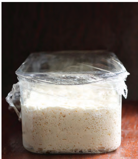
تصویر خمیر بعد از تخمیر اولیه