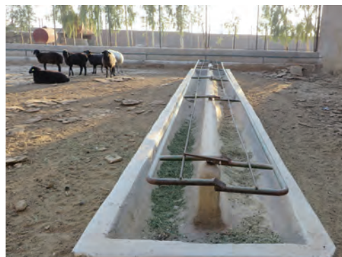
آخور دو طرفه