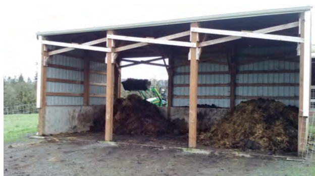
انبار نگهداری و ذخیره کود