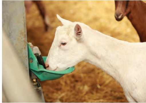
آبشخور خودکار مخصوص گوسفند و بز

جدول ۲- ابعاد توصیه‌شده آبشخور به ازای هر رأس گوسفند و بز در سنین مختلف (سانتی‌متر)