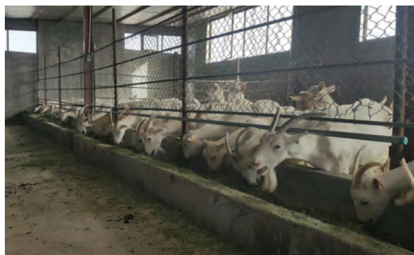
آخور یک طرفه