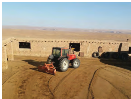
جمع آوری کود با تراکتور