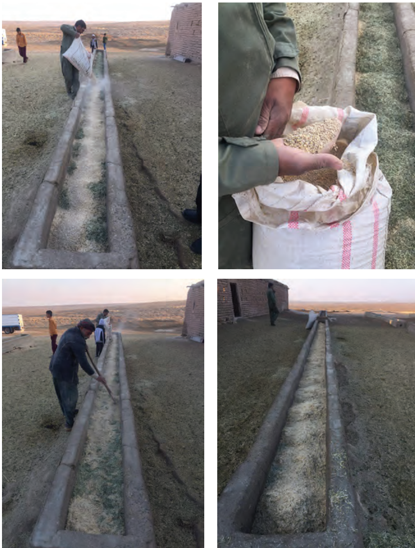
توزیع خوراک در آخورها به روش دستی