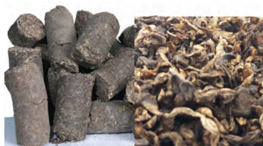
تفاله چغندر قند به صورت پرک و پلت

تفاله چغندر قند: حجیم، خوش خوراک و ارزان است که دارای مواد قندی زیاد بوده و حدود ۹/۶ درصد پروتئین و ۰/۵ درصد چربی است. از نظر کلسیم غنی و از لحاظ فسفر ضعیف می‌باشد. تفاله ممکن است به صورت خشک مصرف شود، اما اکثراً تفاله چغندر را با نسبت مناسب آب مخلوط می‌کنند تا مرطوب شود و بافت مناسبی پیدا کند و سپس در جیره دام وارد می‌کنند.