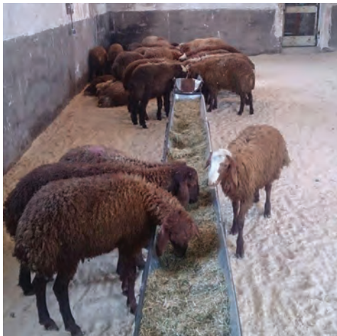
تغذیه یونجه و کاه در آخور

جیره غذایی مخلوطی از چند ماده خوراکی است که دارای مقدار و نسبت صحیحی از انرژی و مواد مغذی مختلف بوده و چنانچه روزانه و به میزان کافی در اختیار دام قرار گیرد، احتیاجات آن را از نظر انرژی، پروتئین، مواد معدنی و سایر مواد مغذی در این مدت تأمین می‌کند.