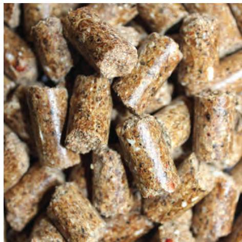
نمونه‌ای از جیره پلت

به طور کلی با توجه به نژاد، جنس، وزن، وضعیت دام و مانند آن چند نوع جیره غذایی وجود دارد: 1 جیره نگهداری: جیره‌ای است که دام با مصرف آن هیچ نوع تولید و افزایش یا کاهش وزنی نخواهد داشت و شرایط دام را از نظر سرزندگی، سلامت و وضعیت طبیعی حفظ می‌کند. جیره مذکور در حقیقت حداقل نیاز یک حیوان است.