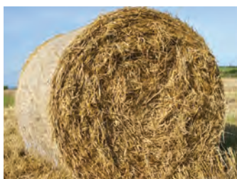
کاه و کلش حاصل از غلات