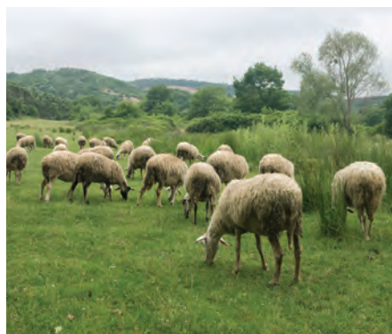
تغذیه از چراگاه

روش های تغذیه را می توان به انواع تغذیه از چراگاه و تغذیه دستی تقسیم بندی کرد.