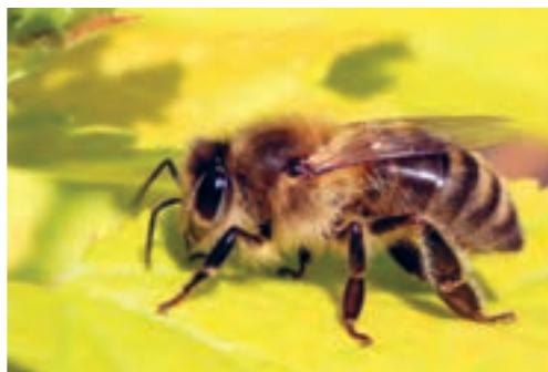
زنبور عسل معمولی