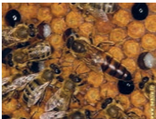
زنبور عسل قفقازی

د) زنبور عسل قفقازی : موطن اصلی این نژاد در دره‌های قفقاز مرکزی است. از نظر شکل، اندازه بدن و موها بسیار به نژاد کارنیولان شبیه است ولی رنگ بدن آن تیره‌تر از نژاد کارنیولان است. دارای خرطوم نسبتاً طولی است، زنبورهای این نژاد آرام بوده و تا قبل از فصل تابستان، کلنی قوی ایجاد می‌کند. تمایل به تولید بچه کندو پایین، ولی تولید برهموم در این نژاد بسیار زیاد می‌باشد.