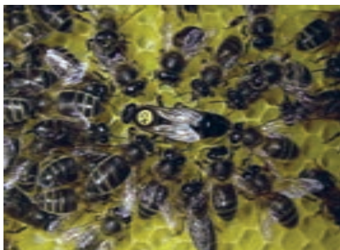
زنبور عسل تیره اروپا

ج) نژاد زنبور عسل تیره اروپا: موطن اصلی این نژاد تمام اروپا، غرب و شمال آلپ و مرکز