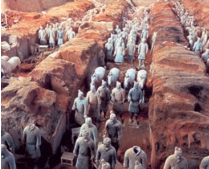
مقبره‌ی امپراتور شی‌هان‌دی - منطقه‌ی زیان‌شان‌زی - چین

نظر به این‌که تقسیم دوران‌های تاریخی به سه بخش قرون قدیم، قرون میانه و قرون جدید، ابتدا از سوی مورخان اروپایی به میان آمده، طبیعی است که در مورد سرزمین‌ها و ملت‌های اروپایی به کار رفته باشد.