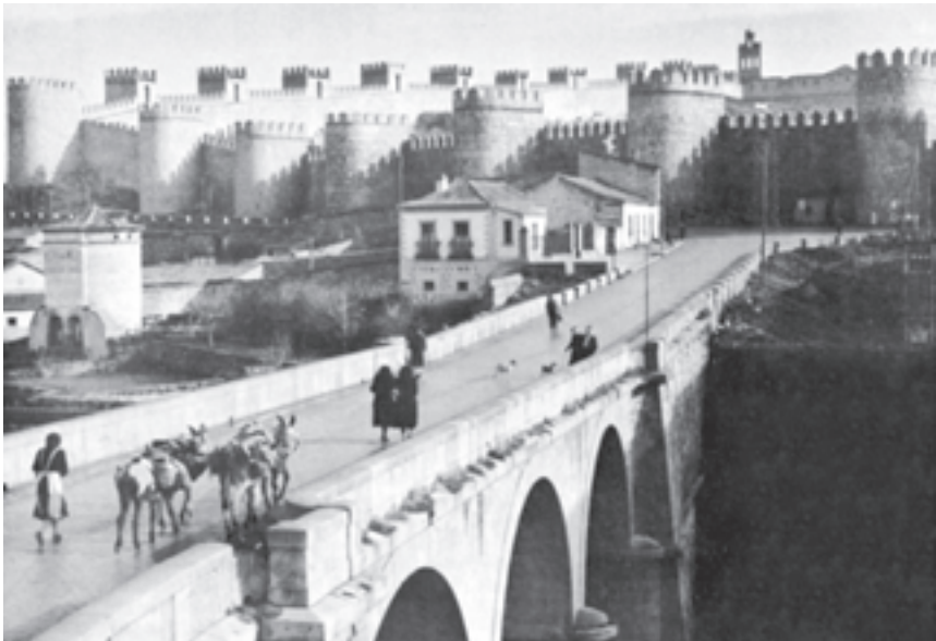
دیواره‌های شهر باستانی آویلا - مرکز اسپانیا - ساخت مسلمانان شمال آفریقا

در قرون وسطی تنها یک کشور بود که کاملاً از دایره‌ی درگیری زبان لاتین و زبان‌های عامیانه بیرون می‌زیست و آن اسپانیای مسلمان بود که ادبیات و به طور کلی تمدن اسلامی آن تأثیر عظیمی در دنیای غرب داشت. شعر عربی آندلس در قرون دهم و یازدهم، شاید به استثنای شعر سلتی، یگانه شعر غیر لاتینی بود که در دنیای غرب حایز اهمیت بود. این شعر مستقیماً از شرق و به خصوص از بغداد می‌آمد که در آن زمان مرکز علمی و ادبی جهان اسلام بود. در اسپانیا نیز «قرطبه» چنین مقامی داشت. از این رو می‌توان شعر و تاریخ‌نگاری مسلمانان اسپانیا را در ردیف زبان‌های ملی نوزاد قرار داد؛ زیرا شاخه‌ای از شعر و تاریخ‌نگاری شرق مسلمان بود و چه شاخه‌ی سترگی! شعری که با همه‌ی ظرافت‌های آثار شاعران دربار خلفای بغداد برابری می‌کرد و ادبیات و فلسفه‌ای چنان غنی از اندیشه‌ی فلاسفه‌ی باستانی و مسایل انسانی، که می‌توان با استناد به آن، از نوعی انسان‌گرایی اسلامی اسپانیا سخن گفت. چنان که گفتیم غرب بیگانه با ادبیات و فلسفه‌ی یونان قدیم، از طریق اسپانیای مسلمان بود که دوباره با آثار بزرگان باستان آشنا شد.