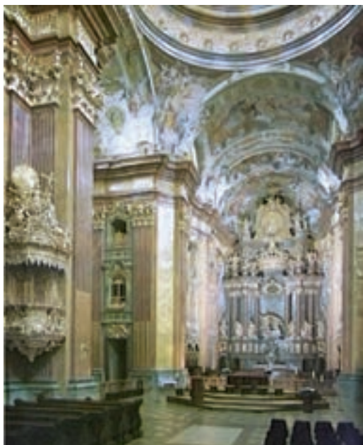
کلیسا - معماری دوران مسیحیت

ادبیات اروپا معمولاً با مکتب کلاسیک آغاز می‌شود. اساسی‌ترین تعریفی که از این مکتب ارایه می‌شود «بازگشت به هنر قدیم یونان و روم به تبع نهضت رنسانس و اومانیزم» است. امپراتوری روم غربی (در قرن پنجم میلادی) حتی پیش از سقوط، ارتباط خود را با فرهنگ و ادب یونان بریده بود و وارث فرهنگ یونانی، و حتی مرکز قدرت امپراتوری روم شرقی بود. در غرب به علت رسمیت یافتن زبان لاتین به جای یونانی، حتی در قرون چهارم و پنجم، بی‌توجهی به زبان و فرهنگ یونانی نیز تشدید شده بود.