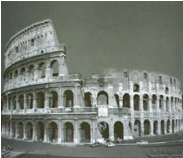
کلوزیوم - رُم ایتالیا

قرن پنجم قبل از میلاد، روم شاهد برتری نظامیان در امور مملکتی بود که قدرت مطلقه‌ی فرمانروایان را به هم ریخت و شالوده‌ی نظام جدیدی به نام جمهوری را به کار بست. آن‌چه که در ادبیات روم قابل تأمل است این است که ادبیات یونانی چنان بر زندگی مردم روم نفوذ کرده بود که نویسندگان رومی آثار خود را به تقلید از نویسندگان یونانی می‌نوشتند. «آندروونیکوس» که خود یونانی‌الاصل بود پدر ادبیات روم شناخته می‌شود. او اودیسه‌ی هومر را به زبان لاتین ترجمه کرد (حدود ۳۴۰ ق.م).