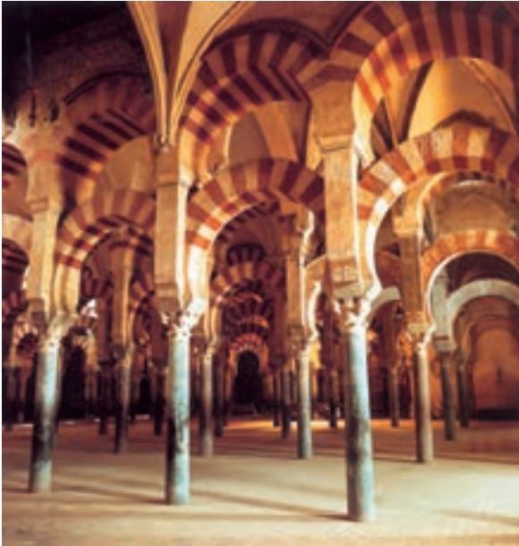
معماری مسجد مسلمانان — اسپانیا

سرگذشت مردی اشرافی و در عین حال سفیهی به نام دن کیشوت را که مجذوب داستان‌های قهرمانان گذشته شده، با زبان مضحک و در عین حال غم‌انگیز، بیان می‌کند. دن کیشوت، به امید انجام کارهای خیر (همچون شوالیه‌ها) به سیر و سفر می‌پردازد. او سراسر، نجابت و شرافت است، لیکن در قالبی احمقانه. سروانتس در این داستان، نه فقط اشراف روبه زوال اسپانیا، بلکه خود اسپانیا را به نقد می‌کشد.