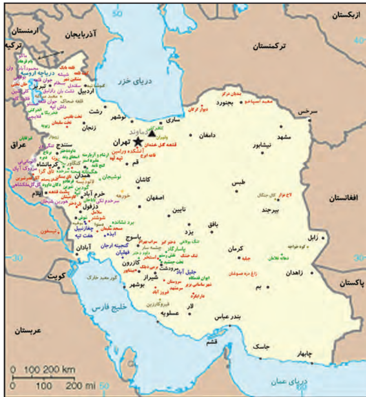
▲ شکل ۲- نقشه مناطق برجسته باستانی در ایران