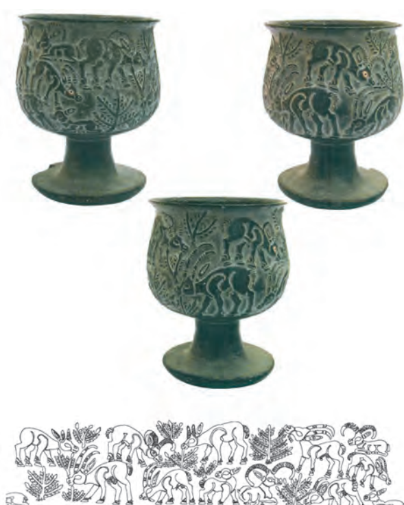
▲ شکل ۳- ظرف سنگی، تمدن جیرفت، هزاره سوم پ.م

برجسته و کاشی لعاب دار، کشف شده شد (شکل ۲). به دلیل این توجه، علاقه به حفاری در مناطق باستانی روز به روز بیشتر می‌شود. اولین زمینه فعالیت‌های رسمی باستان‌شناسی در ایران کاوش در منطقه باستانی شوش بوده که در بین سال‌های ۳۱-۱۲۲۹ شمسی انجام پذیرفته است. پس از فعالیت گروه‌های باستان‌شناسی در ایران توسط باستان‌شناسان خارجی و داخلی آنچه به تحقق رسید آشکارسازی و شناخت فرهنگ تاریخی و ملی ایران است که همچنان ادامه دارد. از مهم‌ترین یافته‌های جدید به همت باستان‌شناسان ایرانی کشف منطقه باستان‌شناسی ناشناخته دشت لوت به ویژه سرزمین آرت در جیرفت با قدمتی ۵۰۰۰ ساله است. براساس آثار به دست آمده می‌توان دریافت که این منطقه تاریخی دارای رشد فرهنگی و بالنده‌ای بوده و در اواخر هزاره چهارم پیش از میلاد شکل گرفته است. با این کشف چنین به نظر می‌رسد که بایستی دید تازه‌ای نسبت به شکل‌گیری مناطق و تمدن‌های همجوار داشت (شکل ۳).