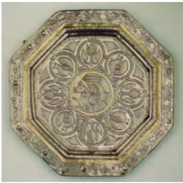
▲ شکل ۸-۹ - ظرف فلزی، نقره طلا اندود، سده سوم هجری

همچنین در این دوره هنر فلزکاری بازمانده از دوران ساسانی ادامه یافت و ظروف بزرگ و باشکوهی تولید شد (شکل ۸-۹). اما به دلایل گوناگون هیچ نمونه‌ای از مصورسازی کتاب دیده نشده و تنها نمونه موجود شاید همان نسخه ارژنگ مانی (یافته شده در منطقه تورفان ۱ در سده دوم و سوم هجری) باشد. آثار پراکنده به ویژه دیوارنگاری‌های دوران حکومت‌های اسلامی (اموی و عباسی) و یا نگاره‌های سفالینه‌ها، بیانگر تداوم سنت نقاشی از دوره ساسانی به دوره آغازین اسلامی است. اما منابع مشخصی برای تعیین ماهیت نقاشی این دوران نیست و بیشترین اعتبار نقاشی را بایستی در سده‌های بعد شاهد باشیم (شکل ۸-۱۰).