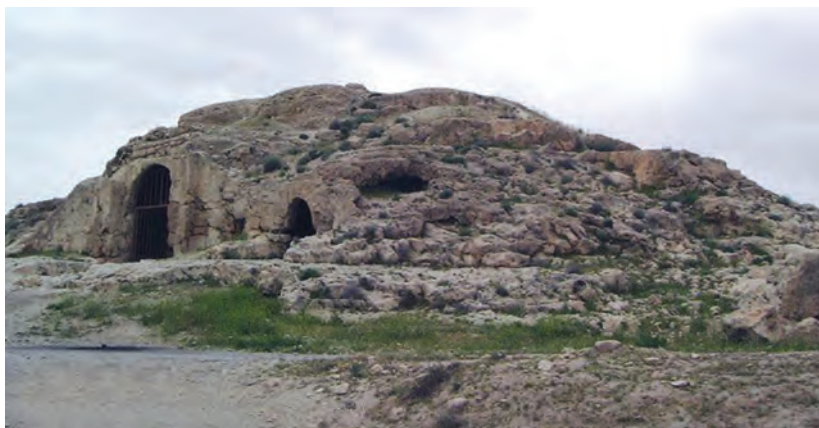
▲ شکل ۱-۸ - مسجد سنگی داراب گرد

نظام معماری اسلامی همان‌گونه که اشاره شد مستقیماً ریشه در سنت ساسانی داشته و از همان آغاز برخی از کاخ‌ها و آتشکده‌های ساسانی بدون هیچ‌گونه اصلاح و تغییری به مسجد تبدیل شده است. از نمونه‌های شاخص این تبدیل می‌توان به ایوان مدائن در تیسفون، آتشکده باستانی مسجدسلیمان و مسجد سنگی داراب گرد (در اصل آتشکده بوده) اشاره کرد (شکل ۱-۸). از آنجایی که مسجد مکان ویژه‌ای است که نه تنها مرکزیت دینی دارد بلکه در تمام دوران‌ها نهادی سیاسی، مکانی برای قضاوت و نهادی آموزشی نیز به‌شمار می‌آید، بنابراین دارای منزلتی والا بوده و رفته‌رفته می‌بایست تحولاتی در ساخت آن پدید آید. به همین علت ابتدا ساختار کلی مسجد به شیوه‌ای ستون‌دار یعنی با شبستان‌های ستون‌دار (چهل‌ستونی) و حیاط ساخته می‌شد که جهت آن رو به قبله بود. از کهن‌ترین مساجد شناخته شده در ایران می‌توان به تاریخانه ۱ دامغان، مسجد فهرج یزد (روستایی اطراف یزد)، مسجد جامع شوش، مسجد جامع سیراف (بوشهر) و مسجد جامع اصفهان اشاره کرد (شکل ۲-۸). از دیگر موارد تحول یافته در ساختار معماری اسلامی وجود مدرسه است که با ساخت صحن گشاده، سرسراه‌های گنبددار و ایوان در چهار نمای حیاط معرفی می‌شود. این ساختار از الگوهای کاملاً ایرانی است که تلفیق آن با مسجد در مسیر تحول خود عالی‌ترین الگوی تلفیق معماری مسجد و مدرسه را به بار آورد.