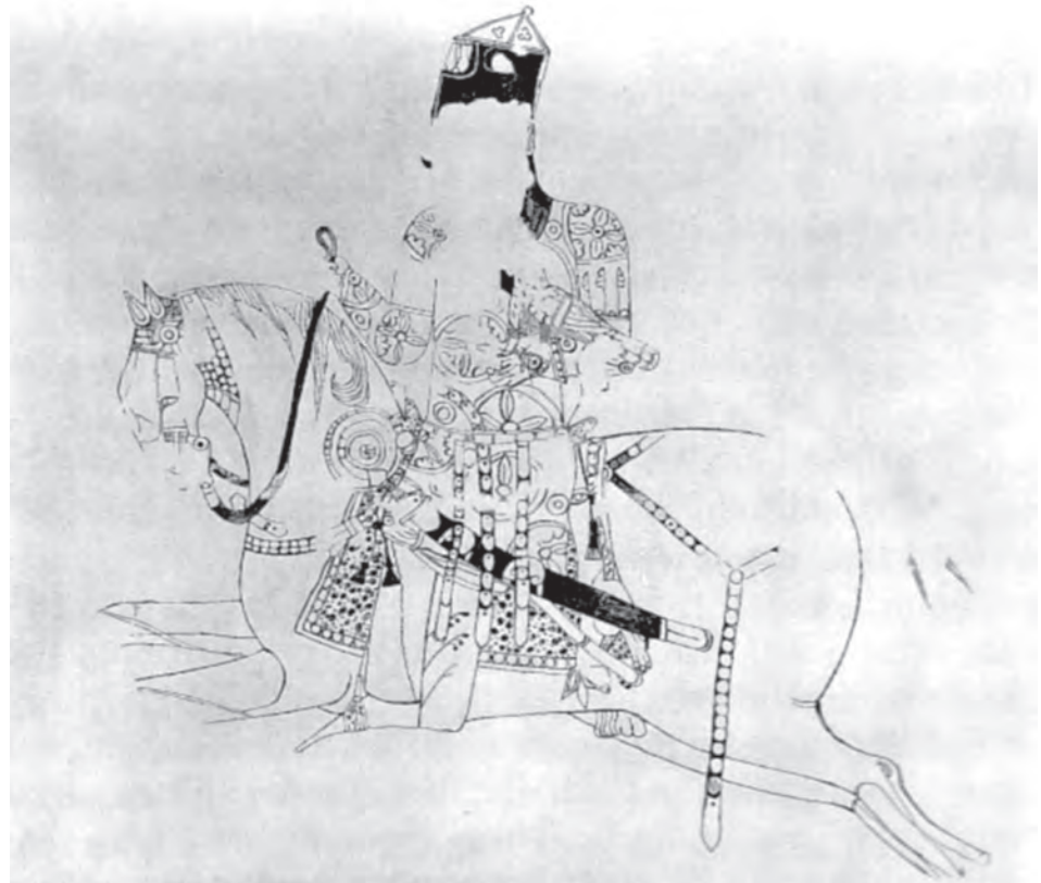
▲ شکل ۸-۱۰ - نقاشی دیواری، نیشابور، سده سوم و چهارم هجری

همچنین در این دوره هنر فلزکاری بازمانده از دوران ساسانی ادامه یافت و ظروف بزرگ و باشکوهی تولید شد (شکل ۸-۹). اما به دلایل گوناگون هیچ نمونه‌ای از مصورسازی کتاب دیده نشده و تنها نمونه موجود شاید همان نسخه ارژنگ مانی (یافته شده در منطقه تورفان ۱ در سده دوم و سوم هجری) باشد. آثار پراکنده به ویژه دیوارنگاری‌های دوران حکومت‌های اسلامی (اموی و عباسی) و یا نگاره‌های سفالینه‌ها، بیانگر تداوم سنت نقاشی از دوره ساسانی به دوره آغازین اسلامی است. اما منابع مشخصی برای تعیین ماهیت نقاشی این دوران نیست و بیشترین اعتبار نقاشی را بایستی در سده‌های بعد شاهد باشیم (شکل ۸-۱۰).