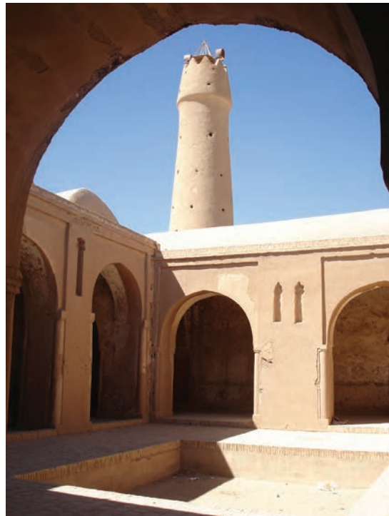
▲ شکل ۸-۲ - مسجد تاریخانه، دامغان، سده اول تا سوم هجری

در دوره اسلامی استفاده از آجر به دلیل سادگی و ایجاد ترکیب‌های متفاوت، همواره ترجیح داده می‌شد. زیرا آجر از چوب بادوام‌تر و از سنگ ارزان‌تر بود. همچنین کار با آن سریع‌تر و انعطاف‌پذیرتر از سنگ بوده و می‌توانست هرگونه بنایی را با هر قابلیتی پدید آورد که همین زمینه‌ساز فرصت‌های مناسبی برای تجلی‌ترینات ساختمان‌ها شد (شکل ۸-۳).