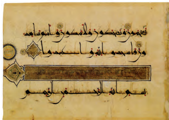
▲ شکل ۸-۸- برگه از قرآن مجید به خط کوفی، سده سوم هجری

خط کوفی به‌دست توانای یک هنرمند ایرانی به‌صورت خطی زیبا، با ارزش تزئینی بسیار بالا درآمد. هرچند خواندن آن با اشکالاتی روبه‌رو بود اما باز هم توسط هنرمندان ایرانی اصلاح شد و خطوط دیگر به‌دست محمدبن علی فارسی معروف به ابن مقله پدید آمد. خط کوفی همچنان به‌عنوان خطی تزئینی به مدت ۵ سده در نواحی مختلف به‌شیوه‌های گوناگون به کار می‌رفت. این خط به‌عنوان رایج‌ترین نقش تزئینی روی ظروف فلزی و سفالی، پارچه و یا کتیبه‌ها مورد استفاده قرار گرفت. با سیر تحول خط، از خط کوفی «اقلام سته» پدید آمد که به خطوط شش‌گانه، محقق، ریحان، ثلث، نسخ، رقاع و توقیع، شهرت یافته‌اند (شکل ۸-۸).