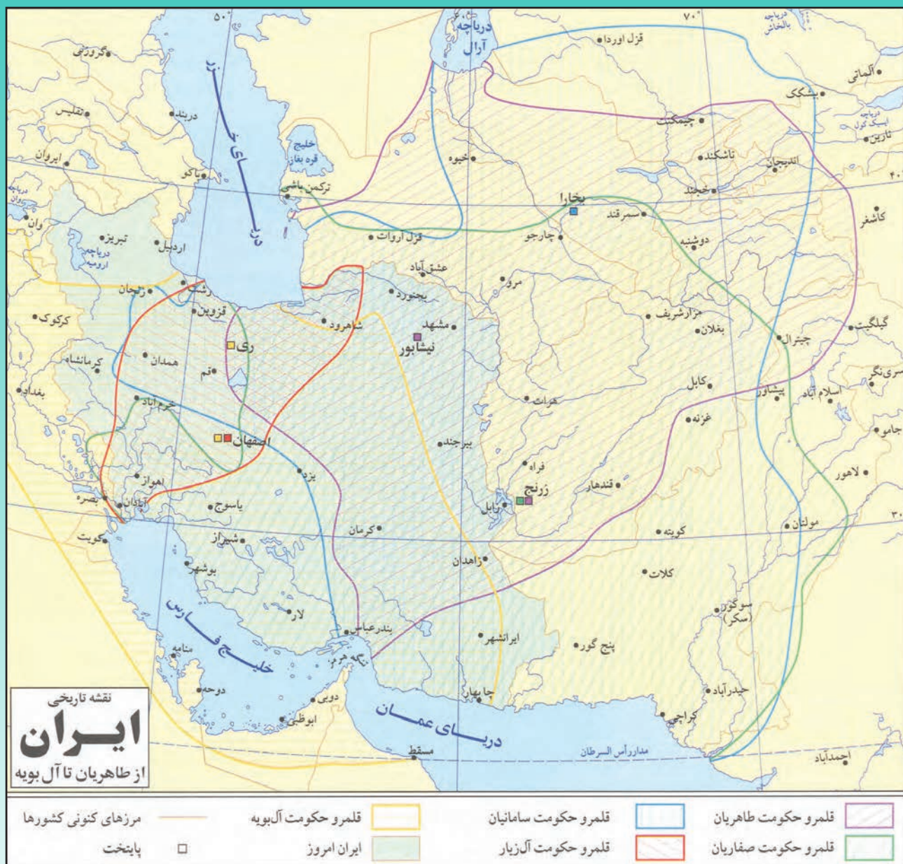
▲ نقشه دوره طاهریان تا آل بویه