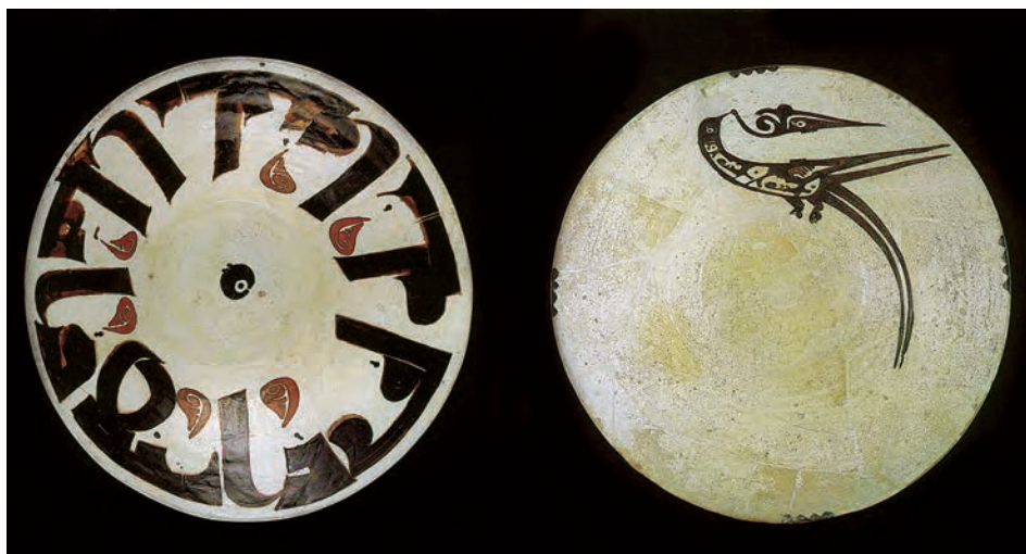
▲ شکل ۸-۷- ظرف سفالی، نیشابور، سده سوم و چهارم هجری

خط کوفی به‌دست توانای یک هنرمند ایرانی به‌صورت خطی زیبا، با ارزش تزئینی بسیار بالا درآمد. هرچند خواندن آن با اشکالاتی روبه‌رو بود اما باز هم توسط هنرمندان ایرانی اصلاح شد و خطوط دیگر به‌دست محمدبن علی فارسی معروف به ابن مقله پدید آمد. خط کوفی همچنان به‌عنوان خطی تزئینی به مدت ۵ سده در نواحی مختلف به‌شیوه‌های گوناگون به کار می‌رفت. این خط به‌عنوان رایج‌ترین نقش تزئینی روی ظروف فلزی و سفالی، پارچه و یا کتیبه‌ها مورد استفاده قرار گرفت. با سیر تحول خط، از خط کوفی «اقلام سته» پدید آمد که به خطوط شش‌گانه، محقق، ریحان، ثلث، نسخ، رقاع و توقیع، شهرت یافته‌اند (شکل ۸-۸).