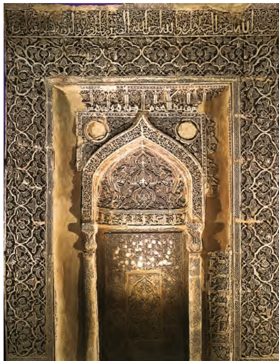
▲ شکل ۴-۸- محراب، مسجد جامع نایین، سده سوم و چهارم هجری ▲ شکل ۵-۸- آرامگاه امیر اسماعیل سامانی، بخارا

از سده دوم هجری به بعد شاهد تکمیل فنون و سبک‌های متعدد در تولید انبوه سفالینه‌ها هستیم که چشم‌انداز هنر ایرانی در آنها به‌خوبی دیده می‌شود. سفالگری بیانگر کهن‌ترین و فراگیرترین هنر ایرانی در همه اعصار بوده و شاید بهترین سند و مدرک زندگی هنری ایران دوران اسلامی باشد. این آثار پیوند بسیار نزدیکی با زندگی مردم داشته و در تمام زمینه‌ها علاوه بر کاربرد، زیبایی نیز دارد. همچنین در مقایسه چنین برمی‌آید که پیشرفت سفالگری دوره اولیه اسلامی بیشتر از فن سفالگری در دوره ساسانی است. در این سیر تحول، لعاب‌های سبز و قهوه‌ای دوره ساسانی تداوم می‌یابد اما به دلیل اهمیت بیشتر سفالگری و جایگزینی آن نسبت به فن فلزکاری، در این زمان شیوه‌های تزئین یافته‌تر و ظریف‌تری در سفال‌ها پدید می‌آید. این توجه و اهمیت به سفالگری در دوره اسلامی