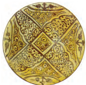
▲ شکل ۸-۶- ظرف زرین فام، با طرح و نقش گیاهی