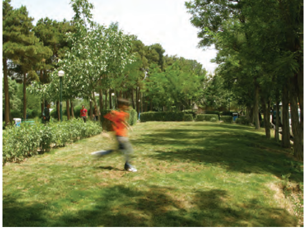
تصویر ۱۱-۵- حرکت موازی با دوربین