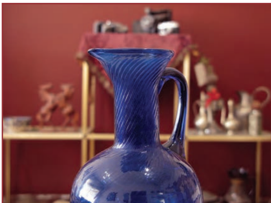
تصویر ۲-۵- عکسی که با f.16 گرفته شده است.