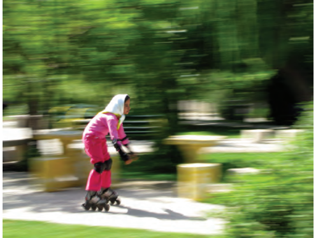
تصویر ۱۷-۵- روش پانینگ