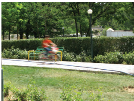
سرعت \frac{1}{4} ثانیه