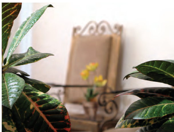
تصویر ۳-۵- فاصله از اولین موضوع 5^\circ سانتی متر

برای استفاده از این خاصیت بعضی از اوقات به جای اینکه تنظیم فاصله را روی نقطه دورتری انجام بدهیم، فاصله خودمان را تا موضوع بیشتر می کنیم.