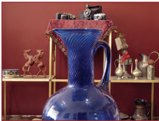
تصویر ۱-۵- عکسی که با f.2.8 گرفته شده است.

مثلاً اگر با یک دیافراگم ثابت مثل f.8 یک بار روی موضوعی در 5^\circ سانتی متری دوربین واضح سازی کنیم و بار دیگر روی فاصله 15^\circ سانتی متری، خواهیم دید که عمق میدان وضوح در عکس دوم بسیار بیشتر از عکس اول است با این که دیافراگم در هر دو عکس یکی بوده است (تصاویر ۳-۵ و ۴-۵).