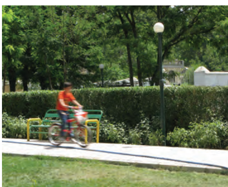
سرعت \frac{1}{8} ثانیه