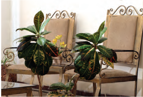
تصویر ۴-۵- فاصله از اولین موضوع 15^\circ سانتی متر