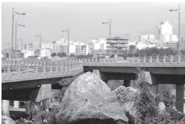
تصویر ۶-۵- لنز نرمال