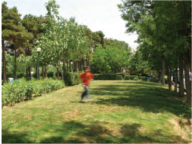
تصویر ۱۲-۵- حرکت مایل نسبت به دوربین