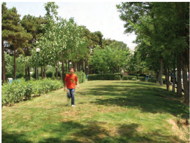
تصویر ۱۳-۵- حرکت عمود بر دوربین