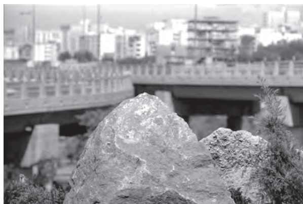
تصویر ۷-۵- لنز تله