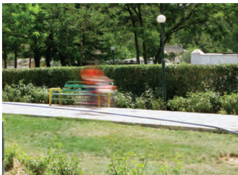
سرعت \frac{1}{3} ثانیه