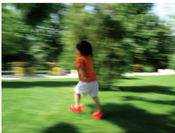
تصویر ۵-۱۵- استفاده از کشیدگی باید کنترل شده باشد

مثلاً در عکاسی از مسابقات ورزشی گاهی اوقات اندکی کشیدگی هیجان محیط را بهتر منتقل می‌کند. مشروط بر آنکه حد درستی انتخاب شده باشد. کشیدگی بیش از حد تصویر نه تنها زیبا نیست بلکه باعث عدم شناسایی مکان و موضوع خواهد شد. (تصویر ۵-۱۶)