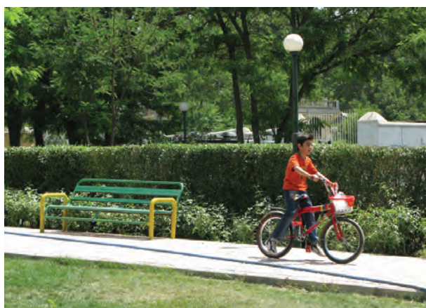
سرعت \frac{1}{125} ثانیه

تصویر ۹-۵- تأثیر سرعت‌های مختلف بر موضوعات متحرک