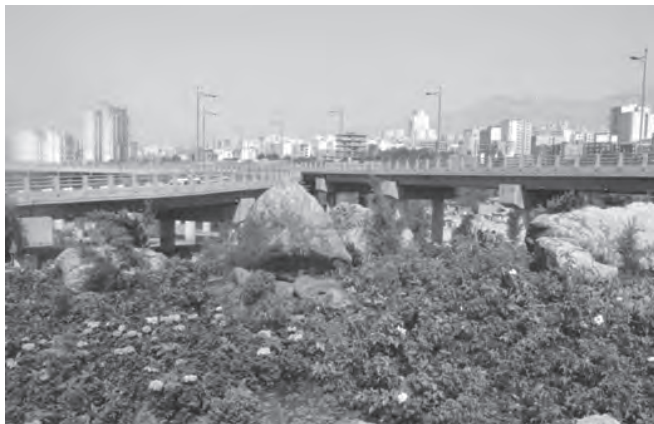
تصویر ۵-۵- لنز واید

سومین عاملی که در افزایش یا کاهش عمق میدان مؤثر است، فاصله کانونی لنزها است به این معنی که هر چه فاصله کانونی لنز کمتر باشد، عمق میدان وضوح بیشتر و هر چه فاصله کانونی بیشتر باشد عمق میدان وضوح کمتر خواهد شد، به عبارت ساده‌تر لنزهای واید دارای عمق میدان بیشتری نسبت به لنزهای تله هستند. (تصاویر ۵-۵ تا ۵-۷)