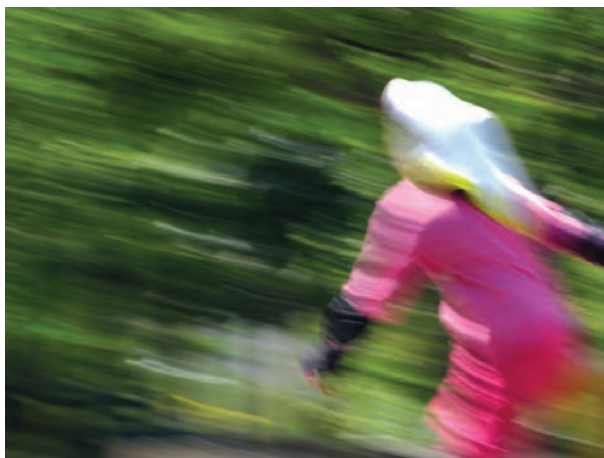
تصویر ۱۰-۵- کشیدگی تصویر

وقتی از اشیاء و اجسام متحرک که سرعت زیادی دارند عکس می‌گیریم باید متناسب با سرعت آنها، سرعت مسدودکننده را نیز بالا ببریم. مثلاً اگر قرار است از یک مسابقه اسب دوانی عکس بگیریم باید بدانیم که سرعت دوربین ما باید بالا و در حدود \frac{1}{1000} ثانیه باشد تا بتوانیم آنها را ثابت و دقیق نشان دهیم، به این کار منجمد کردن تصویر می‌گویند.