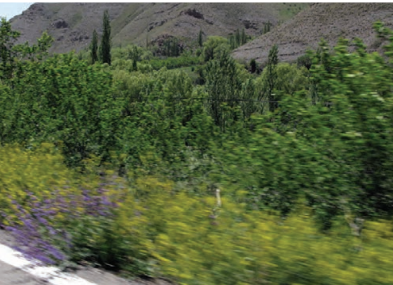
تصویر ۱۴-۵- موضوعات نزدیک کشیده شده‌اند اما موضوعات دور دست کاملاً واضح هستند.

گاهی اوقات ممکن است دوربین در حال حرکت و موضوع ساکن باشد. مثلاً تصور کنید که درون یک اتومبیل نشسته اید و از پنجره اتومبیل در حال عکسبرداری هستید، در این حالت هم کلیه قوانین ذکر شده در حالت اول صادق هستند و چه بسا شدیدتر. سعی کنید در چنین مواردی تا آن‌جا که ممکن است از لنزهای واید استفاده کنید و موضوعاتی را انتخاب کنید که فاصله بیشتری با شما دارند. (تصویر ۱۴-۵)