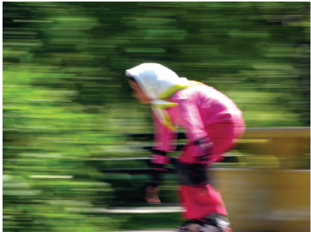
تصویر ۱۸-۵- اغراق در سرعت موضوع با انتخاب سرعت‌های پایین‌تر دوربین