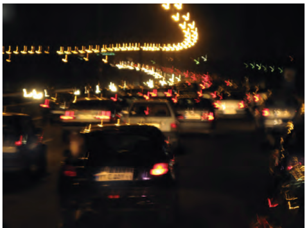
تصویر ۱۹-۵- تأثیر لرزش دست بر تصویر