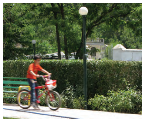
سرعت \frac{1}{15} ثانیه