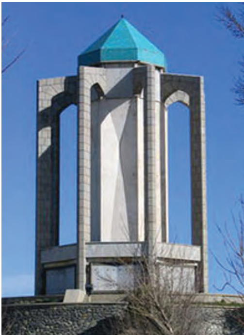
▲ شکل ۶-۱۴- آرامگاه باباطاهر، همدان، محسن فروغی

هنر اروپایی و شیوه‌های نوین آموزش هنر غلبه کرده و حاصل آن به وجود آمدن هنرکده هنرهای زیبا شد ۱ .