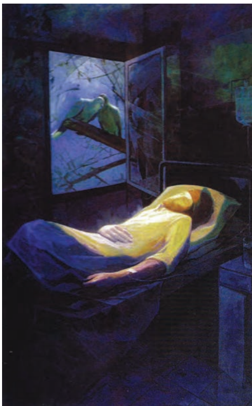
▲ شکل ۱۲-۱۴-ب - نقاشی رنگ و روغن، دوره معاصر

در جریان انقلاب فرهنگی و بازگشایی مجدد مراکز هنری در سطوح مختلف همچنان زمینه برای گرایش‌ات آزاد فراهم شد. با گذشت زمان در برگزاری نمایشگاه‌ها و جشنواره‌ها تحولاتی خاص در عرصه هنر پدید آمد.