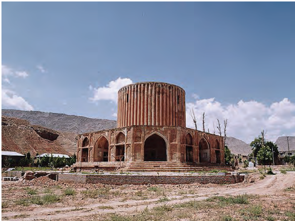
▲ شکل ۲-۱۳-کلات نادری، دوره افشاریه، خراسان