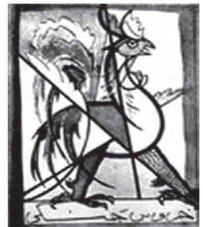
▲ شکل ۷-۱۴- نشانه انجمن خروس جنگی

تحول سنت‌گرایی در این دوره و نوعی توجه به ارزش‌های سنتی ایرانی باعث شد تا زمینه‌های فعالیت بیشتری در عرصه‌های هنری ایجاد شود. این تمایل باعث ایجاد نوعی فعالیت