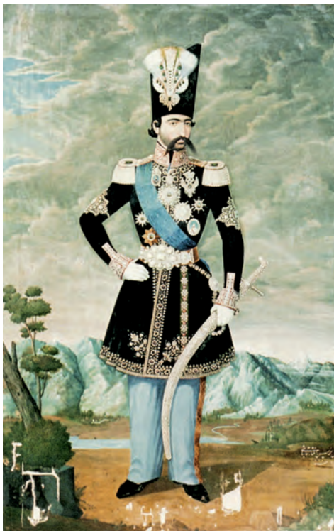
▲ شکل ۸-۱۳- چهره ناصرالدین شاه

پس از تأسیس مدرسه دارالفنون و دارالصنایع به‌عنوان اولین مرکز دولتی آموزش هنر نوعی گرایش کامل به هنر اروپایی به‌وجود می‌آید و تمایل به هنر اشرافی و درباری به اینگونه آثار روزه‌روز بیشتر می‌شود. تمایلات هنر اروپایی بیشتر در منظره‌سازی و صورت‌سازی و دور شدن از نگارگری ایران دیده می‌شود (شکل ۸-۱۳). تحولات معماری در این دوره نیز مانند نقاشی با تلفیق عناصر سنتی و شکل‌های معماری اروپایی می‌باشد (شکل ۹-۱۳).