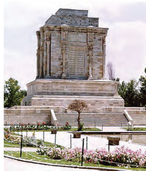
الف - آرامگاه فردوسی، توس، مشهد، لرزاده