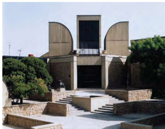
▲ شکل ۹-۱۴-د - موزه هنرهای معاصر، تهران، کامران دیبا