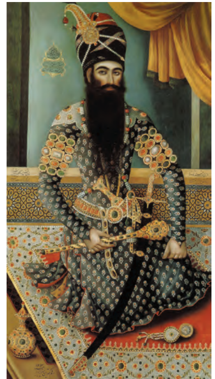
▲ شکل ۶-۱۳- شمایل‌نگاری (بیکرنگاری)