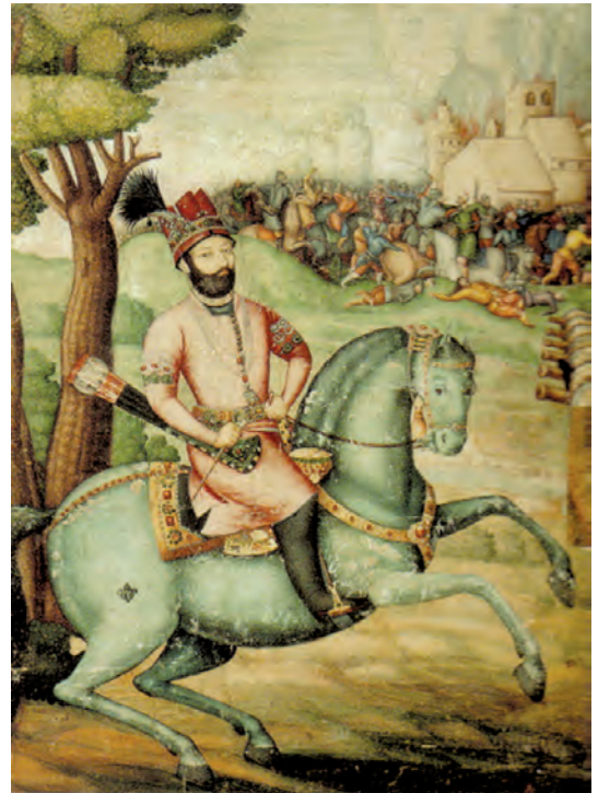
▲ شکل ۱-۱۳-الف - نادرشاه افشار، اثر علی بن عبدالبیگ علی قلی جبه دار