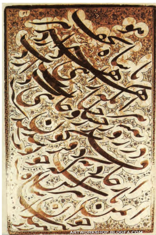
▲ شکل ۱۰-۱۳- سیاه مشق به خط نستعلیق

ارتباط روزافزون با غرب و حضور اندیشمندان ایرانی در این دوره که با فرهنگ اروپایی آشنا شده بودند باعث شد که زمینه مناسبی برای شکل‌گیری و کاربرد رسانه‌های جدیدی از جمله ایجاد روزنامه و مطبوعات، عکاسی و حتی سینما را به وجود آورد. هر چند تمایل به استفاده از عکاسی که بسیار سریع گسترش یافت، خود باعث ایجاد رکودی در نقاشی شد. این روند سریع سبب شد تا بسیاری از زمینه‌های فرهنگی و اجتماعی تحول بیشتری به سمت تجدد و نوگرایی بیابد (شکل ۱۳-۱۳ الف و ب).