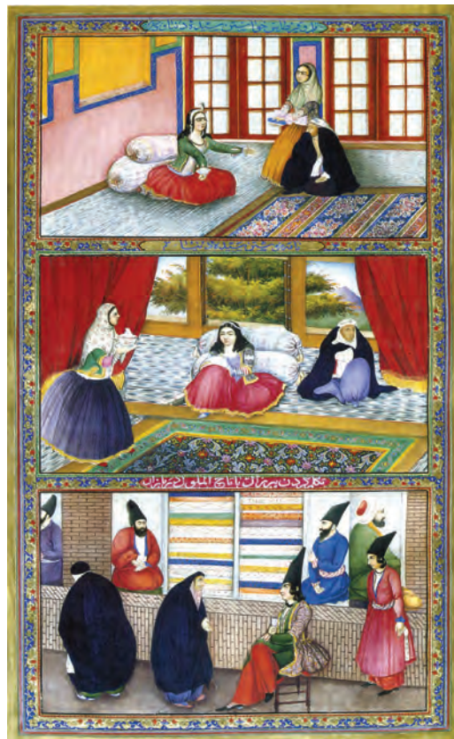
شکل ۱۲-۱۳- الف- برگي از کتاب هزار و یک شب،