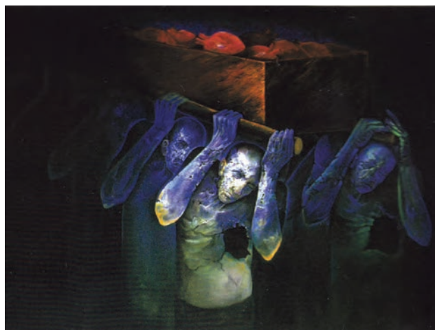
▲ شکل ۱۲-۱۴-د - رنگ اکریک روی بوم، دوره معاصر