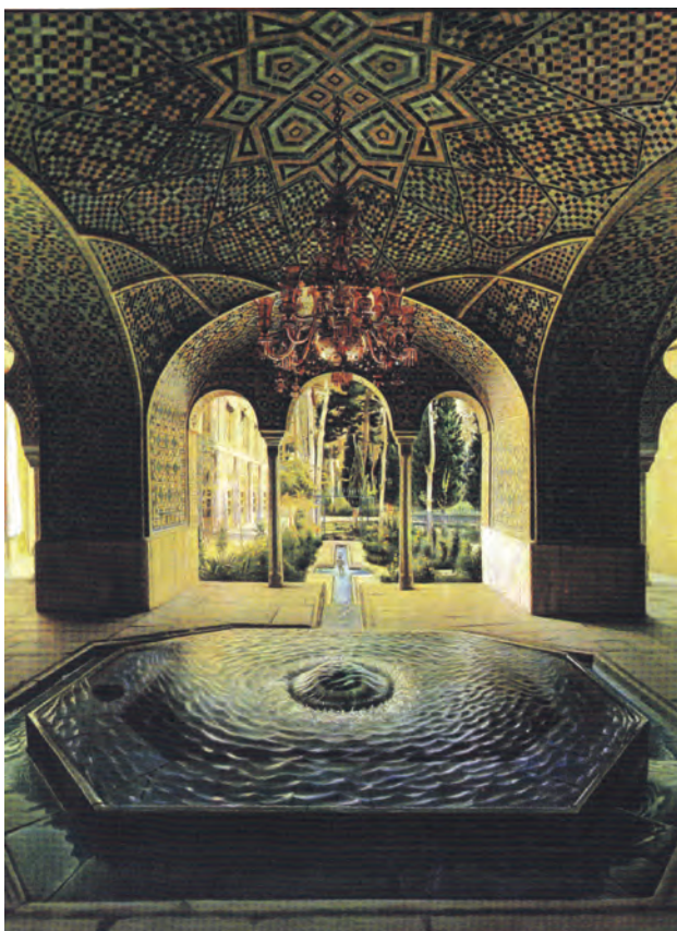
شکل ۱۶-۱۳- حوض‌خانه (کاخ گلستان)، کمال الملک (محمد غفاری)، رنگ و روغن روی بوم ◀