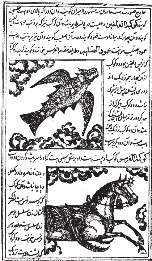
شکل ۱۱-۱۳- چاپ سنگی، کتاب عجایب المخلوقات