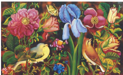
▲ شکل ۱۳-۱۴- نقاشی پشت شیشه، دوره قاجاریه