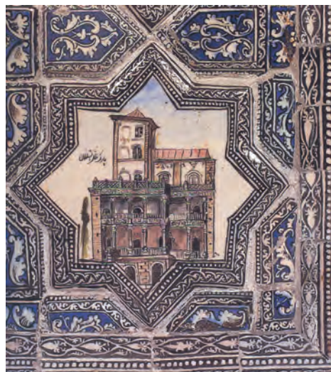
▲ شکل ۷-۱۳- کاشی‌کاری قاجاری