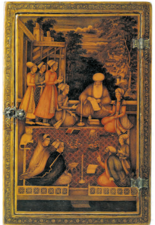
▶ شکل ۵-۱۳- قاب آینه، نقاشی لاک‌ی روغنی