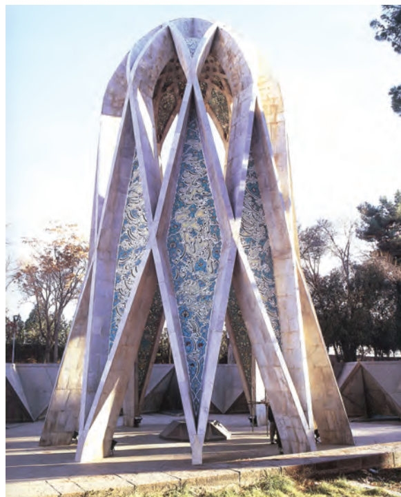
▲ شکل ۹-۱۴-الف - آرامگاه خیام، نیشابور، هوشنگ سیحون