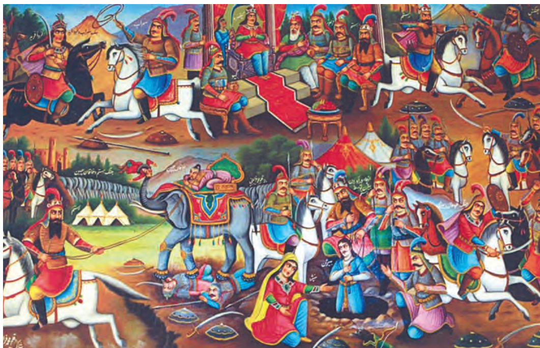
▲ شکل ۱۵-۱۳- نقاشی قهوه‌خانه‌ای، استاد محمد فراهانی

که با تأسیس مدرسه صنایع مستظرفه به همت کمال الملک شکل گرفت. این هنر، نوعی نقاشی ایرانی با گرایشات هنر غربی و شاعرانه همراه با چشم‌اندازهایی از مکان‌هایی واقعی است که بیان‌کننده هنر رسمی است (شکل ۱۶-۱۳).