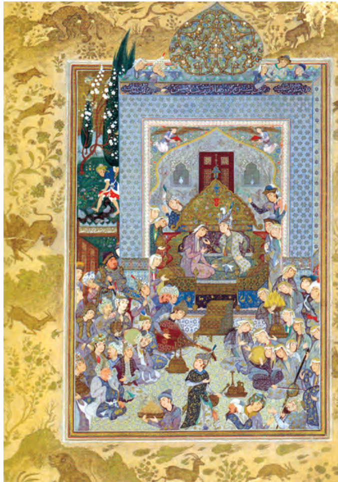
▲ شکل ۵-۱۴- گنبد ارغوانی، محمدهادی تجویدی، نگارگری