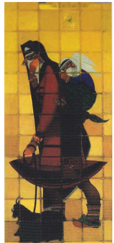
▲ شکل ۸-۱۴- زن قوچانی، جلیل ضیاءپور، رنگ و روغن روی بوم