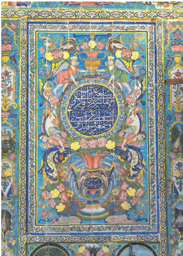
شکل ۱۲-۱۳- ب- کاشی کاری هفت رنگ، دوره قاجاریه