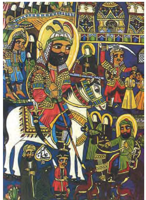
▲ شکل ۱۱-۱۴ - نقاشی عامیانه

دوره چهارم نوعی رویکرد هنری از سال ۱۳۶۰ به بعد است. تداوم هنر سنت‌گرایی دوره سوم است که با تحولاتی در جریان شکل‌گیری انقلاب اسلامی و دفاع مقدس با گرایشات مذهبی ادامه می‌یابد. حاصل این تحول به شکلی است که ارزش‌های انقلابی به‌گونه‌ای با ابزار هنری در جریان تحولات اخیر به هویتی کاملاً مشخص تبدیل می‌شود. نوعی انقلاب فرهنگی در عرصه‌های متفاوت ایجاد می‌شود که نتیجه آن را به‌عنوان هنر انقلابی، هنر جنگ، هنر دفاع مقدس و ... می‌دانیم (شکل ۱۲-۱۴).