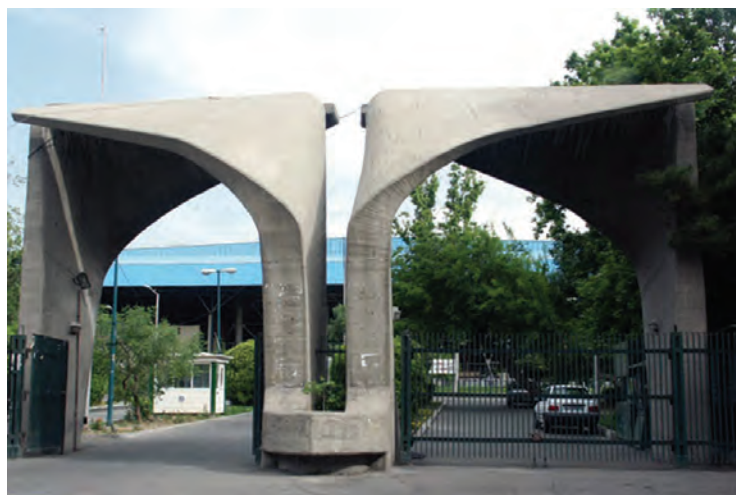
▲ شکل ۲-۱۴- سر در دانشگاه تهران

در این دوره تحولات علمی نیز با رویکرد جدید و تأسیس دانشگاه در ایران صورت می‌پذیرد (شکل ۲-۱۴) و سعی می‌شود تا جلوه‌هایی تازه در معرفی بزرگان ادب فارسی پدید آید و آرامگاه‌های باشکوهی از فردوسی، سعدی و حافظ ساخته شود (شکل ۳-۱۴ الف و ب و ج). در زمینه نقاشی و نگارگری نیز تحول بنیادینی شکل می‌گیرد و مدرسه صنایع مستظرفه به دو بخش هنرستان کمال‌الملک