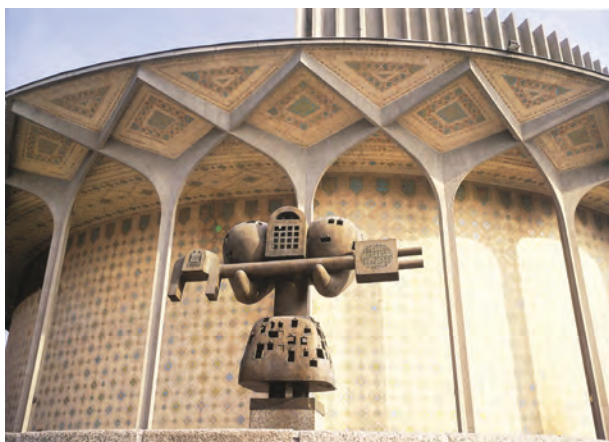
▲ شکل ۹-۱۴-د - تئاتر شهر، تهران، علی سردار افخمی