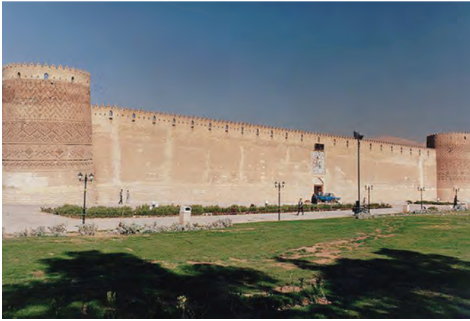
▲ شکل ۳-۱۳- ارگ کریمخان، شیراز

بنابراین زندیه با حفظ میراث هنری دوره صفویه با وجود اندک زمان حضور این سلسله توانست ویژگی‌های منحصر به فرد و خاصی را در هنر پدید آورد که در زمینه نقاشی، معماری و دیگر هنرها، شاخص باشد (شکل ۳-۱۳).