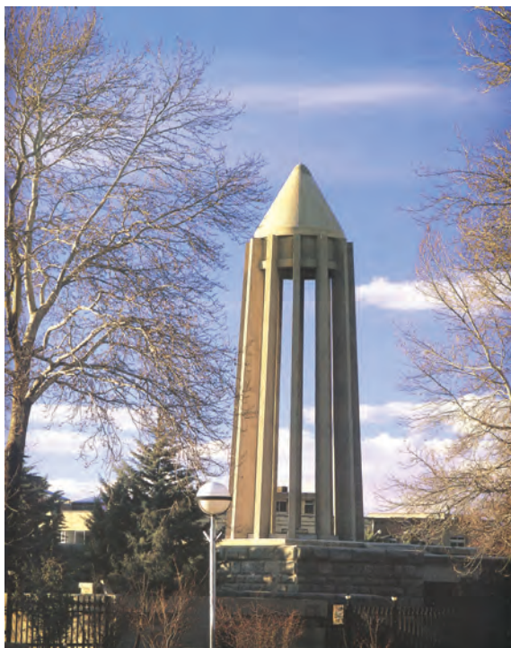
▲ شکل ۹-۱۴-ب - آرامگاه بوعلی سینا، همدان، هوشنگ سیحون