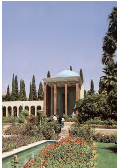
ب - سعدیه، شیراز، آندره گدار