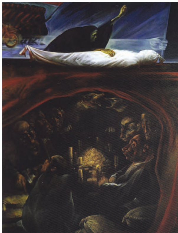
▲ شکل ۱۲-۱۴-الف - نقاشی رنگ و روغن، دوره معاصر