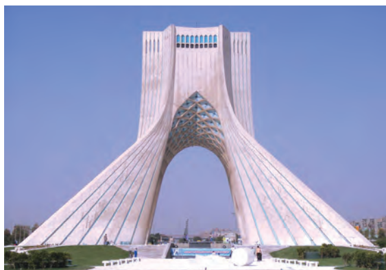
▲ شکل ۹-۱۴-ج - برج آزادی، تهران، حسین امانت