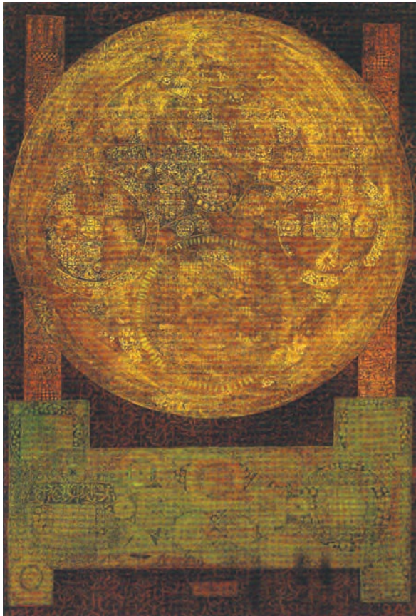
▲ شکل ۱۰-۱۴-ب - نقاشی، فرامرز پیل آرام، مواد ترکیبی