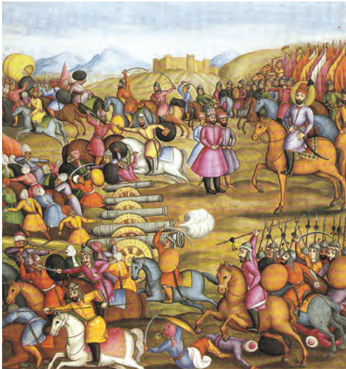
▲ شکل ۱-۱۳-ب - تصویری از کتاب تاریخ جهانگشای نادری (جنگ نادر با اشرف افغان)، ۱۱۷۱ هـ