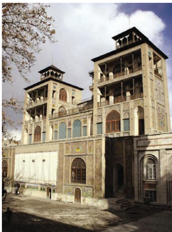
▲ شکل ۹-۱۳- شمس‌العماره، عمارت قاجاری، تهران

خوشنویسی این دوره که بیشتر به شیوه نستعلیق می‌باشد به دلیل کاربردهای جدید هنری به شکل سیاه مشق (شکل ۱۰-۱۳) و یا نوعی نگارش مناسب برای چاپ سنگی ۱ است (شکل ۱۱-۱۳).