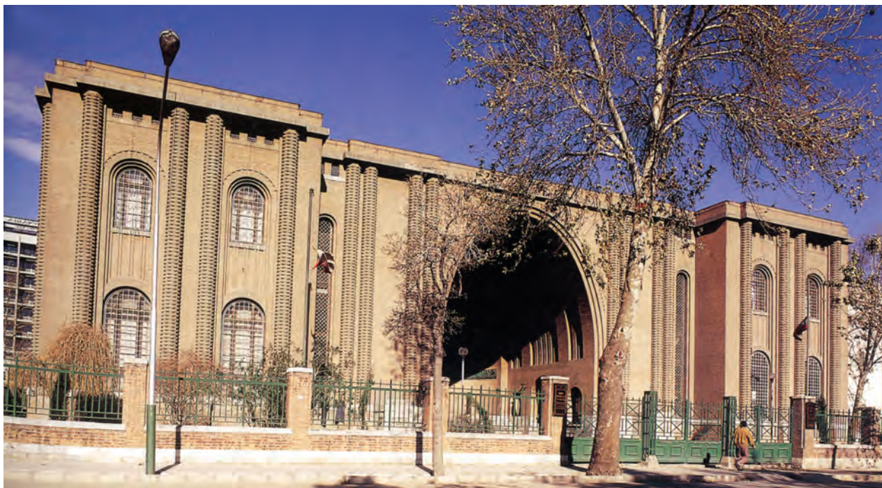
▲ شکل ۱-۱۴- سر در موزه ملی ایران، تهران، آندره گدار

بودند اما به لحاظ رویکرد باستان‌شناسی سعی داشتند تا طرح‌های معماری خود را به شیوه باستانی بسازند (شکل ۱-۱۴).