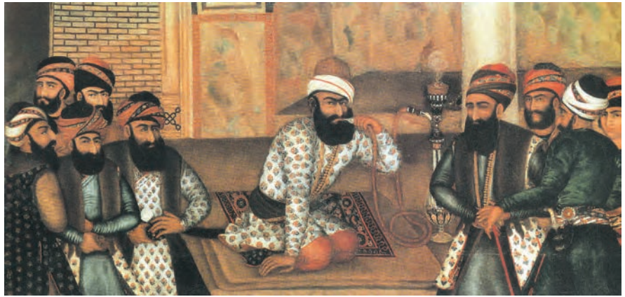
▶ شکل ۴-۱۳- نقاشی رنگ و روغن از چهره کریمخان زند

نقاشی‌های دوره زندیه که به «مکتب گل» شهرت یافته در بردارنده جنبه‌های مختلف با موضوعات متنوع و همچنین در بردارنده نقاشی‌های رنگ و روغنی با ابعاد بزرگ، نقاشی‌های لاک‌ی و روغنی و گل و مرغ می‌باشد (شکل ۴-۱۳). تحول اساسی در این دوره را بیشتر می‌توان در شیوه‌های جدید هنری به ویژه نقاشی بر اشیاء مختلف از جمله قاب آینه، صندوقچه‌های جواهر و ... دید (شکل ۵-۱۳).