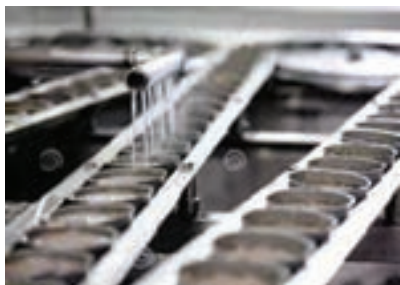
شکل ۳- پرکن ریزشی

– پرکن ریزشی: در این دستگاه برای پرکردن بخش مایع، قوطی‌ها بر روی نوار نقاله قرار گرفته و از زیر دوش شربت یا آب‌نمک عبور می‌کنند. بخش مایع اضافی که سرریز شده زیر دستگاه جمع‌آوری و مجدداً مورد استفاده قرار می‌گیرد.