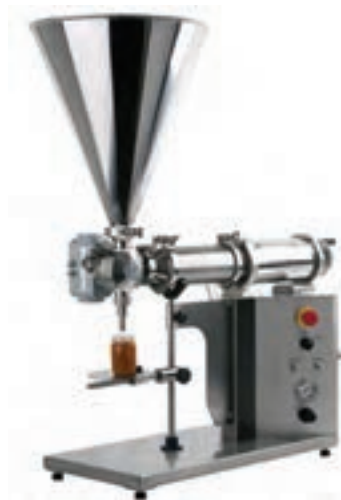
شکل ۲- پرکن نازلی

- پرکن نازلی: در این پرکن‌ها ظرف مورد نظر، زیر محل نازل پرکن قرار گرفته و با باز شدن دریچه و جاری شدن مایع برای مدت زمان معینی، ظرف پر می‌شود. مدت زمان باز بودن دریچه تعیین‌کننده، مقدار ماده غذایی وارد شده به ظرف بسته‌بندی است.