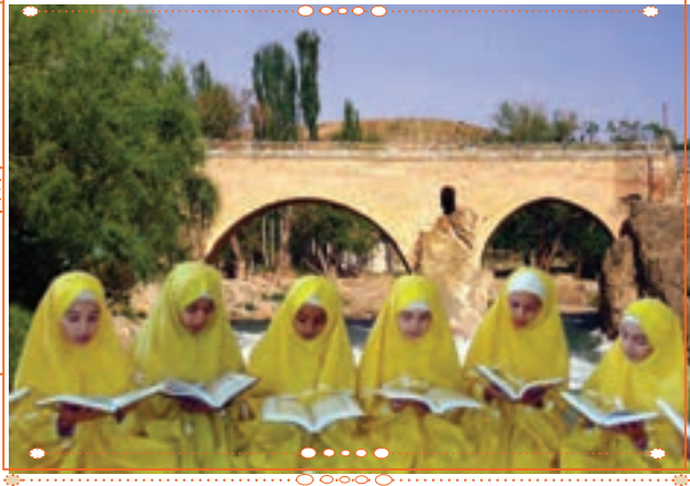
انسان با قرآن کریم در استان چهارمحال و بختیاری