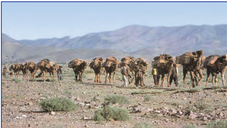
کاروان‌های تجاری در گذشته

انقلاب دریانوردی ایرانیان و مسلمانان در قرون ۱۲-۱۳ میلادی و سپس اروپاییان در قرن ۱۵، و پیدایش صنعت بخار، حمل و نقل ریلی و هوانوردی و به دنبال آن، پیشرفت دانش فنی بشر، وجود امنیت نسبی در سرزمین‌ها، راه‌های مناسب و مقررات مورد قبول بین‌المللی، موجب شد هزینه‌های تجارت نه تنها در داخل مرزها بلکه در خارج از آن نیز کاهش یابد.