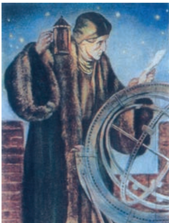
کوپرنیک در حال رصد ستارگان