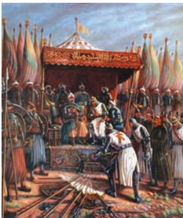
تابلوی فرمانده شکست خورده صلیبیون در برابر صلاح الدین

و پیشروی آنان در آسیای صغیر، موجب شد که امپراتور روم شرقی از پاپ، علیه مسلمانان درخواست کمک نماید. در پی این تقاضا، پاپ اوربان دوم مسیحیان را به حمله به سرزمین‌های اسلامی و جنگ با مسلمانان فراخواند.