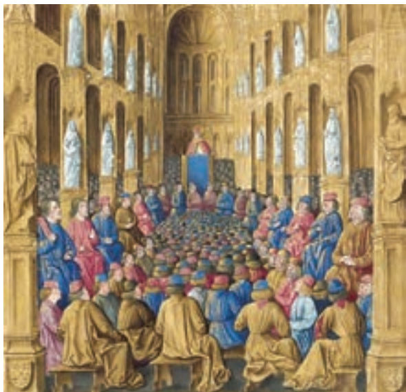
پاپ اوربان دوم هنگام موعظه و تشویق مسیحیان برای شرکت در جنگ‌های صلیبی - اثر جین کلمبو نقاش فرانسوی قرن ۱۵م

۱- مشکلات اقتصادی و اجتماعی سرزمین‌های اروپایی: به دنبال هجوم و مهاجرت گسترده طوایف ژرمنی به سرزمین‌های