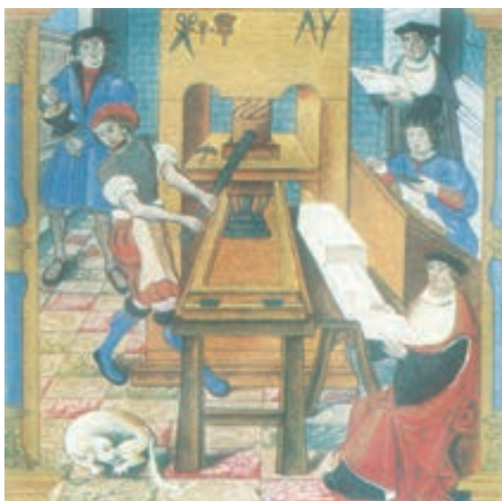
کارگاه چاپ اواخر قرن ۱۵م

در اواسط قرن شانزدهم نیکلاس کوپرنیک ۱ در رسالهٔ گردش اجرام سماوی، نظریهٔ چرخش زمین به دور خورشید را مطرح کرد. پیش از این، براساس نظریهٔ زمین مرکزی ۲ بطلمیوس، کلیسا و دانشمندان بر این باور بودند که زمین ثابت و خورشید بر گرد آن می‌چرخد. با مطالعات برخی از دانشمندان از جمله کیپلر ۳ نظریهٔ کوپرنیک اثبات شد. اختراع تلسکوپ توسط گالیله ۴ ، استاد دانشگاه پیزا، فرضیه‌های کوپرنیک را بیش از پیش مورد تأیید قرار داد. با گسترش روابط اروپاییان با جهان اسلام از دورهٔ جنگ‌های صلیبی به بعد، پزشکی و داروسازی در اروپا نیز دچار تحول شد. ویلیام هاروی ۵ در زمینهٔ کارکرد قلب و چگونگی گردش خون به موفقیت‌های مهمی دست یافت. در فیزیک و ریاضیات نیز پیشرفت‌هایی صورت گرفت و در قرن ۱۷م با وسعت بیشتری ادامه یافت. در زمینهٔ جغرافیا و نقشه‌برداری نیز اروپاییان از تجربیات مسلمانان بهره‌های فراوانی بردند و به پیشرفت‌های چشمگیری نایل آمدند.