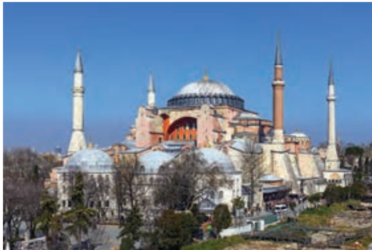
کلیسای ایاصوفیه، شاهکار معماری دوران بیزانس - استانبول

در قرن ۴م، امپراتوری روم بر اثر مشکلات اداری و اقتصادی به دو بخش شرقی و غربی تقسیم شد. امپراتوری روم شرقی یا بیزانس که از اقتصاد و ارتش و به خصوص نیروی دریایی نسبتاً نیرومندی برخوردار بود، در برابر حملات پیاپی سپاهیان مسلمان، با وجود از دست دادن سرزمین‌های آفریقایی و بخش وسیعی از قلمرو آسیایی خود، همچنان دوام آورد. قسطنطنیه، پایتخت امپراتوری بیزانس، به سبب برخورداری از موقعیت جغرافیایی و ارتباطی ویژه و داشتن باروهای دفاعی مستحکم، پایگاه مهمی برای تسلط آن امپراتوری بر ولایات تابع و حفاظت از راه‌های مهم تجاری به شمار می‌رفت. امپراتوری روم شرقی، سرانجام با فتح قسطنطنیه (۱۴۵۳م/۸۵۷ق) توسط ترکان مسلمان عثمانی متلاشی شد.