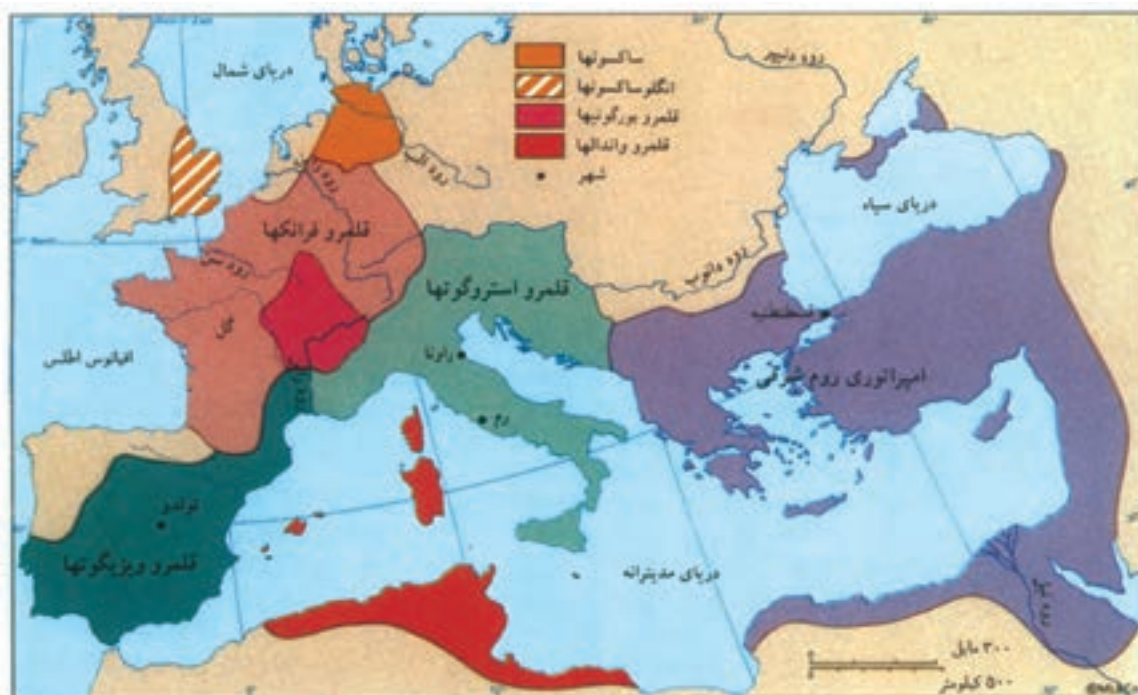
نقشهٔ سیاسی اروپا در سال ۵۲۶ م