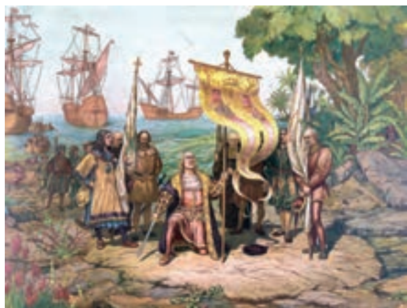
کریستف کلمب در هنگام ورود به دنیای جدید

۲- افزایش اطلاعات جغرافیایی و توسعه مهارت دریانوردی اروپاییان در دوران پس از جنگ‌های صلیبی و اواخر قرون وسطا نیز تأثیر شایانی در کشف سرزمین‌ها و راه‌های جدید داشت. اروپاییان تا نیمه سده ۱۵م فنون نقشه‌کشی را تکامل بخشیدند و نقشه‌های نسبتاً دقیقی از دنیای شناخته شده آن روزگار طراحی و ترسیم کردند. به علاوه اروپاییان در ساختن کشتی و بهره‌گیری از تجهیزات دریانوردی مانند قطب‌نما که چینی‌ها اختراع کرده بودند و اُسْطُرْلاب (وسيله‌ای که موقعیت اجرام آسمانی را معلوم می‌کرد)، به پیشرفت فوق‌العاده‌ای رسیدند.