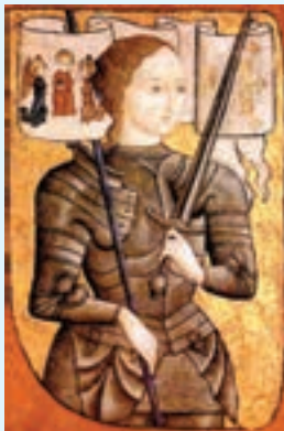
تابلوی ژاندارک قهرمان ملی فرانسه

جنگ‌های صدساله به اعتبار و اهمیت شوالیه‌ها در اروپا آسیب جدی وارد آورد؛ زیرا در طول این جنگ‌ها، روش‌های جنگ تغییر کرد. سواره‌نظام سنگین اسلحه یا شهبوران اهمیت خود را در جنگ‌ها از دست دادند و پیاده‌نظام مجهز به تفنگ و برخوردار از پشتیبانی توپخانه به نیروی کارآمد میدان نبرد تبدیل شد. استفاده از باروت که از چین به اروپا وارد شده بود، نقش زیادی در ساخت سلاح‌های آتشین (تفنگ و توپ) توسط اروپاییان داشت.