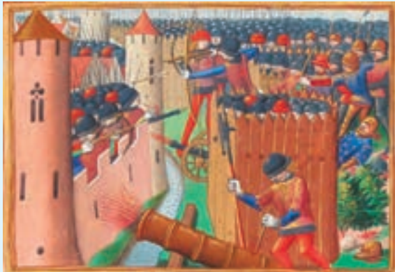
تابلوی جنگ‌های صدساله - محاصره اورلئان