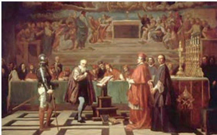
تابلوی گالیله در دادگاه تفتیش عقاید؛ او برای حفظ جان خود ناچار شد از عقاید علمی خود عقب‌نشینی نماید.

کلیسا در قرون وسطا برای مقابله با بی‌دینی و بدعت‌گذاری ۱ و جلوگیری از اندیشه‌های مخالفان خود، از حربۀ تفتیش عقاید یا انکیزیسیون ۲ استفاده می‌کرد. متهمان به بی‌دینی و بدعت‌گذاری از کلیسا اخراج و به سختی مجازات می‌شدند. تبعید، مصادرة دارایی، به چوب بستن و سوزاندن از جمله مجازات‌های این گونه متهمان بود.