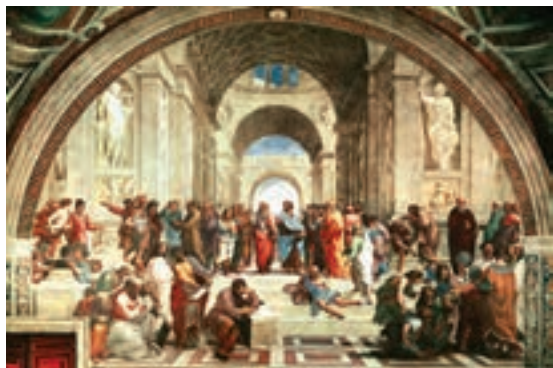
تابلوی مدرسه آتن اثر رافائل

هنر رنسانس با ظهور سه هنرمند مشهور ایتالیایی یعنی لئوناردو داوینچی ۱ ، رافائل ۲ و میکل آنژ ۳ به اوج پیشرفت و شکوفایی رسید. آنان در زمره بزرگ‌ترین نوابغ تاریخ هنر جهان به شمار می‌روند. داوینچی دارای هوش و نبوغ سرشاری بود. او علاوه بر آنکه در نقاشی، مجسمه‌سازی و معماری سرآمد هنرمندان به شمار می‌رفت، در علوم مختلف از قبیل ریاضی، مهندسی و زمین‌شناسی نیز سررشته داشت. مشهورترین اثر نقاشی او شام آخر و مونالیزا ۴ یا لبخند ژکونده ۵ است.