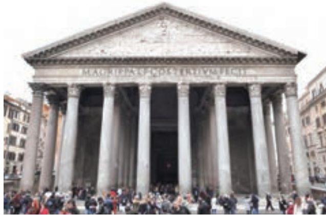
معبد پانتئون رم - از بناهای دوران روم باستان

سرزمین ایتالیا قلب امپراتوری روم باستان به شمار می‌رفت و آثار و بناهای عظیم تمدن یونانی- رومی در گوشه و کنار این سرزمین به چشم می‌خورد. وجود این آثار در پایان قرون وسطا برای بسیاری از شهرنشینان مرفه ایتالیایی، یادآور روزگار عظمت و شکوه فرهنگی، اقتصادی و سیاسی گذشته آنان بود. در این دوره تعدادی از نویسندگان و اندیشمندان ظهور کردند که با اشتیاق فراوان به مطالعه و پژوهش درباره فرهنگ یونان و روم باستان پرداختند و در صدد احیای آن برآمدند.