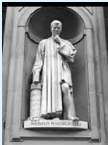
تندیس نیکولو ماکیاولی