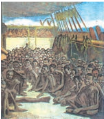
تابلوی کشتی حمل برده؛ بعضی از کشتی‌های حمل برده تا ۸۰۰ نفر را در خود جای می‌دادند. حدود ۱۵ تا ۲۰ درصد این بردگان در طول سفر می‌مردند.

تجارت بردگان آفریقایی؛ پرتغالی‌ها در جریان سفرهای اکتشافی خود در سواحل غربی قاره آفریقا دریافتند که با فروش برده‌های آفریقایی می‌توانند سود هنگفتی کسب کنند. با کشف قاره آمریکا، خرید و فروش برده به سرعت افزایش یافت؛ زیرا اروپاییانی که مزارع وسیعی را در آن قاره تصاحب کرده بودند به نیروی کار مجانی و ارزان نیاز داشتند. به همین دلیل پرتغالی‌ها تجارت برده از آفریقا به آمریکا را در انحصار خود گرفتند. بعدها بازرگانان هلندی و انگلیسی نیز به این تجارت پرسود وارد شدند.