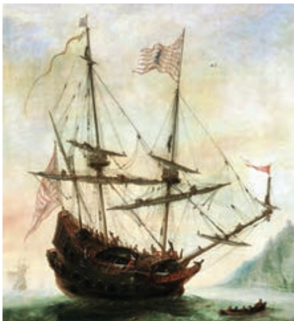
نمونه‌ای از کشتی‌های اروپایی در سده ۱۵ و ۱۶م