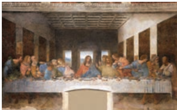
تابلوی شام آخر اثر داوینچی

عصر نوزایی، در معماری نیز شیوه نوینی به وجود آورد. معماران عصر رنسانس ساختمان‌های رم باستان را سرمشق خود قرار دادند و الگوی معماری بناهای باستانی را در ساختن کاخ‌ها، کلیساها و نمازخانه‌ها به کار بستند. کاخ‌ها و کلیساهایی که در عصر رنسانس در شهرهای مختلف ایتالیا به ویژه رم، فلورانس و ونیز ساخته شد، بیانگر اوج و شکوه معماری عصر رنسانس است.