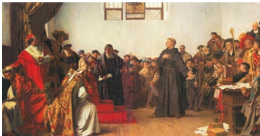
لوتر هنگام دفاع از خود در دادگاه امپراتوری مقدس روم

ویتنبرگ شد. اولین مسئله‌ای که ذهن او را به خود مشغول کرد، ارتباط ایمان با انجام دادن کارهای نیک بود. او در طی مطالعات و تأملات گستردهٔ خود در باب آیین مسیح و کتاب مقدس به این نتیجه رسید که برخلاف دیدگاه غالب کلیسایان، آنچه مایهٔ رستگاری انسان می‌شود ایمان است و نه انجام دادن کارهای نیک. لوتر با ابراز این نظر در واقع به جنگ با کلیسا برخاست. وی بعداً بر پایهٔ همین نظر خود بود که مسئلهٔ آموزش گناهان توسط کلیسا را در برابر پرداخت پول و انجام برخی خدمات مورد نقد قرار داد. او خدا را پدری مهربان می‌شمرد که بی‌هیچ چشمداشتی گناهان بندگانش را می‌بخشد.