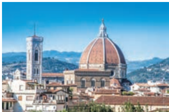
فلورانس ملکه شهرهای اروپا در عصر رنسانس

از سده ۱۱م به تدریج در اروپا شهرنشینی و تجارت در پیوندی تنگاتنگ با یکدیگر دوباره رونق گرفت. جنگ‌های صلیبی تأثیر فراوانی بر رشد شهرها و تجارت به ویژه در مناطق ساحلی اروپا گذاشت. تأثیر این جنگ‌ها بر رونق و شکوفایی شهرها در ایتالیا بیش از سایر سرزمین‌های اروپایی بود. شهرهای ایتالیایی در آن زمان، سرآمد شهرهای اروپا در تجارت، بانکداری و صنعت به شمار می‌رفتند. شهرهای بندری ونیز، جنوا ۲ ، پیزا ۳ و پالمو ۴ تجارت در دریای مدیترانه و سواحل غربی اروپا را در اختیار داشتند. فلورانس ۵ ، مرکز داد و ستد کالاهای قیمتی فلزی و چرمی بود و تجارت پارچه را در بخش وسیعی از اروپا به خود اختصاص داده بود.