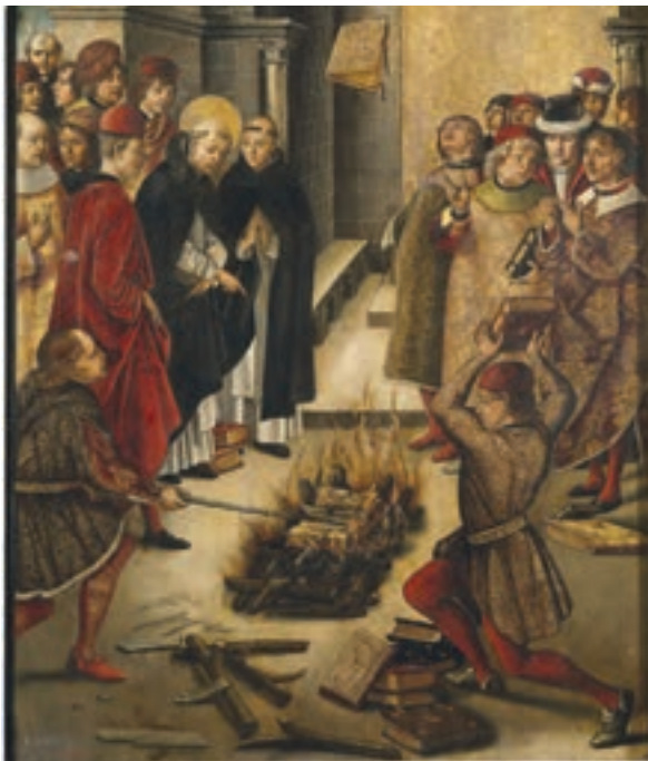
تابلوی قدیس سن دومینیک در حال نظارت بر سوزاندن کتاب‌های بدعت آمیز

فکر و فرهنگ را به دست گرفتند و کلام، فلسفه، اخلاق، ادبیات و هنر را مطابق میل و سلیقه خود تعلیم می‌دادند. آنان تفسیر کتاب مقدس را حق انحصاری خود می‌شمردند و اجازه نمی‌دادند که این کتاب جز به زبان لاتین به زبان‌های دیگری ترجمه و منتشر شود. کلیسا همچنین در قرون وسطا موفقیت زیادی در گسترش مسیحیت در میان ژرمن‌ها و سایر اقوام مهاجم به اروپا کسب کرد. علاوه بر اینها، کلیسا دارای املاک و زمین‌های بسیاری در سرتاسر اروپا و به خصوص ایتالیا بود. رسم بخشش گناهان از جمله رسوم دینی بود که نفوذ و تأثیر گسترده کلیسا را در قرون وسطا نشان می‌دهد. بدین منظور شخص گناهکار در برابر کشیش به گناه خود اعتراف می‌کرد و خواهان بخشش می‌شد. معمولاً بخشش خواهان، برای لغو کیفر گناهان خویش، پولی را پرداخت می‌کردند که برای کارهای خیر و عام‌المنفعه مانند ساخت و تعمیر کلیسا، بیمارستان، سدها و جاده‌ها مصرف می‌شد.