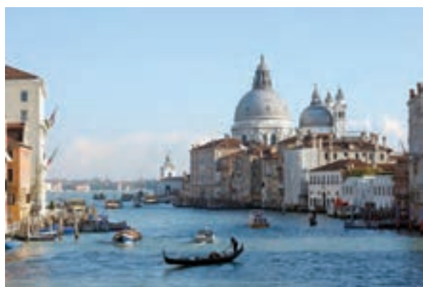
ونیز - ایتالیا

از سده ۱۱م به تدریج در اروپا شهرنشینی و تجارت در پیوندی تنگاتنگ با یکدیگر دوباره رونق گرفت. جنگ‌های صلیبی تأثیر فراوانی بر رشد شهرها و تجارت به ویژه در مناطق ساحلی اروپا گذاشت. تأثیر این جنگ‌ها بر رونق و شکوفایی شهرها در ایتالیا بیش از سایر سرزمین‌های اروپایی بود. شهرهای ایتالیایی در آن زمان، سرآمد شهرهای اروپا در تجارت، بانکداری و صنعت به شمار می‌رفتند. شهرهای بندری ونیز، جنوا ۲ ، پیزا ۳ و پالمو ۴ تجارت در دریای مدیترانه و سواحل غربی اروپا را در اختیار داشتند. فلورانس ۵ ، مرکز داد و ستد کالاهای قیمتی فلزی و چرمی بود و تجارت پارچه را در بخش وسیعی از اروپا به خود اختصاص داده بود.