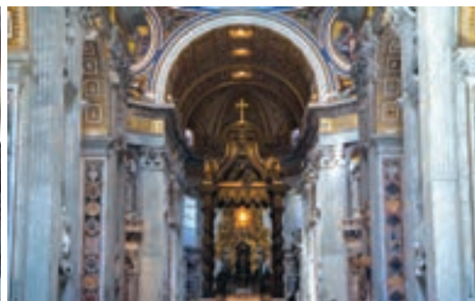
کلیسای سن پیترو در رم

عصر نوزایی، تأثیر ژرفی بر تعلیم و تربیت نهاد. اندیشه انسان‌گرایی برای تعالی و رشد جسمی و روحی انسان اهمیت و ارزش فراوانی قائل بود و انسان‌گرایان بر اصل آموزش‌پذیری انسان و شکوفایی استعدادها و توانمندی‌های بالقوه او از طریق آموزش به شدت تأکید می‌کردند. دانشمندان عصر رنسانس با مطالعه و بررسی آثار و نوشته‌های دوره باستان، رساله‌های متعددی درباره تعلیم