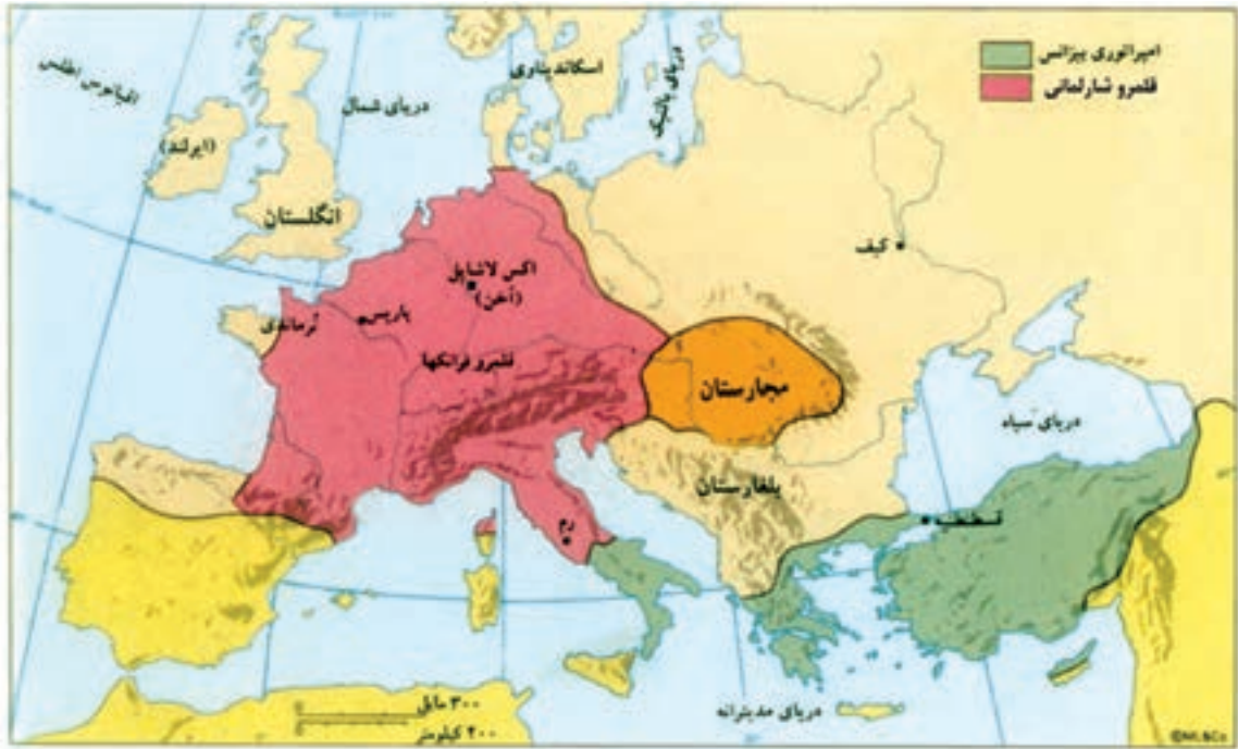
نقشه سیاسی اروپا در قرن ۸ م