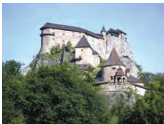
قلعه اوراوا - اسلواکی

خدمات نظامی و غیرنظامی به زیردستان و یا اشراف درجه دوم واگذار کنند. اشراف درجه دوم هم به نوبه خود همین کار را با زیردستان خود کردند و سلسله مراتبی از ارباب یا فئودال و باجگزار یا واسال ۱ به وجود آمد. واسال به ارباب خود سوگند وفاداری یاد می‌کرد و موظف بود که هنگام جنگ او را یاری دهد، از کاخ و کوشک او حفاظت نماید و به او عوارض و مالیات بپردازد.