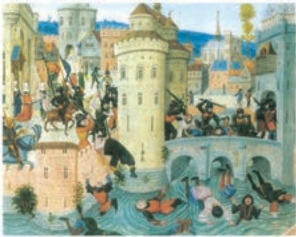
تابلوی سرکوب شورش کشاورزان توسط اربابان در قرن ۱۴م - انگلستان

وضعیت و موقعیت سرف‌ها؛ در قرون وسطا کار بر روی زمین‌های اربابان (فتودال‌ها) به عهدهٔ میلیون‌ها کشاورز وابسته به زمین بود که به آنها سرف می‌گفتند. گروهی از سرف‌ها، کشاورزان آزادی بودند که به علت بدهکاری سرف شدند. همچنین عده‌ای از کشاورزان به خاطر ناامنی و هرج و مرج زمین خود را به فرد نیرومندی واگذار کردند و در عوض، از حمایت او برخوردار شدند. سرف‌ها در پایین‌ترین مرتبهٔ اجتماعی نظام فتودالی قرار داشتند. سرف اجازه نداشت که ملک ارباب خود را ترک کند، اما در عین حال مانند برده نیز نبود که قابل خرید و فروش باشد.