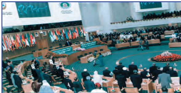
اجلاس سران کشورهای اسلامی - تهران ۱۳۷۶

بازرگانی منطقه‌ای که امروزه در بسیاری از مناطق جهان صورت می‌گیرد براساس همین قاعده است؛ برای مثال، کشورهای اروپایی با تشکیل اتحادیه اقتصادی و حتی انتخاب پول واحد، بازرگانی کل اروپا را تقریباً به صورت بازرگانی داخلی درآورده‌اند. اتحادیه ملل جنوب شرق آسیا معروف به آسه‌آن (ASEAN) ۲ با ده عضو، پس از آمریکا، ژاپن و اتحادیه اروپا چهارمین منطقه قدرتمند تجاری