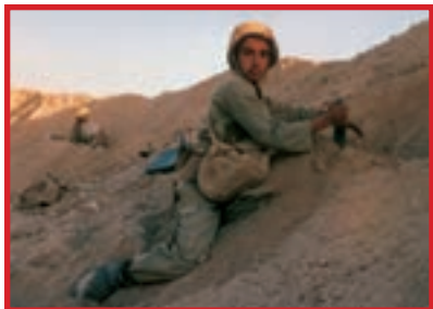
در دوران دفاع مقدس نوجوانان و دانش‌آموزان نیز دوشادوش بزرگ‌ترها به دفاع از سرزمین خود پرداختند.

پس از پیروزی انقلاب اسلامی و در دورانی که کشور ما مورد تهاجم و حشیاانه دشمن قرار گرفت، همه مردم در مقابل این هجوم صدام ایستادند تا دین و استقلال کشور ما پایجا بماند. از میان شهیدان دفاع مقدس، چند تن را به عنوان نمونه انتخاب و در این درس به کمک شما دانش‌آموزان عزیز معرفی می‌کنیم تا زندگی و مبارزات آنها الگوی همه جوانان ما قرار گیرد. در مورد زندگی، شخصیت و رشادت‌های شهیدان، کتاب‌ها، ویژه‌نامه‌ها و همچنین وبگاه‌های متعددی در فضای مجازی منتشر شده است که شما می‌توانید از این منابع استفاده کنید.