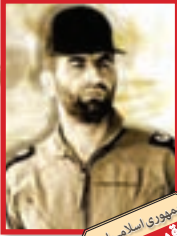
جمهوری اسلامی ایران قهرمان من دفاع مقدس