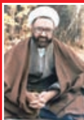
استاد شهید مطهری