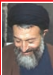
شهید دکتر بهشتی