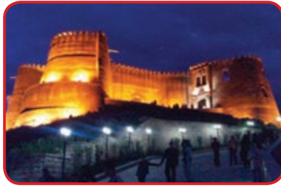
قلعه فلک الافلاک در خرم آباد یکی از اماکن مستحکم در دوران قدیم ایران