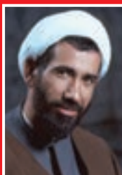
شهید دکتر باهنر