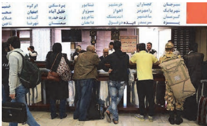
شکل ۳- متصدی فروش بلیت

■ متصدی انبار توشه مسافر: فردی است که در شرکت‌ها و پایانه‌های مسافربری مسئولیت دریافت توشه و کنترل توشه مسافران بر اساس دستورالعمل‌ها، ثبت و صدور رسید توشه، نگهداری و تحویل توشه را به عهده دارد.