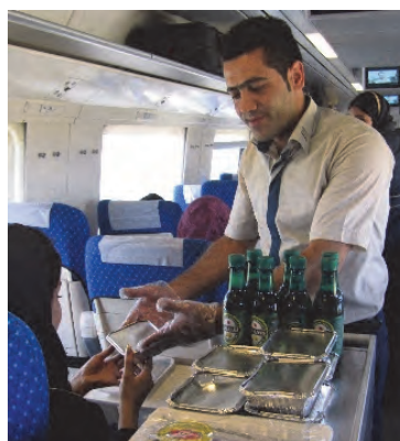
شکل ۴- مهماندار

■ کارمند خدمات ویژه مسافری: فردی است که به عنوان متصدی به افراد معلول و توان‌یاب بر اساس قوانین حمایت از معلولان و با استفاده از تجهیزات مناسب، وظیفه کمک‌رسانی به آنها را همراه با رعایت نکات ایمنی در وسایل نقلیه عمومی به عهده دارد.