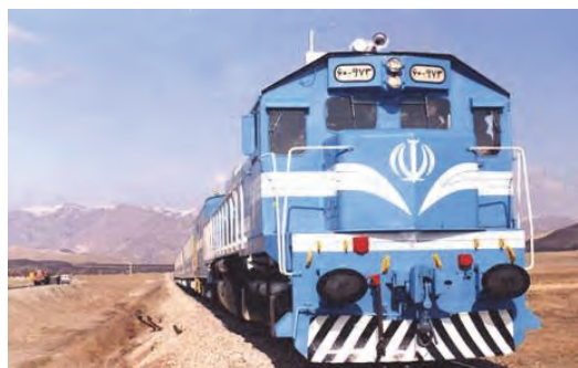
شکل ۲- حمل‌ونقل ریلی

اما حمل‌ونقل ریلی مابین ایستگاه‌هایی خاص در طول مسیر انجام می‌شود و قطار نمی‌تواند در هر مکانی که بخواهد توقف داشته باشد. اما حمل‌ونقل جاده‌ای متفاوت است. یعنی امکان حمل‌ونقل مسافر و یا تحویل گرفتن