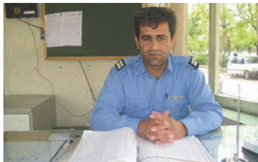
شکل ۵- نگهبان

■ متصدی ایمنی و آتش‌سوزی: فردی است که وظیفه پیشگیری از وقوع آتش‌سوزی در پایانه را به عهده دارد و هنگام وقوع آتش‌سوزی در پایانه افراد را از آتش دور کرده و تا رسیدن مأموران آتش‌نشانی با رعایت نکات ایمنی و با استفاده از تجهیزات اطفاء حریق را انجام داده و نکات فنی و موارد ضروری را به مأموران آتش‌نشانی گزارش می‌دهد.