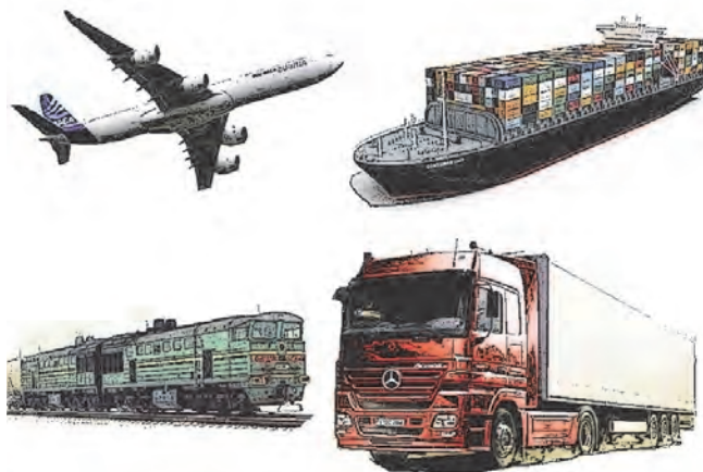
شکل ۱- حمل‌ونقل دریایی، هوایی، زمینی

حمل‌ونقل دارای شیوه‌های مختلف زمینی، هوایی و دریایی می‌باشد. در میان شیوه‌های حمل‌ونقل، حمل‌ونقل هوایی نسبتاً گران‌قیمت بوده و لذا برای مسافرت‌های سریع یا مسافت‌های طولانی و بارهای خاص مدنظر قرار می‌گیرد. حمل‌ونقل دریایی نیز، به وجود دریا یا مسیرهای آبی (دریا، اقیانوس) وابستگی دارد. بنابراین حمل‌ونقل در داخل کشورها غالباً به صورت جاده‌ای یا ریلی انجام می‌گیرد.