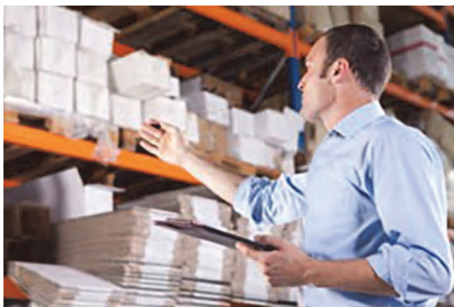
شکل ۶- متصدی انبار

■ متصدی سیستم‌های امنیتی پایانه: فردی است که وظایف دریافت کالا، چیدمان کالا، ثبت و صدور حواله کالا، نگهداری، تهیه گزارش‌ها و مستندسازی و تحویل کالا را براساس مقررات انجام می‌دهد.