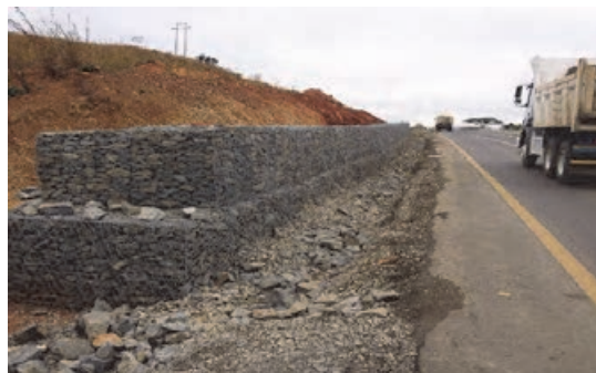
شکل ۱۰- دیوارهای گابیونی کنار راه

■ متصدی مسافربری بین‌المللی: که به آن کارگزار مسافربری هم می‌گویند. این فرد با در اختیار گذاردن وسیله حمل و نقل مناسب، زمان جابه‌جایی مشخص، تشریفات جانبی بین راهی و هزینه توافق شده، مسافر/ مسافران را از مبدأ توافقی به مقصد توافق شده می‌رساند.