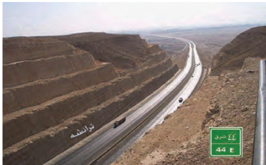
شکل ۹- ترانشه (شیروانی‌های خاکی اطراف راه)