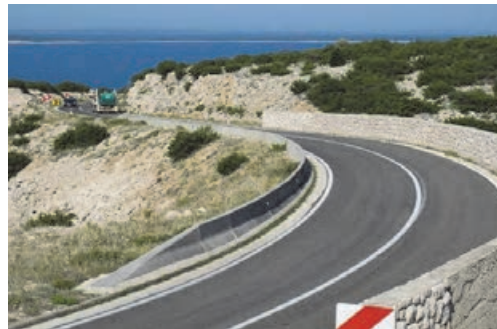
شکل ۸ - سنگ چینی اطراف راه