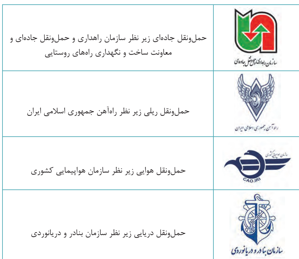
جدول ۱- سازمان‌های مرتبط با شیوه‌های مختلف حمل و نقل

در کشور ما متولی بخش حمل و نقل درون شهری (داخل شهر) وزارت کشور و شهرداری‌ها بوده و در سطح بین شهری و بین‌المللی (خارج کشور) وزارت راه و شهرسازی این امور را به عهده دارند. هر کدام از بخش‌های حمل و نقل برون شهری نیز به دلیل تفاوت در زیرساخت و بهره‌برداری، زیر نظر یکی از سازمان‌های تابعه وزارت راه و شهرسازی به صورت مجزا و با قوانین مربوط به آن می‌باشد.