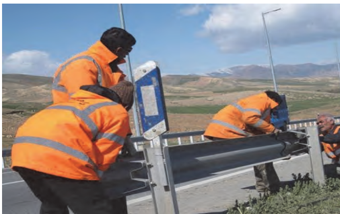
شکل ۷- نصب گاردریل کنار راه

گاردریل‌ها را می‌شناسد، توانایی بکارگیری سیستم گاردریل براساس شرایط فیزیکی و هندسی منطقه را دارد، قابلیت خواندن نقشه‌های اجرایی، برآورد مصالح و تجهیزات برای نصب گاردریل و اجرای عملیات نصب بر اساس استاندارد ایمنی راه‌ها و ابلاغیه‌های سازمان راهداری را دارد.