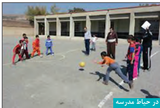
در حیاط مدرسه

بازی می‌تواند در جهت پر کردن اوقات فراغت ۱ مورد استفاده قرار گیرد.