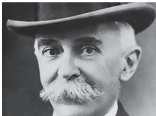
شکل ۱۸-۱- پیردوکوبرتن

پیردوکوبرتن، معلم فرانسوی و بنیان‌گذار بازی‌های المپیک نوین، معتقد بود که کمال‌جویی مشترک همه انسان‌ها می‌تواند نهضتی جهانی به وجود آورد که در حل صلح‌آمیز مسائل بین‌المللی مؤثر باشد. به نظر او بازی‌های المپیک تنها یک رویداد ورزشی نیست بلکه می‌تواند کانون اصلی یک نهضت بزرگ اجتماعی باشد که از طریق بازی و فعالیت‌های ورزشی تکامل انسانی را تقویت کند (شکل ۱۸-۱).