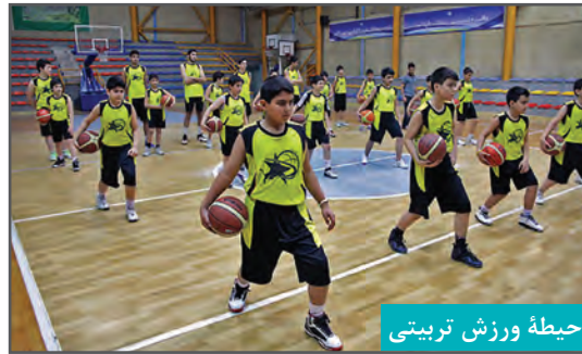
حیطه ورزش تربیتی