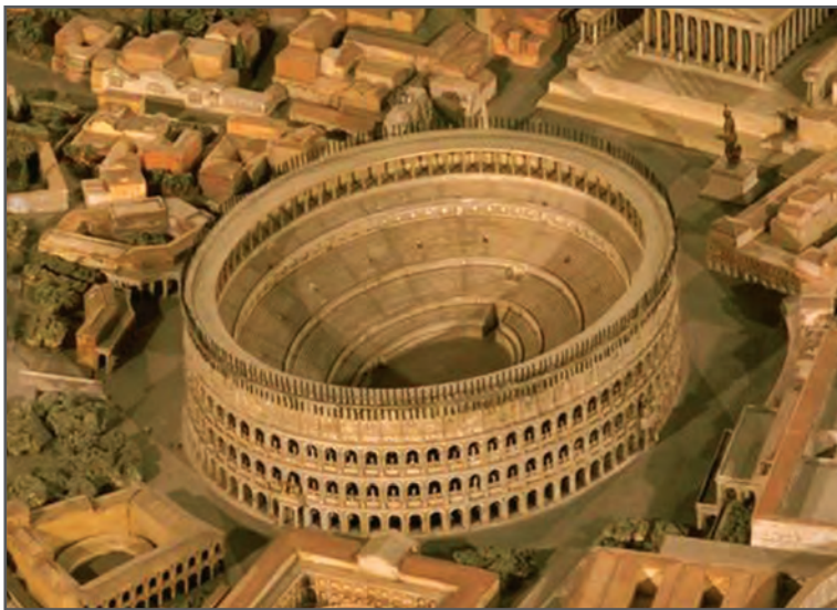
شکل ۱۳-۱- آمفی تئاتر کلوستوم (فلاوین) رومیان