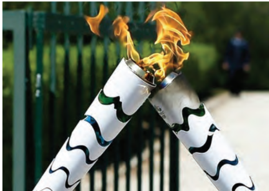
شکل ۲۰-۱- مشعل المپیک