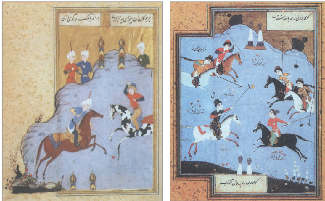
شکل ۱۵-۱- ورزش ایران در دوران پس از اسلام