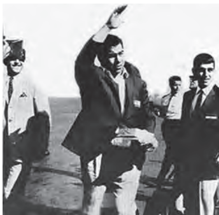
شکل ۱۶-۱- جهان پهلوان تختی اسطوره ورزشی

اسطوره‌های ورزشی، محدود به ورزش‌های باستانی نمی‌شوند، بلکه امروزه هم قهرمانانی هستند که می‌توانند سمبل تلاش، پشتکار و حتی مقابله با محدودیت‌های جسمانی باشند. نمونه‌هایی از این اسطوره‌های ورزشی