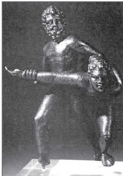
شکل ۱-۱۰- این تندیس به‌جا مانده از زمان بسیار دور، نشان‌دهنده نقش ورزش کشتی در فرهنگ آن دوران است.

از واژه ورزش، در دوره‌ها و قرون مختلف، برداشت‌های متعدد و متفاوتی شده است. با مطالعه تربیت بدنی و ورزش در تمدن‌های باستان متوجه می‌شویم که هر کدام با هدف خاصی برگزار می‌شده است. مثلاً در ایران باستان، اراپه‌رانی قسمت عمده‌ای از برنامه «جشن مهرگان» را به خود اختصاص می‌داده است. آموزش کشتی (شکل ۱-۱۰)، شنا و تیراندازی نیز اهداف نظامی داشته است. شکار نیز، برای رفع نیازهای غذایی و یا دفاع در برابر حمله حیوانات وحشی آموزش داده می‌شده است. در تمدن هند نیز، ورزش یوگا برای رهایی از شر و شور دنیا اجرا می‌شده است. در مجموع، می‌توان چنین نتیجه‌گیری کرد که، اولاً نوع فعالیت‌های ورزشی هر منطقه براساس فرهنگ، آداب و رسوم، شرایط اقلیمی و به‌ویژه نیازهای طبیعی آن منطقه، تنظیم شده است. ثانیاً بین فعالیت‌های بدنی و ورزشی و حرفه نظامی گری رابطه نزدیکی بوده است.