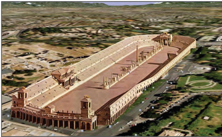
شکل ۱۲-۱- اماکن قدیمی ورزشی در روم باستان (ماکزیموس سیرک)