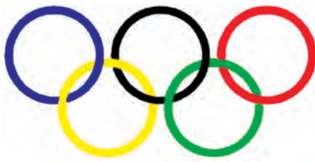
شکل ۱۹-۱. نماد المپیک