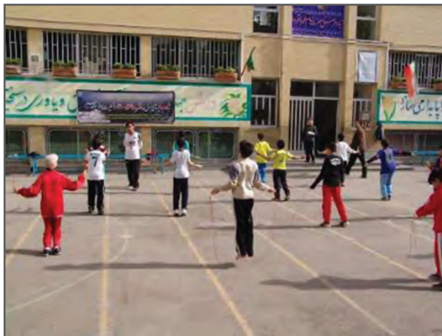
شکل ۱-۲- دانش آموزان در کلاس تربیت بدنی

براساس درک خود از تعاریف ورزش و تربیت بدنی، در مورد تفاوت های این دو با هم بحث و گفت و گو کنید و با راهنمایی معلم خود، نظرات یکدیگر را اصلاح نمایید.