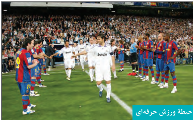
حیطه ورزش حرفه‌ای