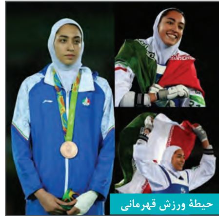
حیطه ورزش قهرمانی