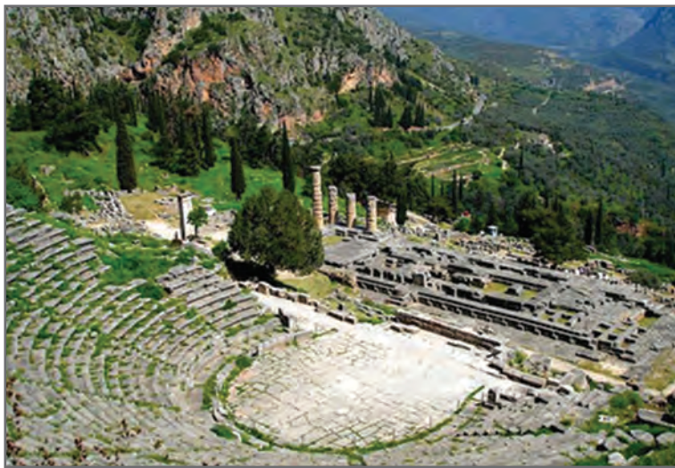
شکل ۱۱-۱. یکی از استادیوم‌های ورزشی ثنا که از دوران باستان به‌جا مانده است.

اماکن تمدن آتن عبارت بوده از مدارس کشتی به نام پالاسترا ۱ و استادیوم‌های ورزشی که عموماً خارج از شهر ساخته می‌شدند و در اغلب آنها «مدرسه کشتی» نیز وجود داشت (شکل ۱۱-۱). مدرسه نوجوانان مکان ورزشی دیگری بود که در آتن جدید، برنامه دو ساله‌ای برای تربیت بدنی تدارک دیده بود.