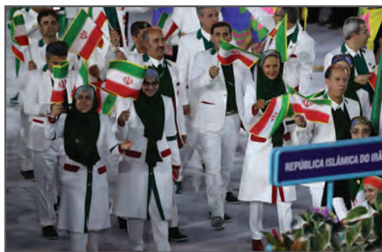
شکل ۱-۴- بازی‌های المپیک، رقابت‌های سازمان‌یافته با فلسفهٔ رقابت ملت‌ها با هدف اشاعهٔ ارتباطات