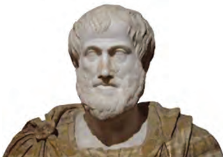
شکل ۷-۱- ارسطو

تربیت بدنی امری جهت‌دار و آماده‌سازی برای زندگی