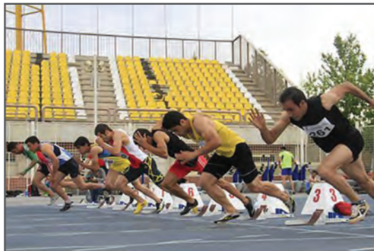
شکل ۵-۱- مسابقات قهرمانی با هدف کسب رکورد یا پیروزی بر حریفان