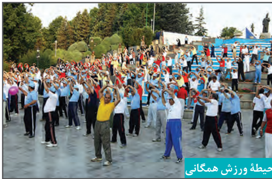
حیطه ورزش همگانی