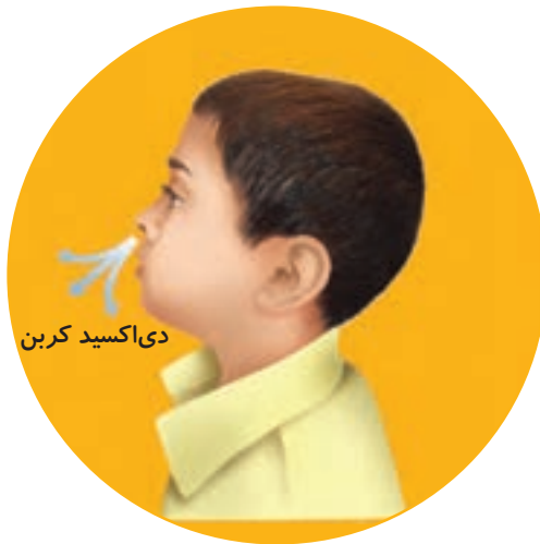
عمل باز دم

به مرحله‌ی دوم تنفس، که هوا (دی‌اکسید کربن) از شش‌ها خارج می‌شود، عمل بازدم می‌گویند.