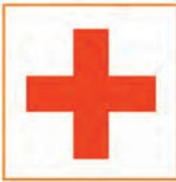
سازمان هلال احمر