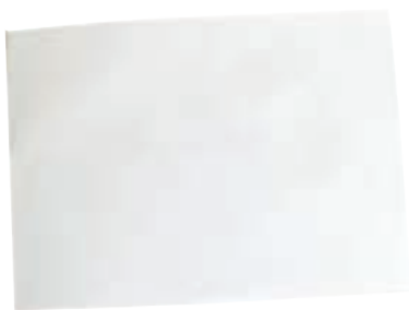
یک صفحه کاغذ