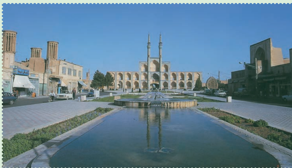
میدان تاریخی امیر چخماق در مرکز شهر یزد

با آنکه مغولان در آغاز ویرانی های بسیاری به همراه آوردند، ولی بر اثر آشنایی با فرهنگ ایران و اسلام، از طریق آنان فرهنگ، هنر و تمدن ایران و اسلام رواج یافت. پس از پایان حکومت ایلخانان، حکومت های ملوک الطوائفی و محلی متعددی چون تیموریان، آل جلایر، آل مظفر، سرداران و آل کرت، اتابکان، قراقویونلوها و آق قویونلوها طی قرن های هشتم و نهم قمری بر ایران حکومت کردند، اما هیچ کدام نتوانستند یکپارچگی ایران را حفظ کنند. سرانجام در سال ۹۰۷ق، حکومت صفوی توانست پس از