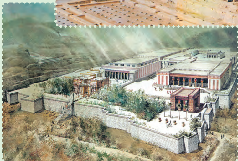
تخت جمشید و طرح خیالی آن

یافته است. ۱ برخی معتقدند، «ذوالقرنین» که در قرآن مجید ۲ به عنوان فرمانروایی نیک سیرت ستوده شده، همان کوروش پادشاه ایران است. ۳ با اینکه مؤسس دولت مقتدر هخامنشیان از سرزمین پارس