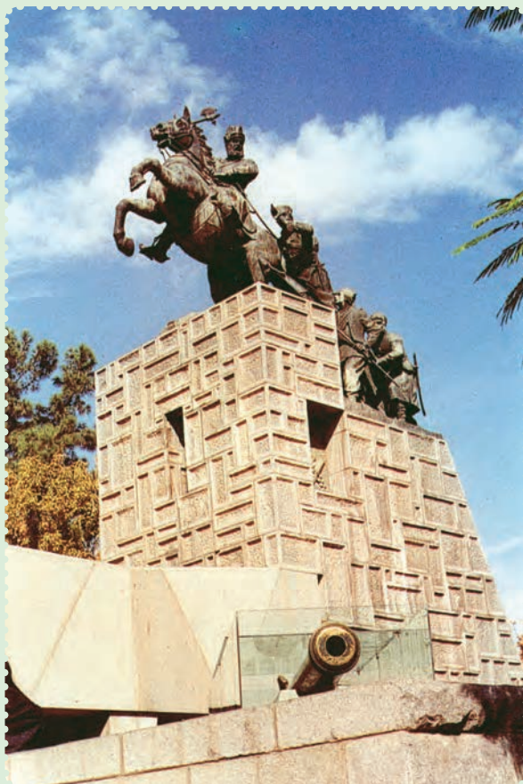
مجسمه و آرامگاه نادرشاه افشار در مشهد مقدس

توانست با شیوه حکومت داری توأم با ملاحظت، عدالت و رفاه نسبی، نام نیکی از خود بر جای بگذارد. ۱ وی تلاش کرد روابط خارجی ایران را که به دلیل هرج و مرج و نبود امنیت دچار اختلال شده بود، سامان بخشد، همچنین در برابر گسترش فعالیت‌های بازرگانی انگلستان در ایران ایستادگی کرد ۲ و از منافع نامشروع و استعماری این دولت جلوگیری به عمل آورد.