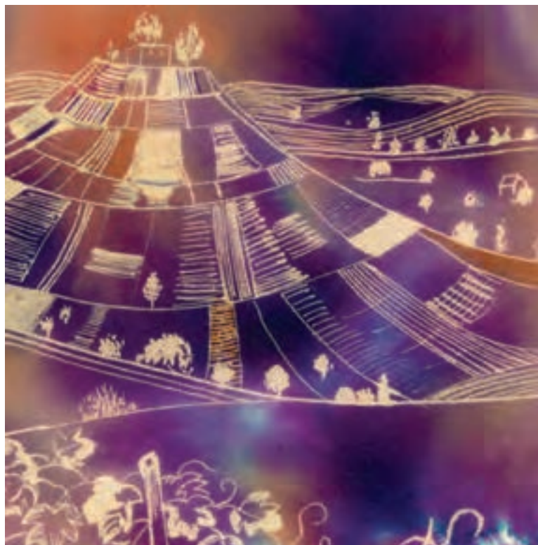
▲ تصویر ۵۷- ب - اثر دانشجو مهناز سیداختیاری