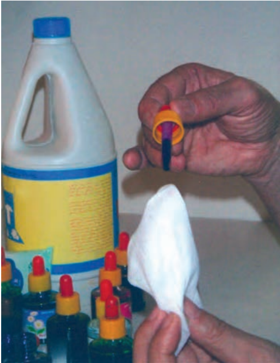
▲ تصویر ۵۵ - تصویر نشان دهنده مرحله اول شیوه جوهرهای رنگی و پاک‌کننده است که با قطره‌چکان بر دستمال کاغذی مرطوب اکولین می‌چکانیم

در این شیوه ابتدا دستمال کاغذی را با آب مرطوب می‌کنیم. سپس با استفاده از قطره‌چکان چند قطره از رنگ دلخواه را همان‌گونه که در تصویر ۵۵ مشاهده می‌کنیم بر روی دستمال کاغذی مرطوب که چند تا خورده می‌چکانیم. و با توجه به خیس بودن سطح دستمال رنگ به راحتی و به صورت اتفاقی بر سطح دستمال پخش می‌شود. و با همین شیوه رنگ‌های دیگر را به آن اضافه می‌کنیم. نتیجه حاصله رنگ‌هایی با شکل‌های غیرمنتظره و زیبا می‌باشد (تصویر ۵۶- الف و ب). بعد از این که رنگ‌گذاری به اتمام رسید، تای دستمال را به دقت باز نموده و صبر می‌کنیم تا کاملاً خشک شود و سپس با پاک‌کننده (سفیدکننده) بر روی آن طرح مورد نظر خود را اجرا می‌کنیم (تصویر ۵۶- الف تا ج). و طرح به صورت خطوط نگاتیو (سفید) بر سطح دستمال کاغذی بوجود می‌آید و پاک‌کننده به خوبی رنگ را پاک می‌کند.