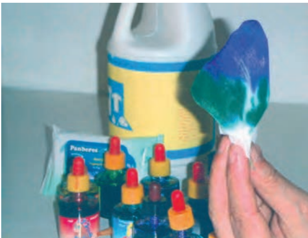
▲ تصویر ۵۶- الف - نشان دهنده مرحله دوم رنگ آمیزی با جوهرهای رنگی و پاک کننده است.