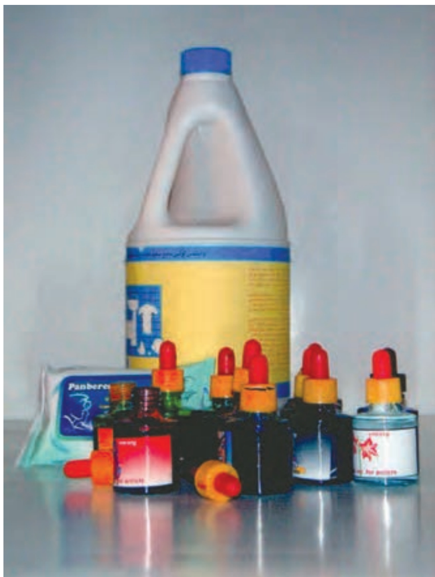
▲ تصویر ۵۴- در تصویر وسایل مورد نیاز شیوه جوهرهای رنگی و پاک‌کننده (سفیدکننده) دیده می‌شود

جوهرهای رنگی، دستمال کاغذی، پاک‌کننده، قلم موی الیاف مصنوعی و یا چوب کبریت (تصویر ۵۴).