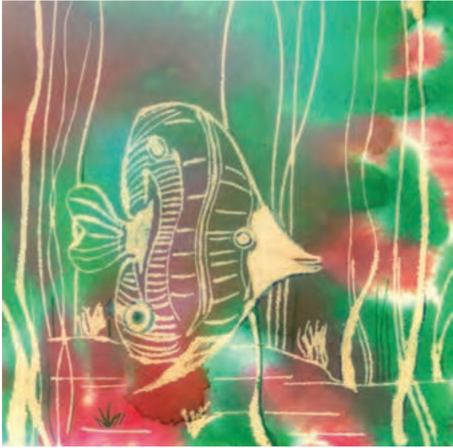
▲ تصویر ۵۷-ج - اثر دانشجو مهناز سیداختیاری