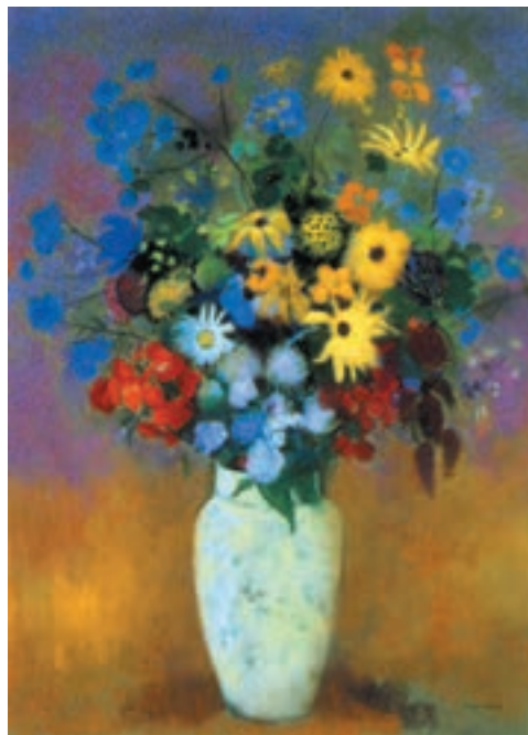
تصویر ۱۹-۱- اثر اُدیلن رِدُن ۲ ، پاستل روی کاغذ، (۷/۵۳ × ۷۳ سانتی متر)

رنگهای اصلی و ثانویه یکی از رنگهای اصلی را بیشتر به کار ببرید، آن رنگ جلوه درخشان تری می یابد. شما، تضاد ته رنگ یا رنگهای اصلی را در طبیعت به طور خالص، بندرت مشاهده می کنید. استفاده از رنگها به صورت خالص در کنار یکدیگر را در آثار برخی نقاشان معاصر می توانید ببینید. در تصویر (۱۹-۱)، نقاش با استفاده از رنگهای خالص در کنار سایر رنگها، درخشش رنگهای اثر خود را دو چندان کرده است.