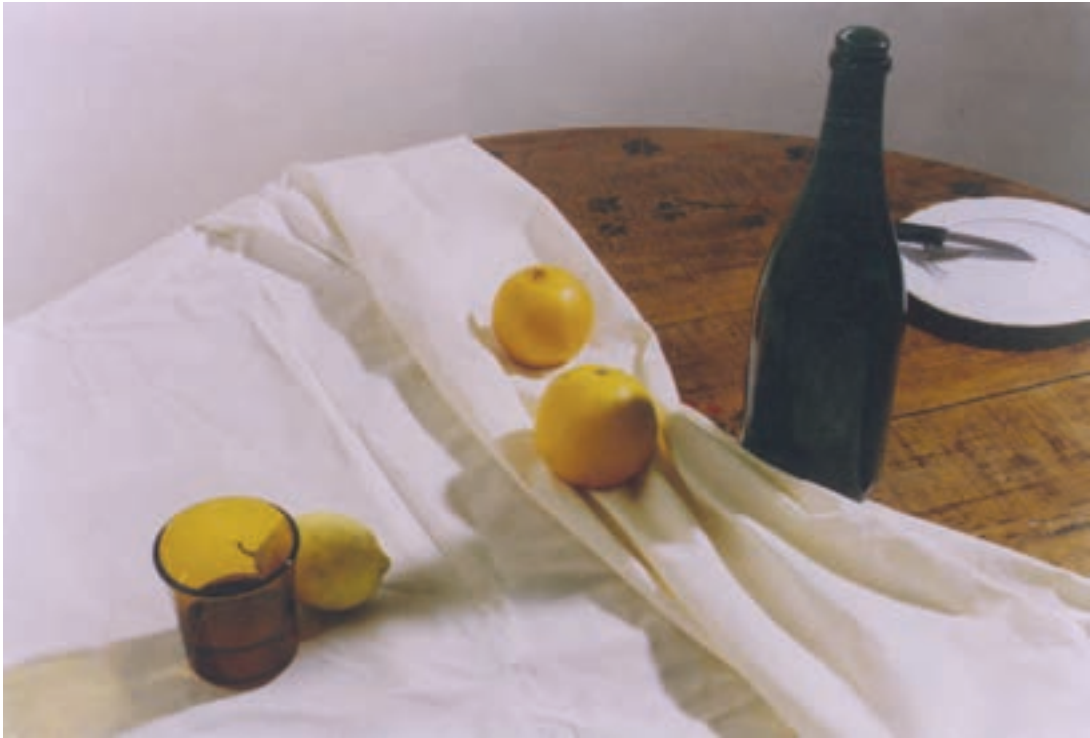
تصویر ۹-۱- زاویه دید معمولی