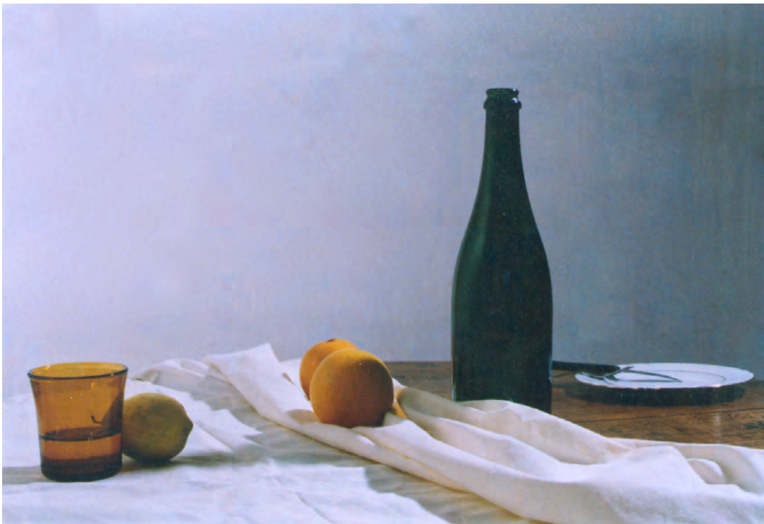
تصویر ۸-۱- زاویه دید از کنار

چندین طرح از مدل خود، از زوایای مختلف تهیه کنید و در نهایت بهترین طرح را که از نظر ترکیب‌بندی متعادل و مناسب است، برگزینید. در تصاویر (۱-۸) و (۱-۹) و (۱-۱۰)، تغییر زاویه دید در یک مدل طبیعت بی‌جان چیده شده را ملاحظه می‌کنید.