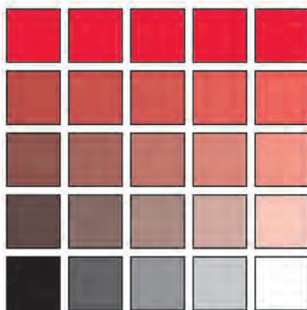
تصویر ۱۶-۱- تغییر درجات تیره و روشن رنگهای اصلی به کمک سیاه و سفید و خاکستریهای مابین