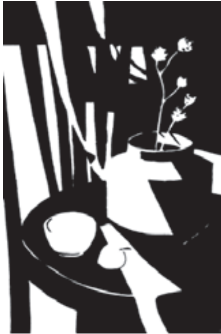
تصویر ۱۲-۱- اجرای کار با سطوح تفکیک شده سیاه و سفید