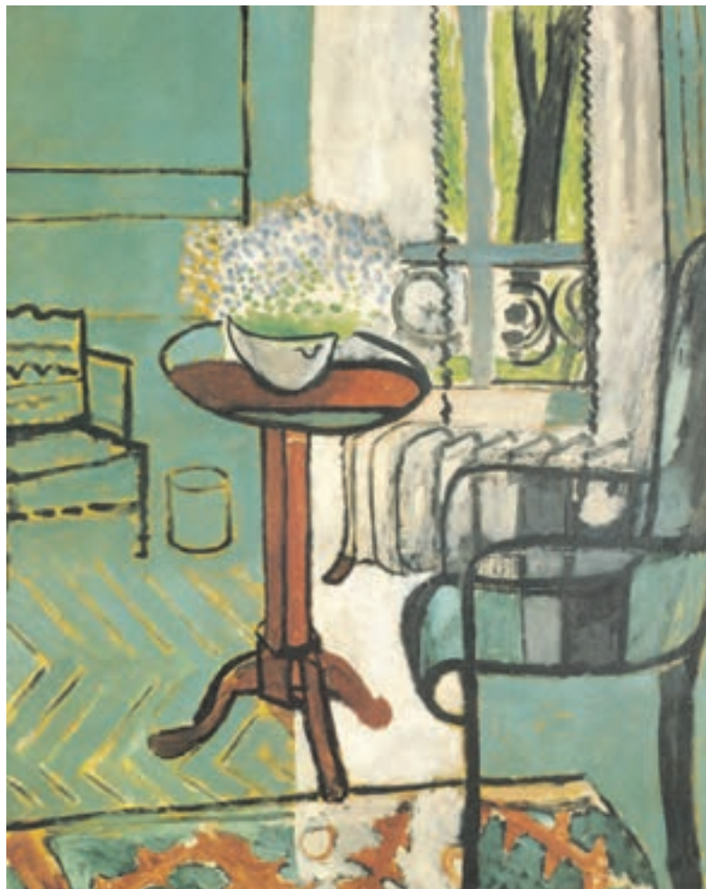
تصویر ۱-۴ اثر هانری ماتیس، رنگ روغن روی بوم، (۱۱۶/۸ × ۱۴۶ سانتی متر)

خواهید کرد. در مورد نور و سایه نیز، نقاط نزدیک به نور، روشن تر و سایه ها به تیرگی و سیاه تبدیل خواهد شد. برای درک چگونگی ایجاد عمق در یک اثر به وسیله درجات خاکستریها و سیاه و سفید، تجربه ایجاد درجات مختلف خاکستری (اکروماتیک ۱ ) ضروری است.