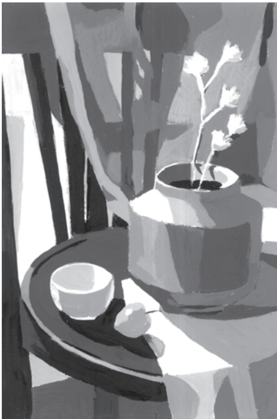
تصویر ۱۴-۱— اجرای کار با سطوح تفکیک شده سیاه و سفید و پنج خاکستری مابین

— اجرای کار با سطوح تفکیک شده سیاه و سفید و پنج خاکستری مابین در این تمرین، یکی دیگر از طرحهای خطی خود را به کمک پنج خاکستری که قبلاً در ظروف جداگانه تهیه کرده‌اید رنگ‌آمیزی کنید، به گونه‌ای که تیرگی و روشنیها، فضای دور و نزدیک و حجم را القا نماید. در اینجا، چگونگی جایگزینی سطوح سفید و سیاه در میان خاکستریها در ایجاد عمق، از اهمیت ویژه‌ای برخوردار است (تصویر ۱۴-۱).