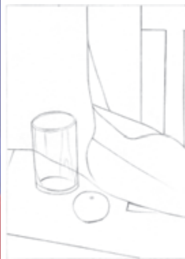
تصویر ۲۱-۱- اجرای کار با سه رنگ اصلی (زرد، قرمز و آبی)