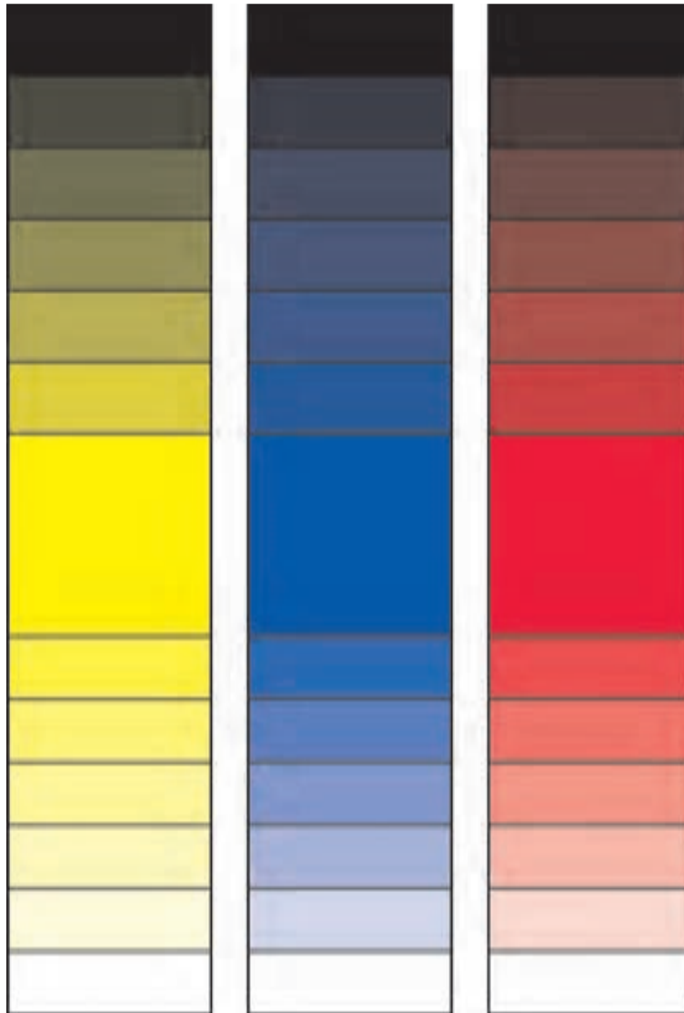
تصویر ۱-۱۵- تغییر درجات تیره و روشنی رنگ به کمک سیاه و سفید

تا اینجا، تضاد تاریک و روشن را با توجه به رنگهای سیاه و سفید و خاکستریهای مابین آنها، مورد آزمایش و بحث قرار دادیم. اکنون بسیار مهم و جالب است که همین تضاد تاریک و روشن را با رنگهای زرد، قرمز و آبی تجربه کنیم. در اینجا، می‌توانید یک رنگ اصلی را به دلخواه به پالت سیاه و سفید و خاکستریهای خود اضافه کنید. هنگامی که یک رنگ (به‌طور مثال، رنگ زرد و یا آبی) و تغییرات آن بر تمامی کار غلبه دارد، گفته می‌شود که اثر در تونالیته ۱ زرد و یا آبی کار شده است. تونالیته مشخص موجب وحدت رنگی در یک اثر نقاشی خواهد بود. با کاهش تعداد رنگهایی که در یک اثر به کار گرفته می‌شود می‌توان هماهنگی رنگی ساده‌تری به وجود آورد. تصاویر (۱-۱۵) و (۱-۱۶)، شما را در جهت شناخت هر چه بیشتر درجات مختلف تیره و روشن یک رنگ اصلی راهنمایی می‌کند. در تصویر (۱-۱۵) شما تغییر درجات تیره و روشن یک رنگ اصلی با کمک سیاه و سفید را ملاحظه می‌کنید.