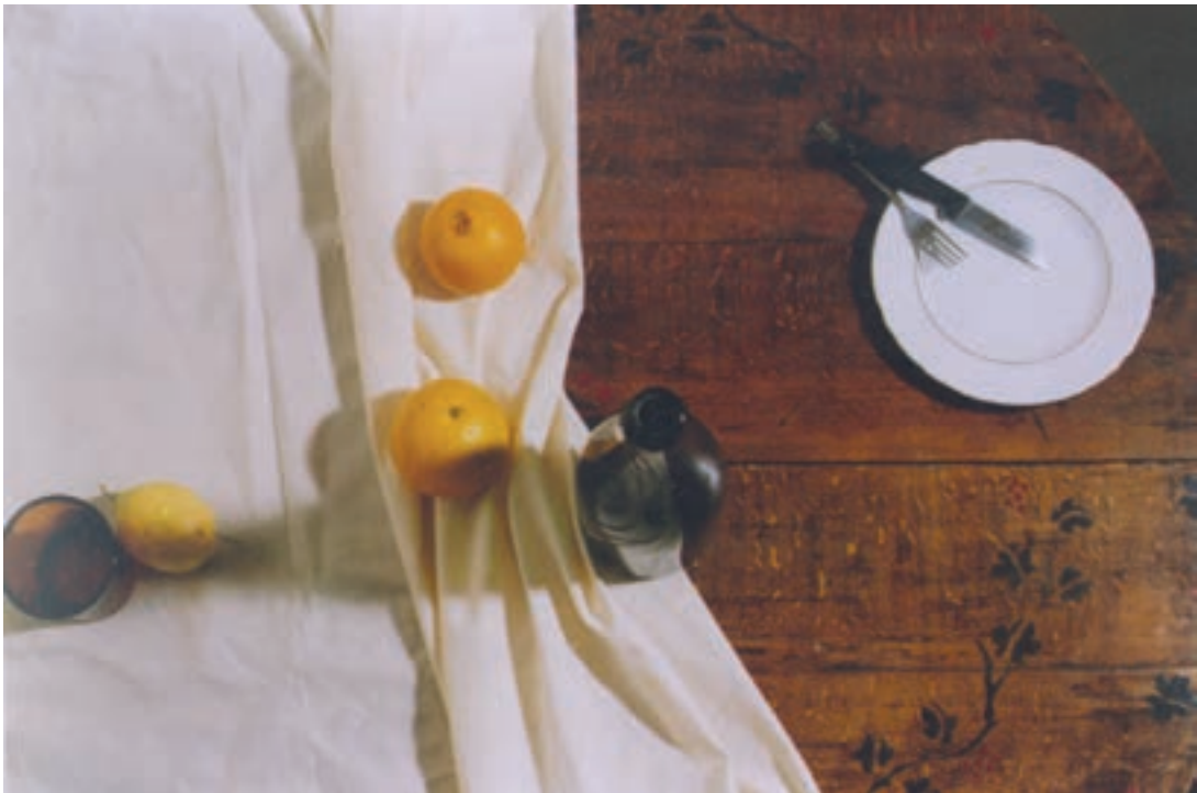
تصویر ۱۰-۱- زاویه دید از بالا

پس از تهیه پیش طرح مناسب، تصویر الف (۱-۱۱) طرح را به صورت خطی به روی مقوای مناسب انتقال داده تا برای اجراهای مختلف در تمرین‌ها مورد استفاده قرار گیرد تصویر ب (۱-۱۱).