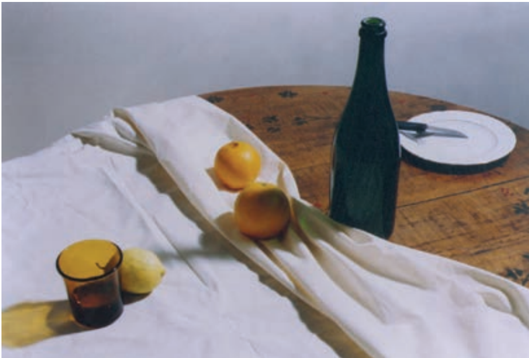
تصویر ۷-۱- نورپردازی از بالا سمت راست

چندین طرح از مدل خود، از زوایای مختلف تهیه کنید و در نهایت بهترین طرح را که از نظر ترکیب‌بندی متعادل و مناسب است، برگزینید. در تصاویر (۱-۸) و (۱-۹) و (۱-۱۰)، تغییر زاویه دید در یک مدل طبیعت بی‌جان چیده شده را ملاحظه می‌کنید.