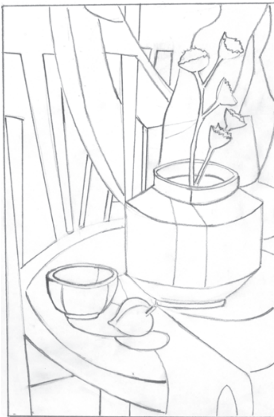
تصویر ب ۱۱-۱