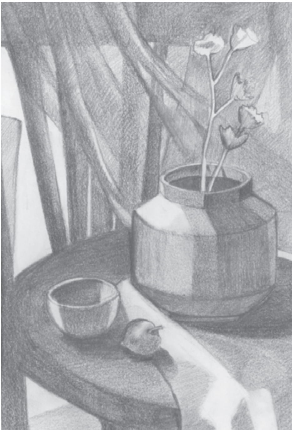
تصویر الفان ۱۱-۱- پیش طرح