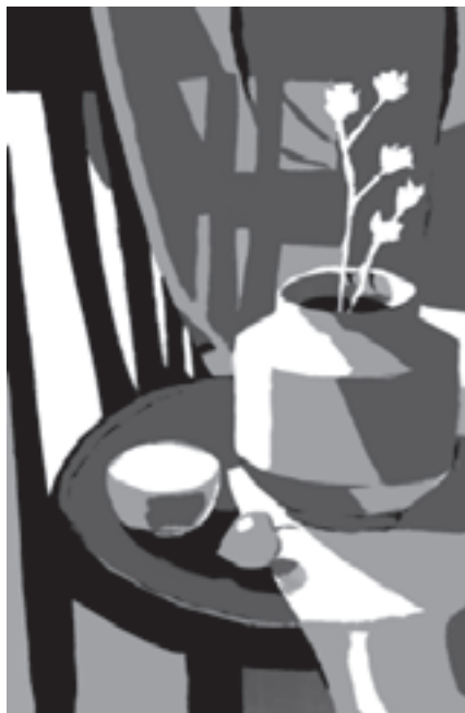
تصویر ۱۳-۱- اجرای کار با سطوح تفکیک شده سیاه و سفید و دو خاکستری مابین

یکی از طرحهای خطی خود را که به روی مقوا کپی برداری کرده‌اید انتخاب کنید و به کمک این چهاررنگ، (یعنی سیاه و سفید و دو خاکستری مابین) رنگ‌آمیزی نمایید به گونه‌ای که میان آنها تعادل برقرار باشد. استفاده از تعداد بیشتری از خاکستریها در حجم‌نمایی و ایجاد فضای سه بعدی، شما را یاری می‌کند (تصویر ۱۳-۱).