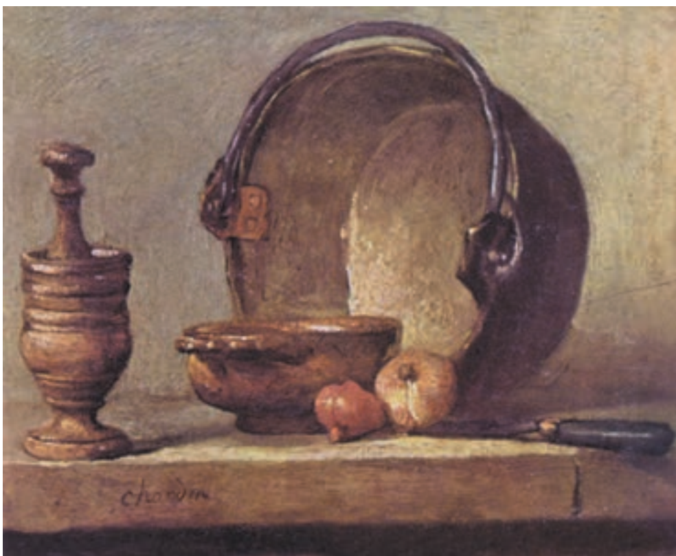
تصویر ۱-۲ اثر سیمون شاردن، رنگ روغن روی بوم، (۱۷×۲۰ سانتی متر)