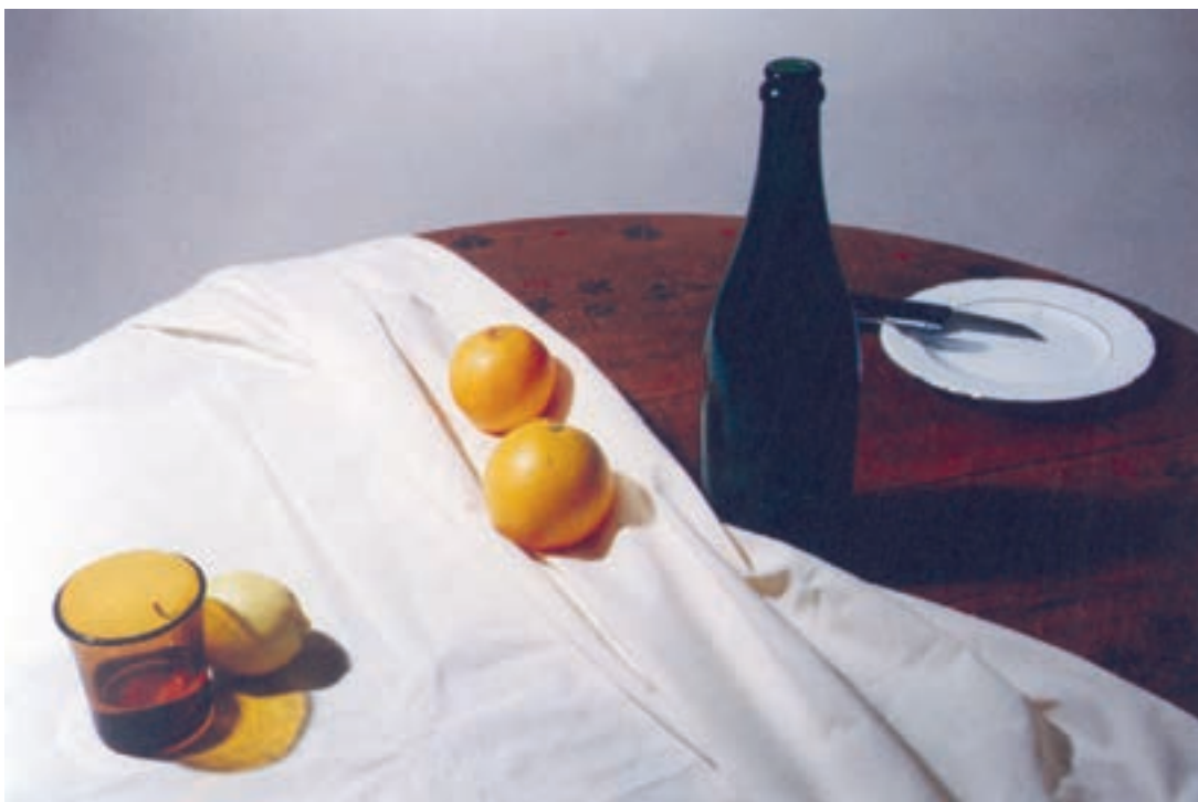
تصویر ۶-۱- نورپردازی از بالا سمت چپ

تغییر زاویه تابش نور مصنوعی در یک طبیعت بی‌جان، سبب ایجاد حالات متفاوتی در کار خواهد شد. در تصاویر (۶-۱) و (۷-۱) تغییر جهت زاویه تابش نور را بر یک طبیعت بی‌جان ملاحظه می‌کنید. در کار خود، با دور و نزدیک کردن منبع نوری خود به مدل می‌توانید در ایجاد سایه‌های دلخواه خود دخالت کنید.