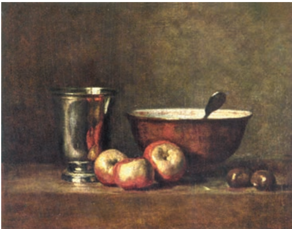
تصویر ۱-۱ اثر سیمون شاردن، رنگ روغن روی بوم، (۳۳×۴۱ سانتی متر)