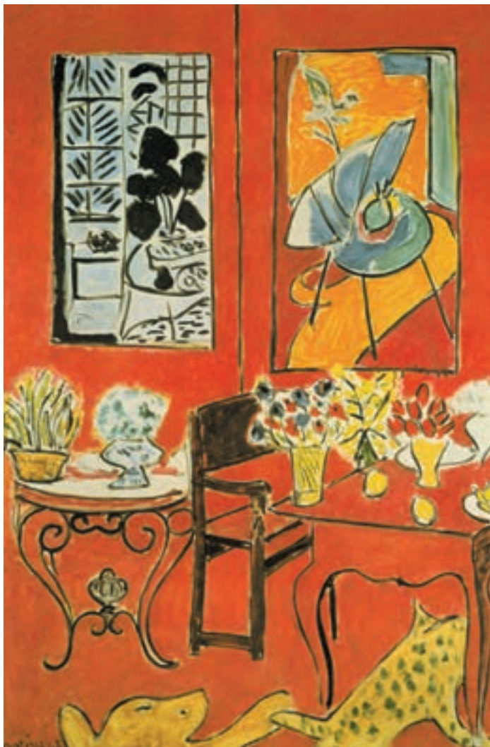
تصویر ۲۰-۱- اثر هانری ماتیس، رنگ روغن روی بوم، (۹۷×۱۴۶ سانتی متر)

همچنین در تصویر (۲۰-۱)، استفاده از خلوص رنگی مشاهده می‌شود. گفتنی است نقاشانی که از این شیوه رنگ‌گذاری در کارشان استفاده می‌کنند کمتر در پی ایجاد عمق به شیوه معمول و متعارف هستند و غالباً آثارشان تخت و دو بعدی به نظر می‌رسد.