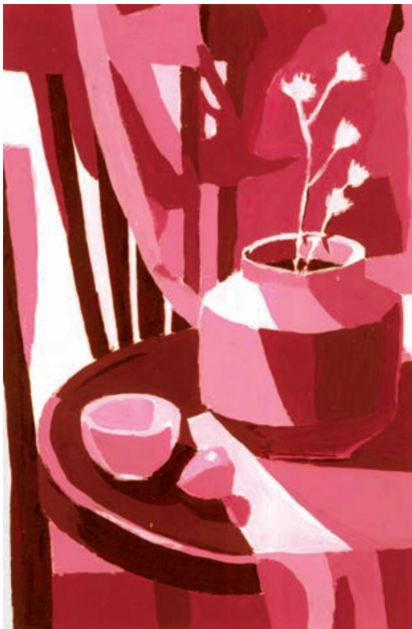
تصویر ۱۷-۱ — اجرای کار با کمک درجات تیره و روشن حاصل از ترکیب سیاه و سفید و یک رنگ اصلی

— اجرای کار با کمک درجات تیره و روشن حاصل از ترکیب سیاه و سفید و یک رنگ اصلی پیش طرح تهیه شده خود را با کمک تغییر درجات تیره و روشن یک رنگ اصلی، متناسب با موضوع رنگ‌آمیزی کنید. در این مورد می‌توانید از تصویر (۱۶-۱) کمک بگیرید. بدین منظور، یک رنگ اصلی را انتخاب و آن را به سیاه و سفید اضافه کنید. رنگهای متمایل به روشن خود را، در مناطق روشن و رنگهای متمایل به سیاه را برای تیرگیها به کار ببرید تصویر (۱۷-۱).