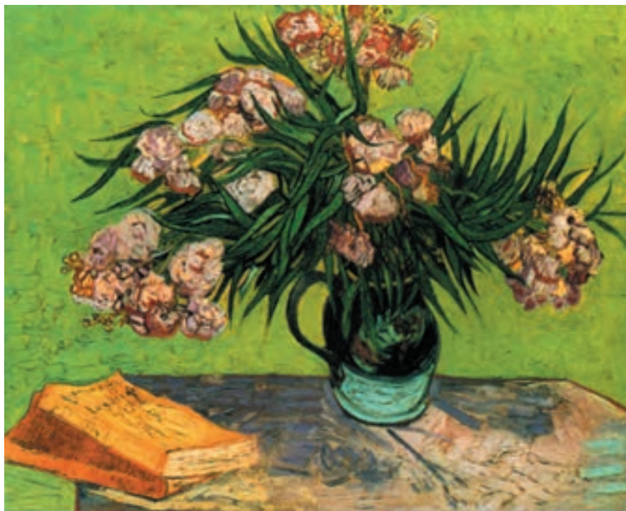
تصویر ۱-۳ اثر ونسان ون‌گوگ، رنگ روغن روی بوم

با مطالعاتی که نقاشانی چون دلاکروا ۱ ، ترنر ۲ و کانستبل ۳ و ... در زمینه نور داشتند و نقاشان امپرسیونیست ۴ مطالعات آنها را ادامه و گسترش دادند. امروزه، نور را به واسطه رنگ بیان می‌کنیم. یعنی با کنار هم قرار دادن دو رنگ زرد و بنفش در یک اثر نقاشی، بنفش می‌تواند به راحتی نقش سایه را بازی نموده و زرد نمایانگر نور باشد. در تصویر ۱-۳ ون‌گوگ ۵ به خوبی از دو رنگ زرد و بنفش به عنوان نور و سایه استفاده کرده است.