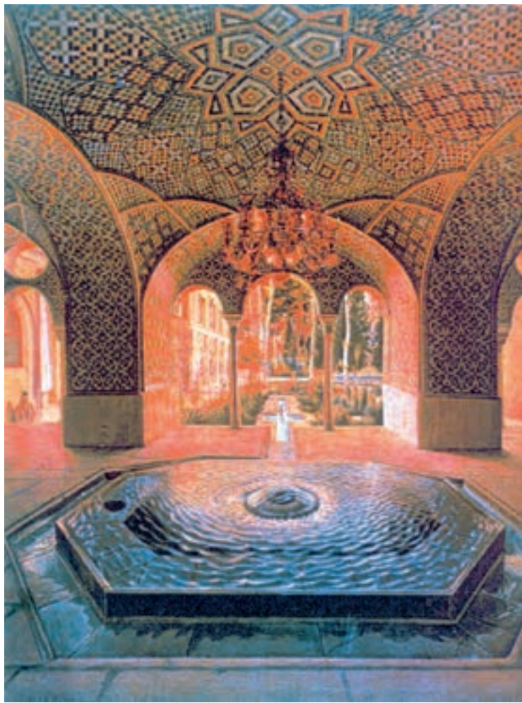
تصویر ۶۴-۲- حوض‌خانه‌ی کاخ گلستان، اثر کمال‌الملک، رنگ روغن روی بوم