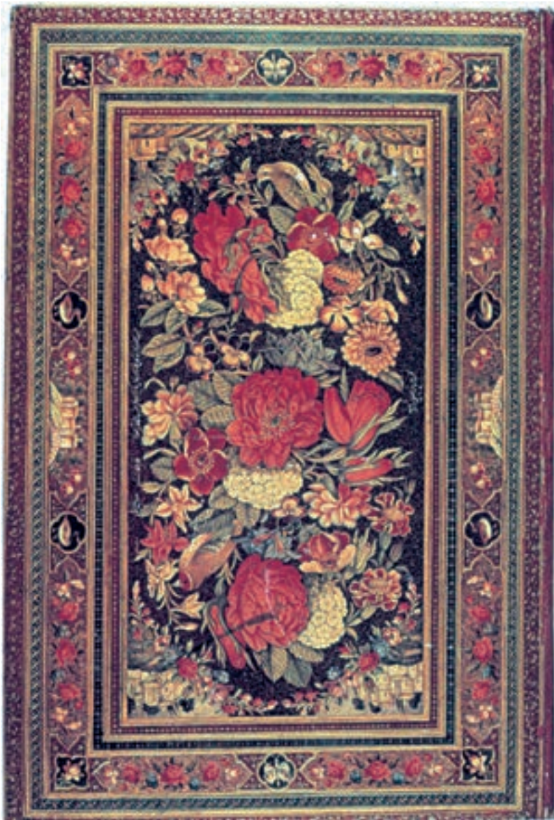
تصویر ۵۲-۲- گل و مرغ، نقاشی زیرلاکی، اثر لطفعلی صورتگر، سده‌ی ۱۳ ه.ق

در این روزگار روش غالب، استفاده از رنگ روغنی و بوم‌های پارچه‌ای بزرگ است این وسیله‌ی جدید که از اواسط حکومت صفویه و در مکتب اصفهان، در میان نقاشان رواج یافته بود به تدریج اصلی‌ترین ابزار در تولید تابلوهای نقاشی می‌شود. نقاشی زیرلاکی نیز که با آبرنگ اجرا می‌شد در این دوره رونق می‌یابد و از استادان آن می‌توان علی‌اشرف و لطفعلی صورتگر را نام برد (تصویر ۵۲-۲).