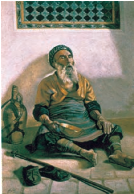
تصویر ۶۷-۲- سقای خسته، اثر رسام ارژنگی، رنگ روغن روی بوم، ۱۳۰۱ ه.ش.