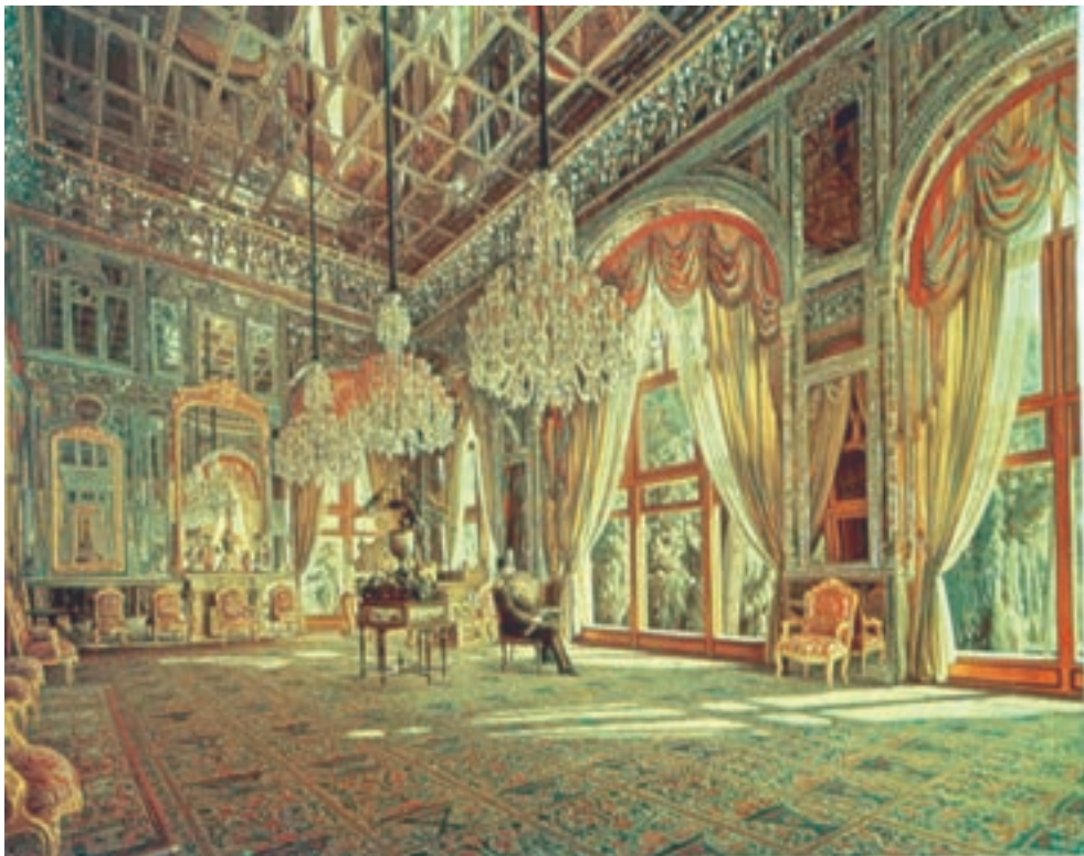
تصویر ۶۵-۲- تالار آینه، اثر کمال‌الملک، رنگ روغن روی بوم، ۱۳۰۳ ه.ق