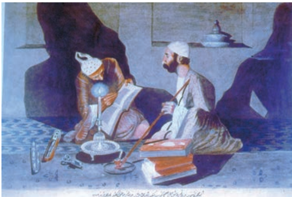
تصویر ۲-۶۲- استنساخ، اثر محمودخان صبا، رنگ روغن روی بوم، ۱۲۷۵ ه.ق

شخصی و تمایلات اجتماعی کم‌رنگ نیز در برخی از آثار وی به چشم می‌خورد. کمال‌الملک سال‌هایی از عمر خود را در ایتالیا و فرانسه گذراند و در دوره‌ی انقلاب مشروطیت هم چند سالی در عراق بود تا آن که به ایران بازگشت و مدرسه‌ی صنایع مستظرفه را در تهران بنیاد نهاد و ریاست آن را به عهده گرفت. وی در این مدرسه به پرورش شاگردانی همت گماشت که بعداً خود در مکتب او استاد شدند. در گسترش طبیعت‌گرایی در نقاشی ایران، هنرمندان دیگری چون موسی ممیزی، محمودخان صبا و مهدی مصورالملکی نیز مؤثر بودند، اما تأثیر‌گذاری هیچ‌کدام به اندازه‌ی کمال‌الملک نبود (تصاویر ۲-۶۲، ۲-۶۳، ۲-۶۴، ۲-۶۵ و ۲-۶۶).