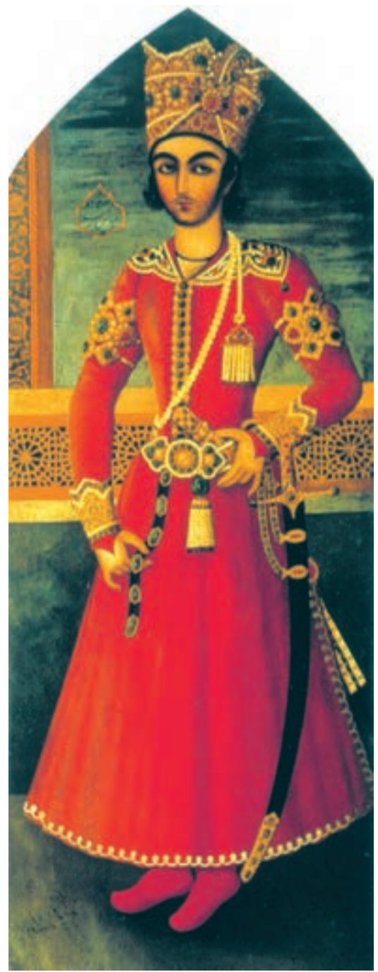
تصویر ۵۶-۲- چهره‌ی عباس میرزا، اثر عبدالله خان، رنگ روغن روی بوم، حدود ۱۲۴۰ هـ.ق