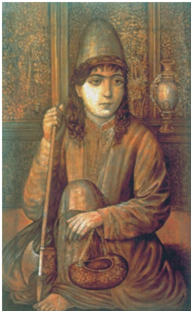
تصویر ۶۱-۲- چهره‌ی نورعلی‌شاه، اثر اسماعیل جلایر، رنگ روغن روی بوم، ۱۳۸۲ ه.ق.

در این روزگار اگرچه در گوشه و کنار کشور برخی هنرمندان خودساخته، سنت‌های هنری همچون قلمدان نگاری، نقاشی زیرلاکی و نگارگری و تذهیب را دنبال می‌کردند ولی مسیر اصلی هنر نقاشی همانا میل به طبیعت‌گرایی غربی بود، که استادان آموزش دیده در مغرب زمین و همکاران‌شان آن را توسعه می‌دادند و دربار قاجار نیز مشوق آن بود. علاوه بر مجمع‌الصنایع که به سرپرستی صنایع‌الملک، هنر طبیعت‌گرایی غربی را در میان هنر دوستان رواج می‌داد مدرسه‌ی دارالفنون نیز، که به همت امیرکبیر دایر شده بود، در کنار فعالیت علمی، آموزش‌های هنری را هم آغاز کرده بود و هنرمندانی نظیر ابوتراب غفاری، محمد غفاری (کمال‌الملک) و اسماعیل جلایر از جمله نقاشانی بودند که در این مدرسه آموزش دیدند. (تصویر ۶۱-۲)