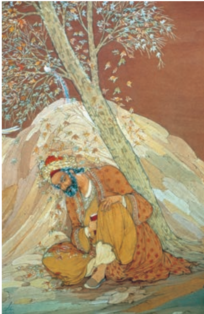
تصویر ۷۳-۲- افسوس که نامه‌ی جوانی طی شد. اثر حسین بهزاد، ۱۳۲۸ ه.ش.