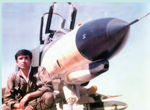
خلبان شهید عباس دوران

صدام پیش از آغاز جنگ تحمیلی و در نشست سران جنبش عدم تعهد در هاوانا (پایتخت کوبا)، میزبانی نشست بعدی را در بغداد بر عهده گرفت. با نزدیک شدن به زمان برگزاری این نشست، در ۳۰ تیر ۱۳۶۱، شش خلبان شجاع و فداکار نیروی هوایی ارتش جمهوری اسلامی ایران با سه فروند هواپیمای جنگی با هدف ناامن نشان دادن بغداد و جلوگیری از نشست سران جنبش عدم تعهد در پایتخت عراق، آماده عملیات شدند. یکی از این خلبانان شهید عباس دوران بود که در دو سال نخست جنگ، بیش از ۱۲۰ عملیات هوایی موفقیت‌آمیز علیه دشمن بعثی انجام داده بود. هواپیمای دوران در جریان این عملیات و پس از بمباران پالایشگاه بغداد، هدف اصابت موشک پدافند هوایی نیروهای بعثی قرار گرفت. این خلبان رشید با وجود اینکه می‌توانست با استفاده از چتر نجات سالم فرود آید، هواپیمای در حال سقوط را صاعقه‌وار به مکانی نزدیک محل برگزاری نشست سران عدم تعهد کوبید و رؤیای صدام را برای تشکیل آن نشست در بغداد و ریاست بر آن به باد داد.