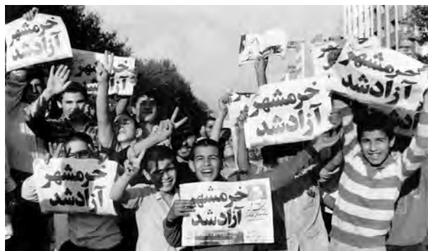
شادی دانش‌آموزان پس از آزادی خرمشهر

رهایی خرمشهر علاوه بر تقویت وحدت ملی در داخل کشور، ابتکار عمل را در جنگ به ایران داد. پس از فتح خرمشهر، جنگ وارد مرحله تازه‌ای شد؛ از یک سو موفقیت‌های نظامی رزمندگان ایرانی ادامه یافت و از سوی دیگر، حامیان خارجی صدام برای جلوگیری از سقوط او، انواع تجهیزات نظامی پیشرفته و سلاح‌های میکروبی و شیمیایی را در اختیار وی گذاشتند. بمباران شیمیایی شهر سردشت در استان کردستان، روستای زرده از توابع شهرستان دالاهو در استان کرمانشاه و شهر حلبچه در کردستان عراق، از جمله جنایت‌های جنگی حکومت بعثی عراق به‌شمار می‌رود. نیروهای متجاوز که در جبهه جنگ متحمل شکست‌های سنگینی شده بودند، بیش از گذشته مناطق مسکونی و مردم غیرنظامی را با هواپیما و موشک هدف قرار دادند.