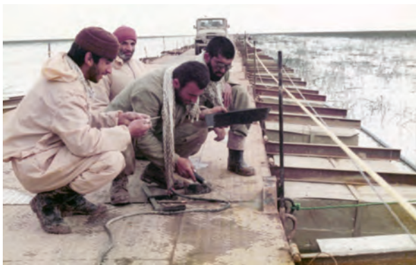
ساخت بل شناور خیبر بر روی هورالعظیم یکی از شاهکارهای مهندسی رزمی جهادگران در دوران دفاع مقدس بود.