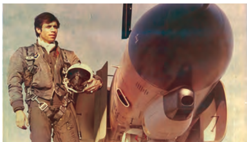
خلبان شهید محمد صالحی، از نخستین شهدای نیروی هوایی ارتش جمهوری اسلامی ایران

۴ تصمیم می‌گیرد که مجدداً و در صورت نیاز تشکیل جلسه دهد تا اتخاذ دیگر تدابیر لازم را برای اجرای این قطعنامه بررسی کند.