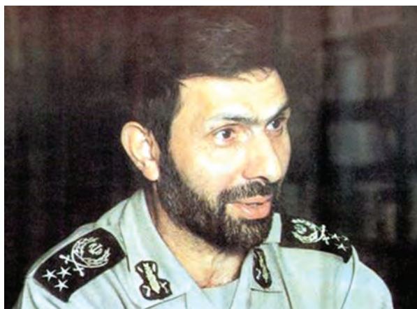
شهید سپهبد علی صیاد شیرازی (۱۳۲۳ - ۱۳۷۸) فرمانده نیروی زمینی ارتش در دوران دفاع مقدس رشادت زیادی از خود نشان داد.