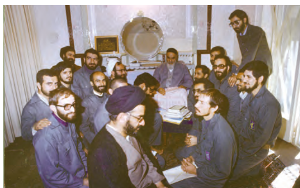
جمعی از فرماندهان ارشد سپاه در دوران دفاع مقدس در دیدار با حضرت امام

امام خمینی علیه السلام از ابتدای جنگ تحمیلی به صراحت اعلام کردند: «ما بر اساس اعتقاد و باور دینی خود اجازه نداریم به کشور دیگری تعدی کنیم و میل داریم در همه جای دنیا صلح و صفا باشد اما اگر کشوری به ما تعدی کرد، توی دهنش می‌زنیم». ۱ بر اساس همین منطق نیز با شروع تجاوز رژیم بعثی عراق از همه قشرهای ملت خواستند که برای دفاع از ایران به سوی جبهه‌های نبرد بشتابند. همچنین به مسئولان توصیه کردند که جنگ را مسئله اصلی کشور بدانند و برای پیشبرد آن تا پیروزی نهایی بر دشمن، به رزمندگان و مردم یاری برسانند. اهتمام فراوان حضرت امام بر تقویت بنیه دفاعی و حمایت‌های ایشان برای بالا بردن کیفیت و کمیت امکانات و تجهیزات نظامی و تأمین بودجه‌های جنگ نیز از جمله تدابیر رهبری ایشان در طول دفاع مقدس بود که تا روزهای پایانی جنگ ادامه داشت، اما مهم‌ترین اقدام ایشان ایجاد تحول در روح و روان جوانان ایرانی بود. امام خمینی (ره) با تمسک به مفاهیم جهاد و شهادت و یادآوری حماسه عاشورا، میدان نبرد را به صحنه نمایش رشادت و شجاعت جوانان ایرانی تبدیل کردند. جوانان ایرانی در سایه ایمان و اعتقاد و خلاقیت خاص خویش همه محاسبات نظامی رایج در دنیا را بر هم زدند و با طراحی و انجام دادن عملیات‌های خارق العاده زمینی، هوایی و دریایی، افسران نظامی جهان را به شگفتی واداشتند. برخی از فرماندهان جوان دوران دفاع مقدس، امروز به نماد رشادت و مقاومت در برابر گروه‌های تکفیری - داعشی تبدیل شده‌اند.