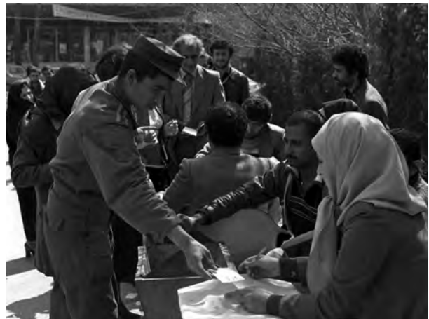
همه‌پرسی جمهوری اسلامی - ۱۰ و ۱۱ فروردین ۱۳۵۸