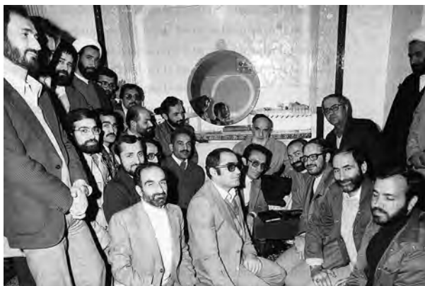
اعضای هیئت دولت شهید محمدعلی رجایی در دیدار با حضرت امام (ره)

با تدوین و تصویب قانون اساسی، زمینه برای برگزاری انتخابات ریاست جمهوری و مجلس شورای اسلامی و تشکیل دولت دائم فراهم آمد. ابتدا انتخابات ریاست جمهوری (بهمن ۱۳۵۸) انجام شد و ابوالحسن بنی‌صدر به عنوان نخستین رئیس جمهوری اسلامی ایران انتخاب گردید. با فاصله کوتاهی انتخابات مجلس شورای اسلامی نیز برگزار شد (اسفند ۱۳۵۸).