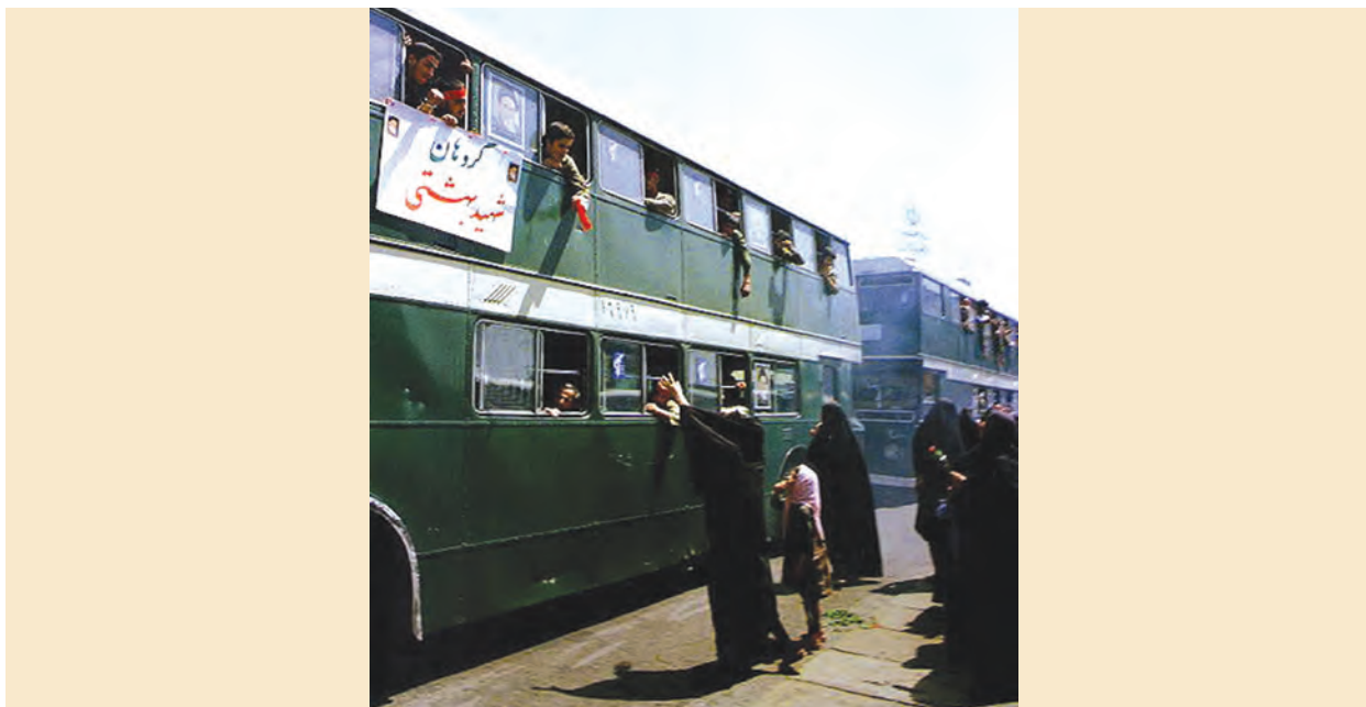
بدرقه رزمندگان اسلام توسط خانواده‌ها، تهران