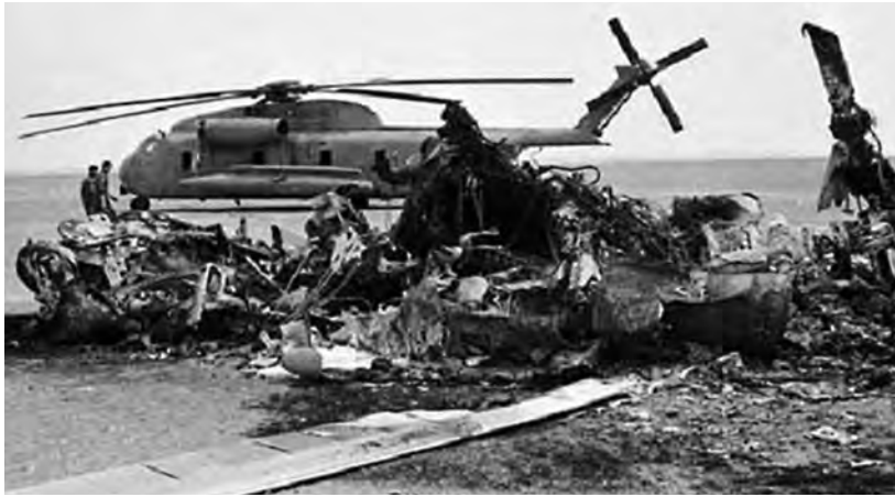
بقایای لاشه هواپیماها و بالگردهای آمریکایی در طبرس

پس از اینکه دانشجویان پیرو خط امام سفارت آمریکا در تهران را تسخیر و اعضای سفارت را بازداشت کردند، دولتمردان آمریکایی در شرایط دشواری قرار گرفتند. از این رو، آمریکا با طراحی یک عملیات پیچیده نظامی، اقدام به پیاده کردن نیروهای ویژه