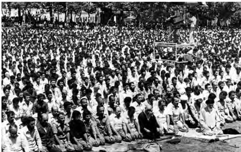
اقامه نخستین نماز جمعه تهران به امامت آیت الله طالقانی در دانشگاه تهران

کمی بعد از آن، جوانان شجاع و مبارز ایرانی سپاه پاسداران انقلاب اسلامی را به وجود آوردند تا از آرمان‌ها و دستاوردهای انقلاب پاسداری کند. جهاد سازندگی نیز برای عمران، آبادانی و رفع فقر و محرومیت از روستاها شکل گرفت. همچنین، کمیته امداد امام خمینی برای حمایت از محرومان و مستضعفان و نهضت سوادآموزی با هدف ترویج فرهنگ سوادآموزی و کاهش و