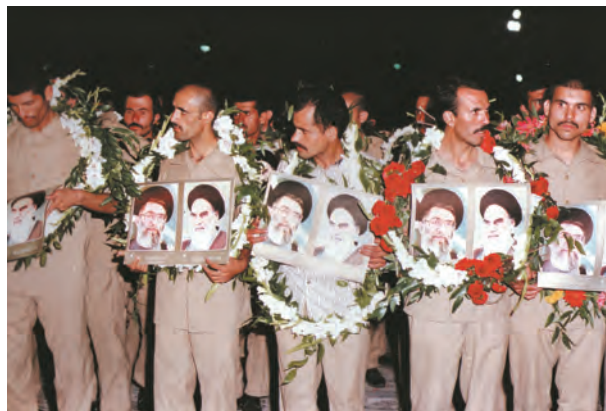
ورود گروهی از آزادگان به میهن عزیز

پس از دو سال مذاکره میان وزرای خارجه ایران و عراق، صدام در نامه‌ای به اکبر هاشمی رفسنجانی، رئیس جمهوری وقت ایران، قرارداد الجزایر را بار دیگر به رسمیت شناخت. پس از آن، آزادگان عزیز با استقبال گرم مردم ایران به آغوش میهن اسلامی بازگشتند.