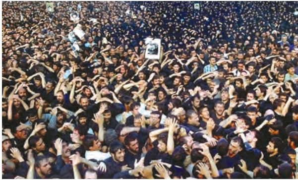
نمایی از تشییع جنازه میلیونی امام خمینی علیه السلام

حضرت آیت‌الله سید علی خامنه‌ای را به دلیل داشتن شرایط و ویژگی‌های مندرج در اصل یکصد و نهم قانون اساسی ۱ به مقام رهبری برگزید (۱۴ خرداد ۱۳۶۸).