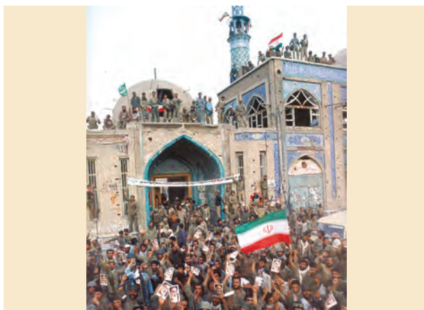
خرمشهر پس از آزادی سوم خرداد ۱۳۶۱

پس از آنکه بنی صدر از مقام فرماندهی کل قوا و ریاست جمهوری عزل شد و اوضاع سیاسی کشور ثبات و آرامش یافت، رزمندگان ایرانی با شجاعت و صلابت عزم خود را برای بیرون راندن دشمن متجاوز از خاک میهن عزیزمان جزم کردند. امام خمینی به عنوان فرمانده کل قوا، ابتدا فرمان شکستن محاصره آبادان را صادر کردند؛ به این ترتیب، نیروهای ارتشی به همراه رزمندگان سپاهی و بسیجی در عملیاتی برق آسا، آبادان را از محاصره نیروهای متجاوز صدام نجات دادند. دلاورمردان ایران زمین سپس در چندین رشته عملیات غرورآفرین که مهم‌ترین آنها فتح المبین ۲ و بیت المقدس بودند، صدها کیلومتر مربع از خاک ایران را از اشغال ارتش بعثی آزاد کردند. اوج حماسه دفاع مقدس ملت ایران در عملیات بیت المقدس (سوم خرداد ۱۳۶۱)، با رهایی خونین شهر (خرمشهر) از اسارت دشمن رقم خورد و در تاریخ به ثبت رسید؛ دشمنی که روی دیوارهای آن شهر نوشته بود: «ما آمده ایم بمانیم».