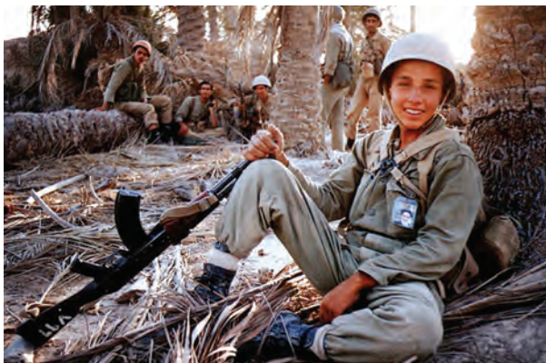
دانش‌آموز رزمنده در جبهه

معلمان و دانش‌آموزان نیز نقش چشمگیر و تأثیرگذاری در هشت سال دفاع مقدس داشتند. در آن سال‌ها جبهه‌های جنگ شاهد حضور صدها هزار دانش‌آموز و معلم ایرانی بود که برای دفاع از کیان نظام اسلامی و سرزمین مادری به جبهه رفتند و در سنگرها نیز از درس و مشق غافل نماندند. در طول دفاع مقدس حدود ۲۵۰۰ معلم و نزدیک به ۳۶۰۰۰ دانش‌آموز به شهادت رسیدند و هزاران نفر هم جانباز، اسیر و جاویدالایثار شدند.