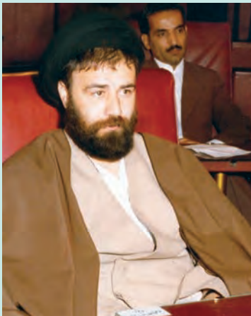
حاج سید احمد آقا خمینی

حجت‌الاسلام سید احمد خمینی در ۲۴ اسفند ۱۳۲۴ در قم به دنیا آمد. تحصیلات دوره ابتدایی و متوسطه را در زادگاه‌اش گذرانید و از دبیرستان حکیم نظامی قم در رشته طبیعی (علوم تجربی) دیپلم گرفت. هم‌زمان با تحصیل در دبیرستان، ورزش فوتبال را نیز با جدیت دنبال کرد. ایشان پس از اخذ دیپلم، تحصیلات حوزوی را پی گرفت. قیام ۱۵ خرداد ۱۳۴۲، علاقه‌اش به سیاست و عزمش را به مبارزه با حکومت پهلوی بیش از گذشته آشکار ساخت. حاج سید احمد آقا از سال ۱۳۴۳ و به دنبال دستگیری و تبعید رهبر نهضت اسلامی، امام خمینی، و برادر بزرگ‌اش، حاج آقا مصطفی خمینی، به ترکیه و سپس عراق، مسئولیت‌های سنگینی را در خانواده حضرت امام و نیز در عرصه مبارزه با حکومت ستم‌شاهی بر عهده گرفت. به همین دلیل ساواک