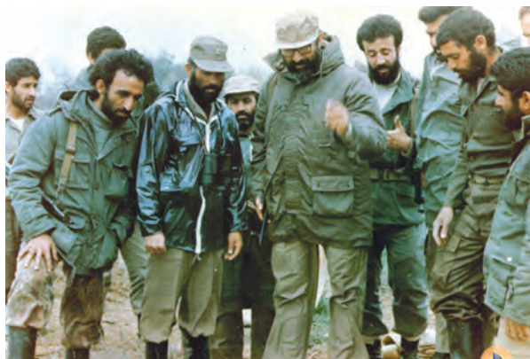
شهید مصطفی جمران به همراه جمعی از رزمندگان در جبهه