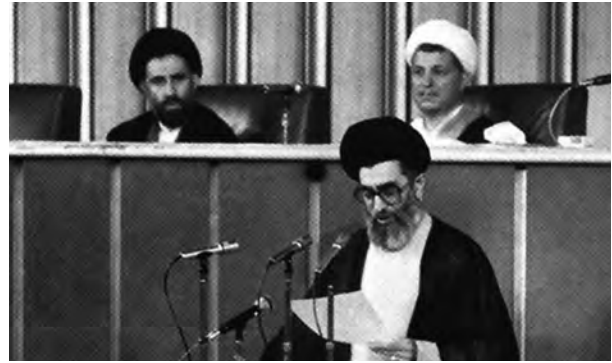
حضرت آیت‌الله خامنه‌ای هنگام خواندن وصیت‌نامه حضرت امام در مجلس خبرگان - ۱۴ خرداد ۱۳۶۸

حضرت آیت‌الله خامنه‌ای از ابتدای نهضت تا زمان پیروزی انقلاب اسلامی به عنوان شاگرد و پیرو حضرت امام خمینی (ره) حضور و نقش فعالی در مبارزه با رژیم پهلوی داشتند؛ از این رو، بارها دستگیر، زندانی و تبعید شدند. ایشان در دوران جمهوری اسلامی و در شرایطی که کشور گرفتار توطئه‌های پیچیده دشمنان خارجی و ضد انقلاب داخلی و نیز جنگ تحمیلی بود، همچون یاور بصیر و ثابت قدم در خدمت انقلاب و حضرت امام بودند و مسئولیت‌های خطیری را عهده‌دار شدند که از جمله آنها دو دوره ریاست جمهوری است. معظم له در تیر ۱۳۶۰، هدف حمله تروریستی مجاهدین خلق قرار گرفتند که به شدت جراحت برداشتند و به شرف جانبازی انقلاب اسلامی نایل آمدند.