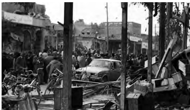
شهر مقاوم دزفول در دوران دفاع مقدس بارها هدف موشک و بمباران دشمن یعنی قرار گرفت.