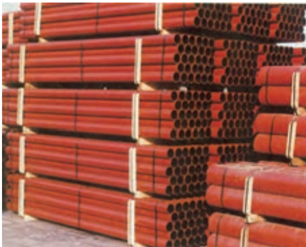
شکل ۱-۲- لوله ی چدنی بدون سرکاسه