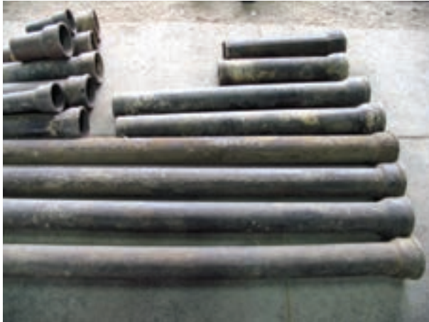
شکل ۱-۱- لوله ی چدنی سرکاسه دار