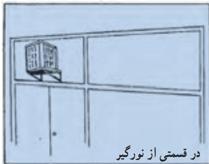
در قسمتی از نورگیر