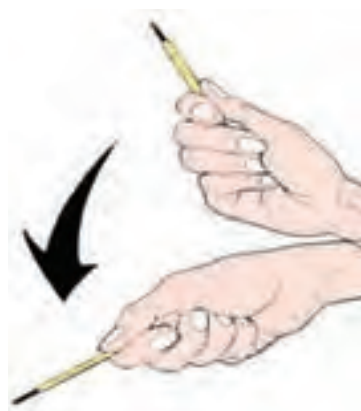
نحوه‌ی استفاده از دماسنج

۴- دماسنج را در سطح افقی نگه داشته و آن را بخوانید. (دماسنج را بین انگشتان خود بچرخانید تا خط جیوه‌ی آن دقیقاً دیده شود)