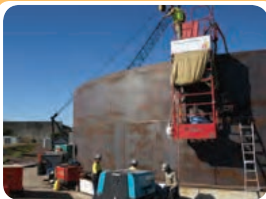
م) کارگاه ساخت مخازن ذخیره

نمونه ای از کارگاه‌های جوشکاری تجهیز شده برای ساخت سازه‌های صنعتی