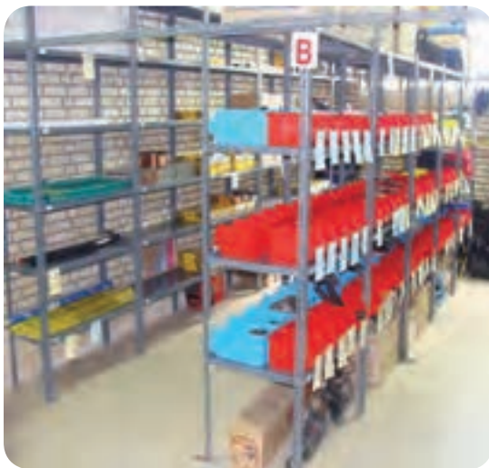
انبار مواد مصرفی جوشکاری