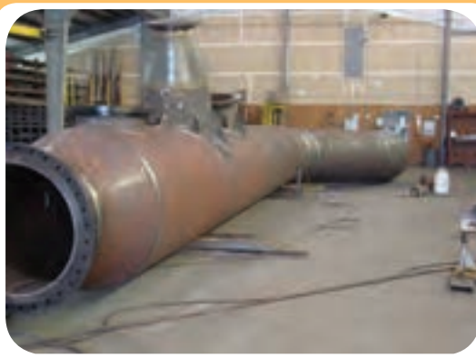
ج) کارگاه ساخت تجهیزات صنعتی