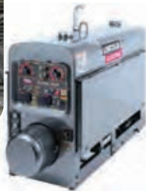
ج) دستگاه‌های جوشکاری نظیر: رکتیفایر، ترانس، دینام و موتور جوش ادامه- برخی از دستگاه‌های موجود در کارگاه‌های جوشکاری