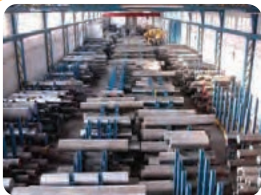
الف) انبار ذخیره لوله و پروفیل‌های گرد فولادی