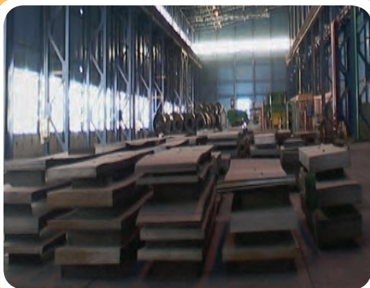
ج) انبار نگه‌داری انواع ورق فولادی