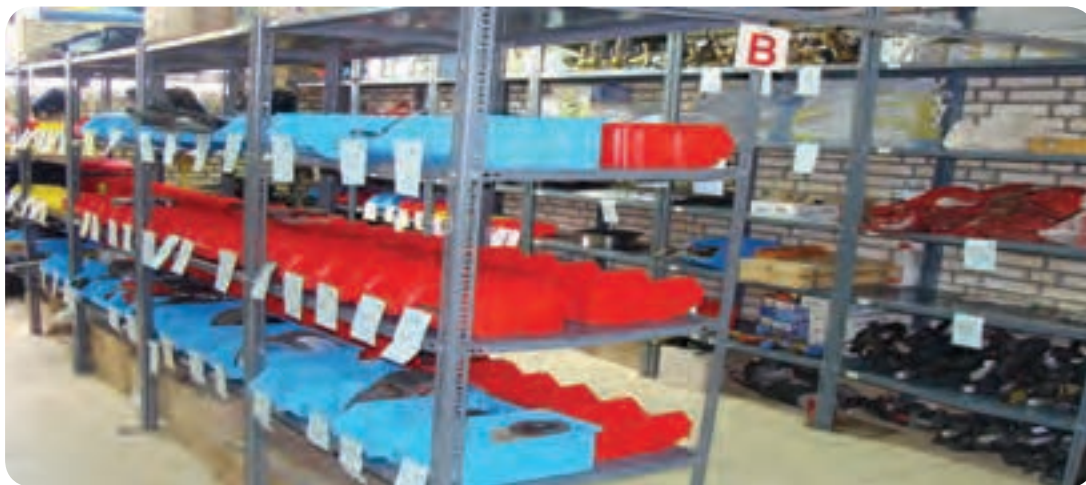
انبار ابزار و لوازم یدکی