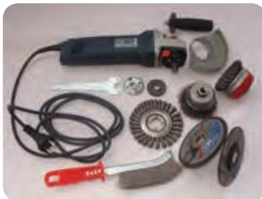
ب) دستگاه‌های آماده سازی و ماشین‌کاری نظیر: تراش، فرز، دریل، سنگ‌زنی، پرس کاری و پخ کاری