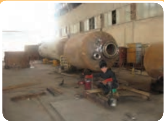
ب) کارگاه ساخت مخازن تحت فشار