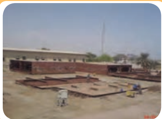
د) کارگاه ساخت اسکلت فلزی ساختمان