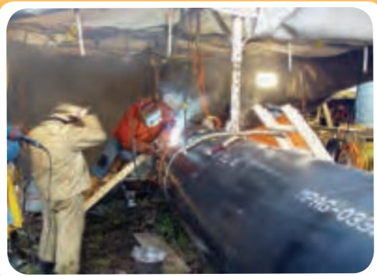
ن) کارگاه ساخت خط لوله