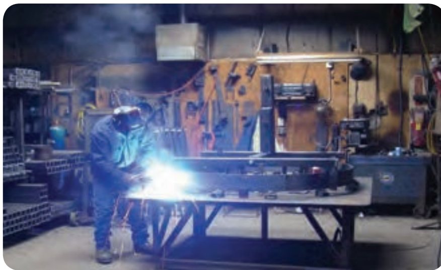
بخشی از فضای داخل کارگاه جوشکاری ساخت

فضای کارگاه جوشکاری به طور معمول سرپوشیده است ولی گاهی به دلیل شرایط اجرایی مثل: مشکل حمل و نقل سازه‌های بزرگ صنعتی بخشی از فعالیت‌های جوشکاری و یا تمام آن در محل نصب سازه‌ها (سایت) صورت می‌پذیرد.