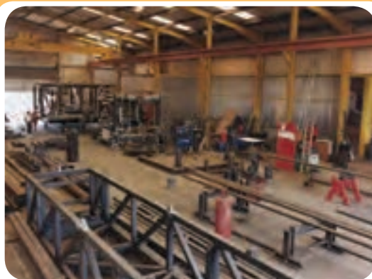
الف) کارگاه ساخت سازه‌های ساختمانی