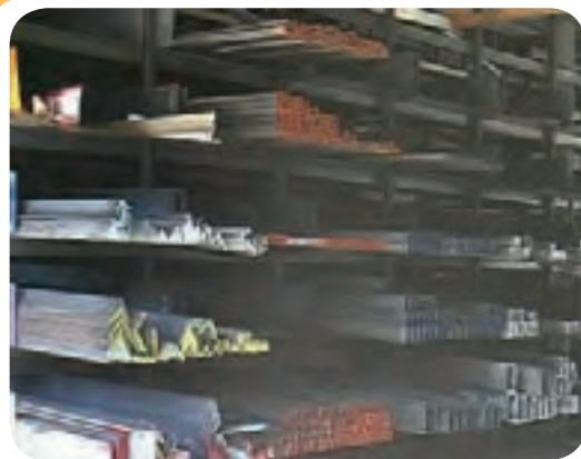
ب) انبار ذخیره انواع پروفیل فولادی