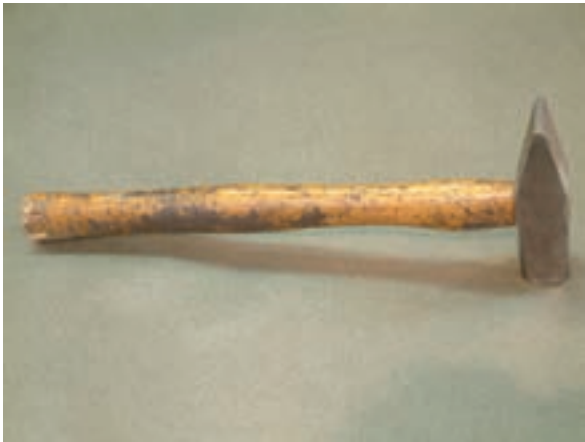
شکل ۹-۱- چکش فلزی

از چکش های پلاستیکی، بیش تر در جمع کردن قطعات موتور یا کوبیدن سیم پیچ های استاتور استفاده می شود؛ به عبارت دیگر می توان گفت در ضربه های ظریف از چکش های پلاستیکی استفاده می شود (شکل ۸-۱).