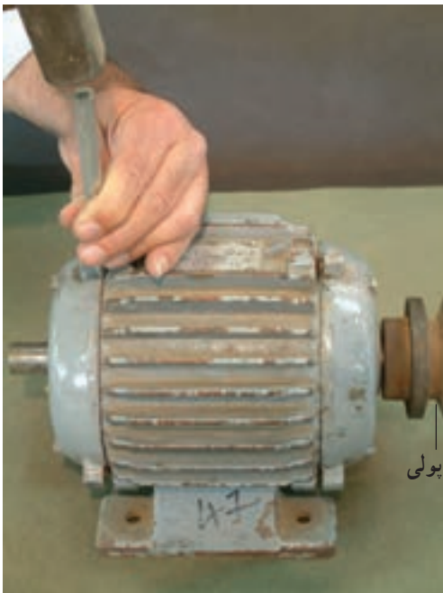
شکل ۱۰-۱- استفاده از چکش فلزی برای علامت گذاری در باز کردن قطعات موتور

درپوش ها از چکش های فلزی استفاده می شود (شکل های ۹-۱ و ۱۰-۱)