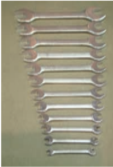
شکل ۱-۵- آچارهای تخت

۱-۲-۱- انواع آچار: برای باز کردن و سوار کردن اجزای موتورهای الکتریکی اغلب از آچارهای تخت، آچار بوکس و آچار رینگ استفاده می‌شود. از آچارهای تخت برای باز و بسته کردن پیچ و مهره‌هایی که در سطح کار قرار دارند و فضای کافی برای گردش دسته آچار موجود باشد استفاده می‌شود (شکل ۱-۵).