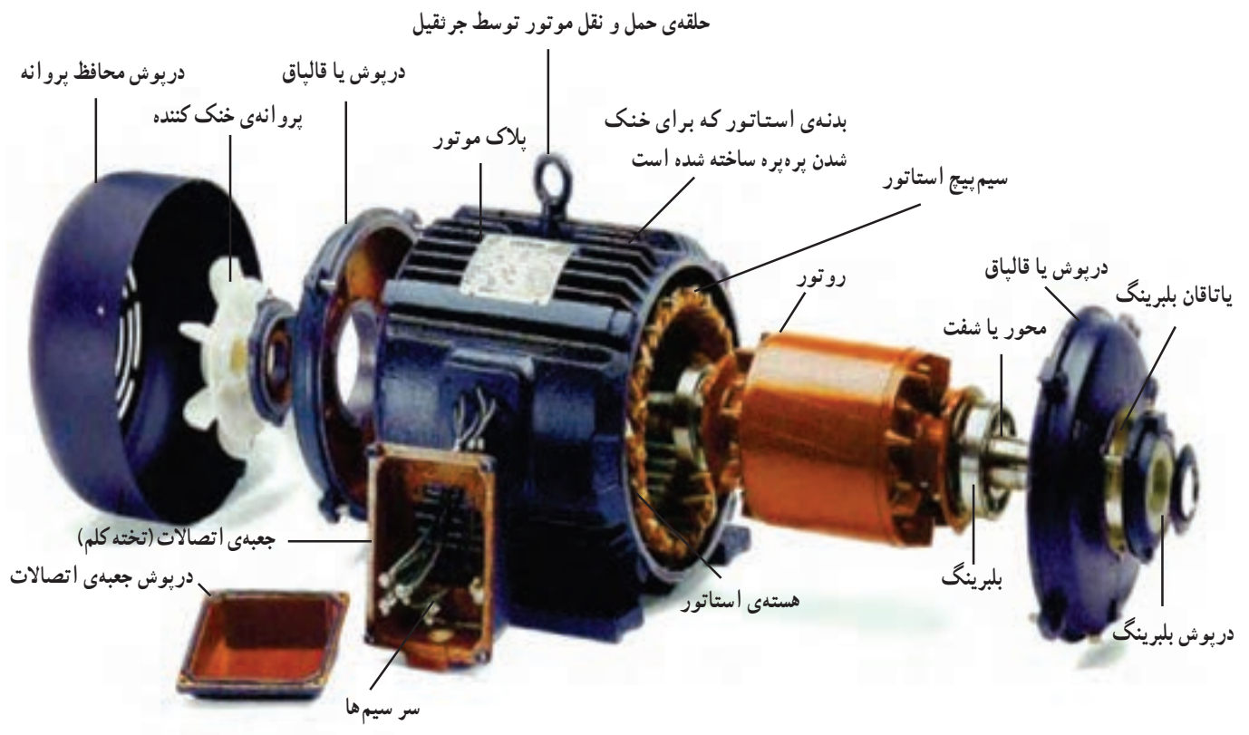
شکل ۱-۳- اجزای اصلی موتور سه فاز

یک الکتروموتور سه فاز از قسمت های مختلفی تشکیل شده است. این قسمت ها در شکل ۱-۳ نشان داده شده اند.