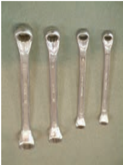
شکل ۱-۶- آچار رینگ

در مواقعی که پیچ یا مهره در سطح کار دستگاہ نباشد و نسبت به سطح، عمق کمی داشته باشد به گونه‌ای که فک‌های آچارهای تخت نتوانند پیچ یا مهره را بگیرند از آچارهای رینگ استفاده می‌شود. آچارهای رینگ، نظیر آچارهای تخت، به فضای کافی جهت گردش دسته‌ی خود نیاز دارند (شکل ۱-۶).