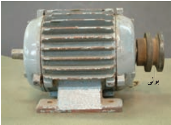
شکل ۱-۱ - موتور سه فاز کامل

۱-۱- آشنایی با قطعات اصلی الکتروموتورها موتورهای جریان متناوب به صورت موتورهای تک فاز و سه فاز ساخته می شوند. موتورهای تک فاز اغلب مصارف خانگی دارند و معمولاً در توان های کم تر از یک اسب بخار ساخته می شوند، ولی موتورهای سه فاز بیش تر کاربرد صنعتی دارند و در توان های کم تا چند صد کیلووات ساخته می شوند (شکل ۱-۱). ساختمان داخلی موتورهای تک فاز و سه فاز تقریباً یکسان است. با این تفاوت که در موتورهای تک فاز گاهی از کلید گریز از مرکز استفاده می شود که در موتورهای سه فاز کاربرد ندارد.