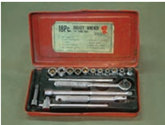
شکل ۱-۷- آچار بوکس

در بعضی مواقع، پیچ و مهره‌ها در عمق زیادتری قطع‌ات داخلی را به هم دیگر ارتباط می‌دهند لذا آچارهای تخت و رینگ قادر به باز و بسته کردن پیچ و مهره‌ها نخواهند بود که در این صورت از آچار بوکس استفاده می‌شود (شکل ۱-۷).