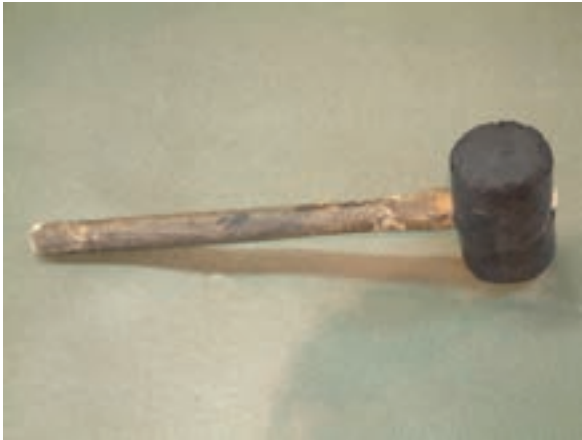
شکل ۸-۱- چکش پلاستیکی