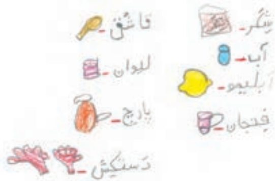
شربت آبلیمو (۱)