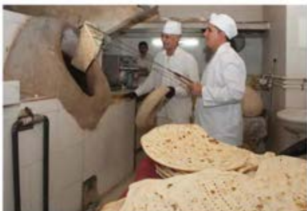
استان اصفهان - میمه