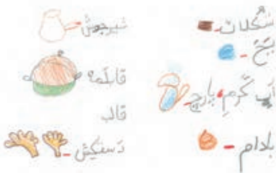
شکلات آجیلی (۲)