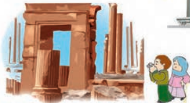
اینجا، تخت جمشید در مَرودشت فارس است.