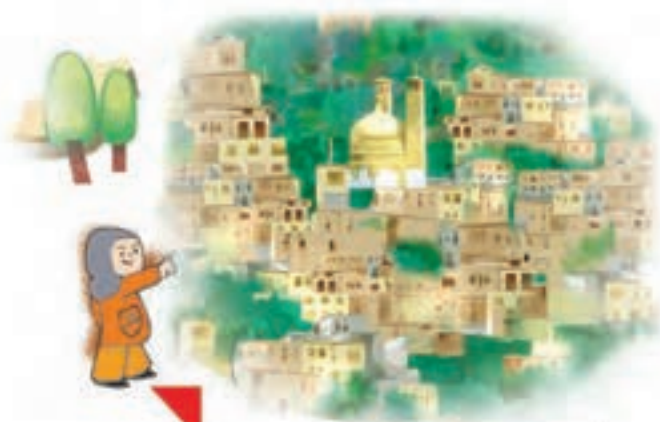
اینجا، ماسوله‌ی گیلان است.