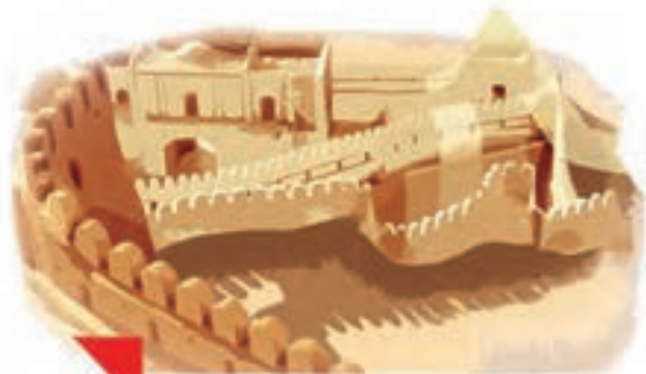
اینجا، آرگِ بَمِ کرمان است.