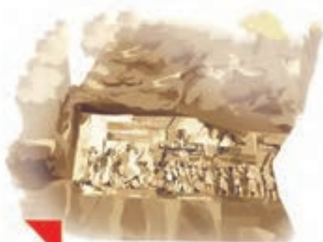
این، تصویری از بیستونِ کرمانشاه است.