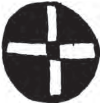
نمونه‌ای از شکل دایره روی سفالینه پیش از تاریخ

دایره شکلی کامل است که حرکت جاودانه و مداومی را نشان می دهد. همه‌ی نقاط روی خط پیرامون دایره با مرکز آن در یک فاصله قرار دارند و قطره‌های آن با هم برابرند. دایره نماد نرمی، لطافت، تکرار، درون گرایی، آرامش روحانی و آسمانی و بی انتهای است.