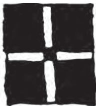
نمونه‌ی استفاده شده شکل مربع روی سفالینه‌ی پیش از تاریخ

مربع یکی دیگر از شکل‌های پایه‌ی هندسی است که از چهار ضلع و چهار زاویه‌ی مساوی ساخته می شود. مربع نماد صلابت، استحکام و سکون است. این شکل همچنین نماد عقل، منطق، صراحت و صداقت و معرف زمین است.