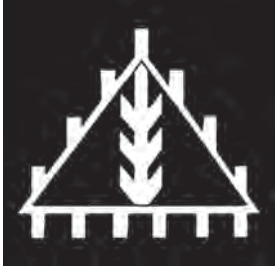
نمونه‌ی استفاده شده‌ی نقش مهر، هزاره‌ی سوم ق.م، شوش

پایدارترین شکل هندسی مثلث است. (خصوصاً مثلث متساوی الاضلاعی که بر سطح قاعده‌اش قرار گرفته باشد) اما چنانچه این مثلث بر یکی از راس‌های خود قرار بگیرد حالتی کاملاً متزلزل و ناپایدار دارد. مثلث به واسطهٔ زوایای تندی که دارد سطحی مهاجم و ستیزنده به نظر می‌رسد که همواره در حال تحول و پویایی است. راس تیز این شکل نیز نمادی از اشعه‌ی خورشید است.