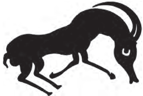
نقش روی ظرف سیلک کاشان