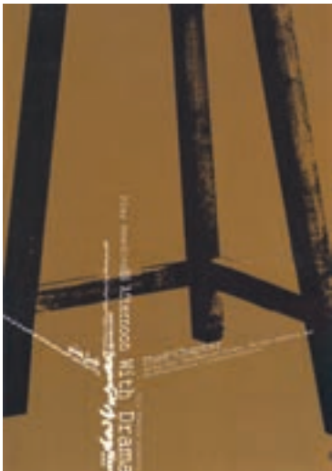
نمونه‌ی استفاده از ترکیب‌بندی مثلثی در یک پوستر (راس مثلث خارج از کادر واقع شده است.)

آثاری که دارای ترکیب‌بندی مثلثی هستند، عموماً از استحکامی استثنایی برخوردارند. هنرمندان رشته‌های مختلف هنری در بسیاری از موارد از استحکام و ساختار منسجم مثلث، برای ترکیب‌بندی سود برده و کیفیت آن‌را با نیاز تصویر مورد نظر خود منطبق کرده‌اند.