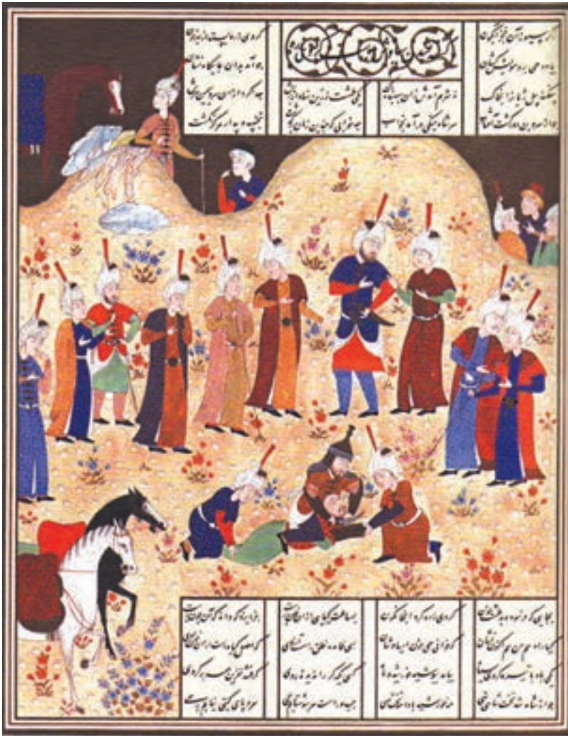
کشته شدن سیاوش، شاهنامه بایسنغری

۶. عامل مفروض: عنصر پر قدرتی که سایر عوامل موجود در کادر را در اطراف خودش سازماندهی می کند. برای آشنایی بیش تر با اصول نظام دهنده، به بررسی آن ها در اثر زیر می پردازیم: تصویر زیر صحنه ی کشته شدن سیاوش، از نگاره های شاهنامه ی بایسنغری است که اصول نظام دهنده ی آن عبارتند از: