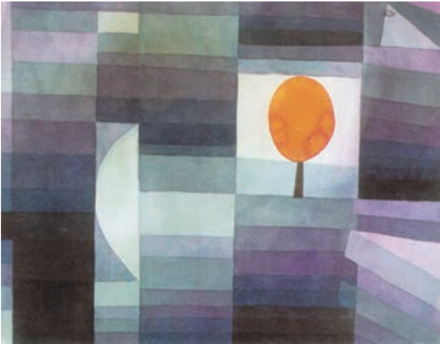
ترکیب غیر قرینه در تابلوی پیام آور پاییز اثر پل کله

در ترکیب غیر قرینه عناصر موجود در تصویر بر اساس ارزش‌های بصری خودشان مثل رنگ، تیرگی، روشنی، بافت و... در کادر قرار می‌گیرند نه بر اساس محورهای عمودی، افقی و مورب کادر.