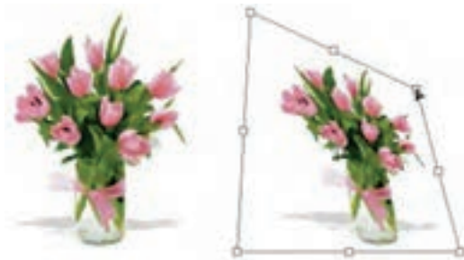
شکل ۱۸-۸ کج کردن تصویر (Skew)