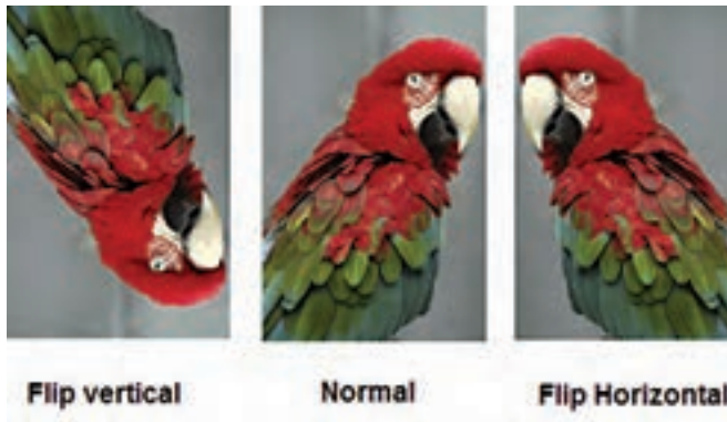
شکل ۱۲-۱۸ قرینه کردن تصویر

با استفاده از این گزینه در بخش Transform می توان محدوده انتخاب شده تصویر را قرینه کرد. در حقیقت این گزینه می تواند در دو جهت افقی (Horizontal) و عمودی (Vertical) عمل قرینه کردن را انجام دهد. یکی از کاربردهای ویژه دستور Flip را می توان در آینه کردن تصاویر یا قرینه کردن آن ها دانست. (شکل ۱۲-۱۸)