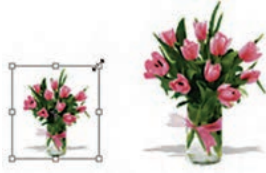
شکل ۶-۱۸ تغییر اندازه (Scale)

با اجرای دستور Scale در اطراف بخش انتخاب شده محدوده‌ای ایجاد می‌شود که دارای دستگیره‌های مختلفی برای تغییر اندازه در جهت‌های مختلف است و شما می‌توانید با پایین نگه داشتن کلید Shift و کشیدن یکی از گوشه‌های آن به‌طور متناسب بخش انتخاب شده را تغییر مقیاس دهید. برای اعمال تغییرات از کلید Enter یا دابل کلیک در داخل محدوده مورد نظر استفاده کنید. (شکل ۶-۱۸)