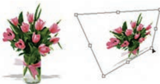
شکل ۱۸-۹ به هم ریختن تصویر

با استفاده از این دستور در Photoshop می‌توان عملی مشابه دستور Skew را انجام داد ضمن این که تا حدودی این دستور عمل تغییر مقیاس یا اندازه را نیز انجام می‌دهد. با این تفاوت که در این جا وقتی کادر مورد نظر در اطراف تصویر مورد نظر ایجاد می‌شود هنگامی که اقدام به کشیدن دستگیره‌های موجود می‌کنید این امکان به شما داده می‌شود که آن را به طرف گوشه مقابل نیز جابجا کنید. به طور کلی از این دستور برای به هم ریختن فرم اصلی یک تصویر و افقی کردن در جهات مختلف استفاده می‌شود. (شکل ۱۸-۹)