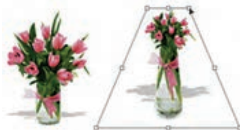
شکل ۱۸-۱۰ پرسپکتیو به تصویر

به کمک این دستور می‌توان بخش انتخاب شده یا کل یک تصویر را دارای عمق و زاویه دید مشخصی کرد. این گزینه یکی از مفیدترین و کاربردی‌ترین دستوره‌های بخش Transform است، به طوری که با اجرای آن و با ایجاد کادر انتخاب مورد نظر در اطراف تصویر کاربر می‌تواند با استفاده از دستگیره‌های موجود در این کادر به تصویر خود عمق و زاویه خاص بدهد. ضمن این که در این دستور با تغییر دادن یک گوشه و جابه‌جا کردن آن، گوشه مقابل آن نیز متناسب با این گوشه تغییر خواهد کرد. این تفاوت اصلی‌ترین تفاوت این دستور با دستور Distort می‌باشد. (شکل ۱۸-۱۰)