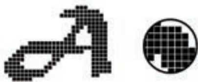
شکل ۱-۱۸ وضعیت پیکسل‌ها هنگام بزرگ کردن تصاویر پیکسلی

از آن جایی که تصاویر با درجه رنگی پیوسته از قبیل عکس‌ها یا نقاشی‌های دیجیتالی از سایه‌روشن‌هایی درجه‌بندی شده تشکیل شده‌اند که یک محدوده رنگی مشخص را نشان می‌دهند تصاویر Bitmap یکی از بهترین نوع تصاویری هستند که می‌توانند این گونه عکس‌ها را نمایش دهند. به همین دلیل نرم‌افزارهای پیکسلی مانند فتوشاپ برای ویرایش تصاویر مورد استفاده قرار می‌گیرد. (شکل ۱-۱۸)