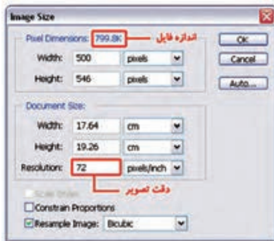
شکل ۳-۱۸ تغییر دقت تصویر و رابطه آن با حجم فایل

برای این که مشاهده کنید تفاوت Resolution تصویر که ما به آن دقت تصویر می‌گوییم چه تأثیری بر حجم فایل دارد به مثال زیر توجه کنید: (شکل ۳-۱۸)