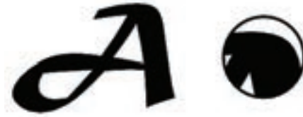
شکل ۲-۱۸ وضعیت پیکسل‌ها هنگام بزرگ کردن تصاویر برداری

شود هیچ گونه تأثیری بر کیفیت آن‌ها نخواهد داشت. (شکل ۲-۱۸) اما مهم‌ترین عیب این گونه نرم‌افزارهای گرافیکی آن است که برای ویرایش تصاویر با درجه رنگی پیوسته مناسب نمی‌باشند.