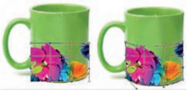
شکل ۱۱-۱۸ دستور Warp

از ویژگی های این شبکه تور مانند، قابلیت انعطاف آن علاوه بر محور X و Y در جهت محور Z می باشد. همین قابلیت باعث ایجاد حجم و تغییرات سه بعدی در ساختار تصویر می گردد.