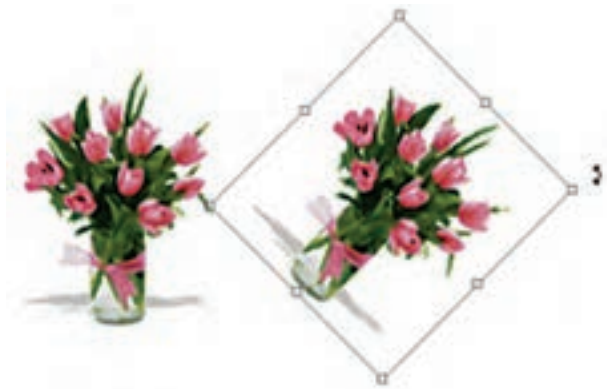
شکل ۷-۱۸ چرخاندن تصویر (Rotate)

برای این منظور در بخش دستوره‌های Transform گزینه‌ای به نام Rotate قرار داده شده است که با استفاده از آن می‌توانید کل تصویر یا بخش‌هایی از آن را با زاویه‌های مختلف و در جهت‌های مختلف چرخش دهید. برای این منظور متناسب با نیاز خود یکی از گزینه‌های ۱۸۰ Rotate (چرخاندن به اندازه ۱۸۰ درجه)، ۹۰ CW (چرخاندن به اندازه ۹۰ درجه در جهت عقربه‌های ساعت)، ۹۰ CCW (چرخاندن به اندازه ۹۰ درجه در خلاف جهت عقربه‌های ساعت) را اجرا کنید. (شکل ۷-۱۸)