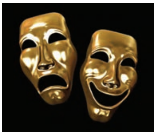
شکل ۲- ارتباط غیرکلامی

ارتباط بین انسان‌ها همیشه در گفتار و حرف زدن خلاصه نمی‌شود. ارتباط هم می‌تواند با کلام و زبان گفتار باشد و هم با نشانه‌های غیرکلامی و به اصطلاح زبان بدن. بنابراین به صورت یک اشاره یا تغییر حالت چهره و بدن، می‌توان پیامی را انتقال داد. ارتباط غیرکلامی به وسیله زبان بدن دامنه وسیعی دارد. از بیان چهره‌ای، اشاره و ادای احترام با حرکت ساده تئاتر، موسیقی و نمایش بی کلام از جمله ارتباطات غیرکلامی است. (شکل ۲).