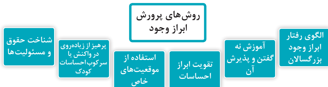
نمودار ۳- روش‌های پرورش ابراز وجود

روش‌های پرورش ابراز وجود در نمودار ۳ نشان داده شده است.