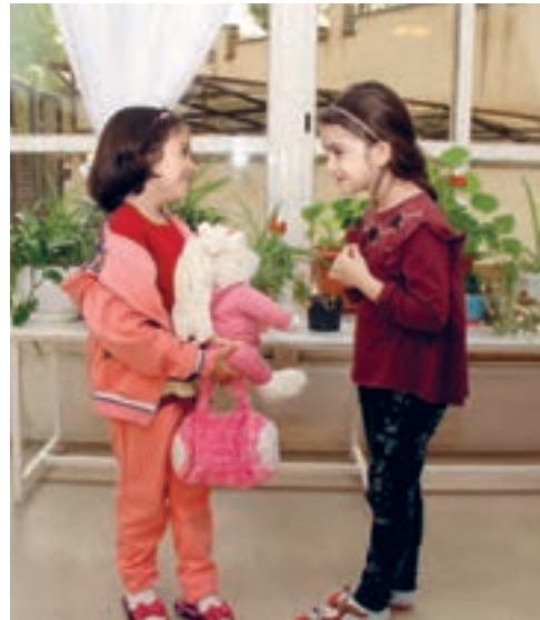
شکل ۸ - بخشش