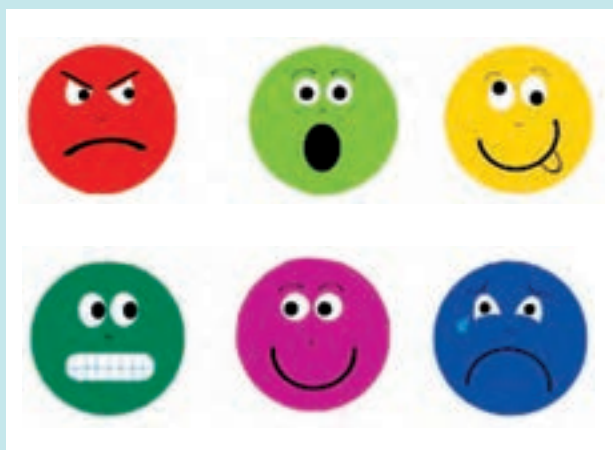
شکل ۴- هیجانات