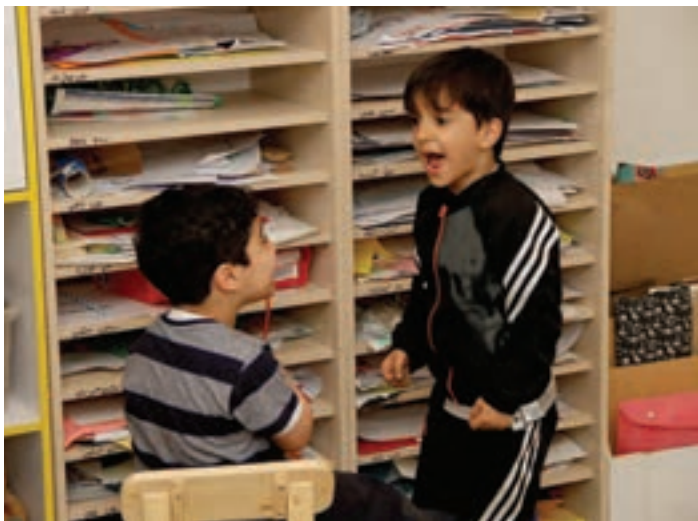
شکل ۳- اعتراض کودک

یکی از اهداف مهم در پرورش کودک، کمک به رشد مهارت درک احساسات دیگران است، به شکلی که او بتواند به دیگران احترام بگذارد و در تعامل با دیگران، همدلی کند. اما در بسیاری موارد، تأکید زیاد بر این موضوع که کودک به خواسته و احساسات دیگران توجه کند ممکن است تأثیر معکوس داشته باشد. هنگامی که کودک حس کند خواسته‌ها و احساسات دیگران مهم است، ولی خواسته‌ها و احساسات خودش اهمیتی ندارد و به آن توجه نمی‌شود، ممکن است در او احساس بدبینی و گاه تنفر یا حسادت شکل بگیرد. تصور کنید مربی تعداد محدودی وسیله بازی در اختیار کودکان ۳ تا ۵ ساله قرار داده است. کودکی مدت طولانی با یکی از وسیله‌ها مشغول بازی است و آن را در اختیار کودک دیگری که کنارش نشسته است، قرار نمی‌دهد. در این شرایط، ممکن است مربی به کودک بگوید: «کمی هم اجازه بده دوستت مشغول بازی باشد». ممکن است کودک در حین بازی دوستش را کتک زده باشد. مربی با مشاهده چنین صحنه‌ای معمولاً می‌گوید: «تو حق نداری دوستت را کتک بزنی، او ناراحت می‌شود و دیگر دوستت نمی‌ماند» یا: «حالا باید از او عذرخواهی کنی». در چنین موقعیت‌هایی، مربی تصور می‌کند احترام گذاشتن به دوست را به او آموزش داده است، ولی این نوع مواجهه عموماً می‌تواند به ناراحتی کودک منجر شود؛ به‌ویژه در مواقعی که کودک بازی با آن وسیله یا ابراز یک رفتار را حق خودش بداند.