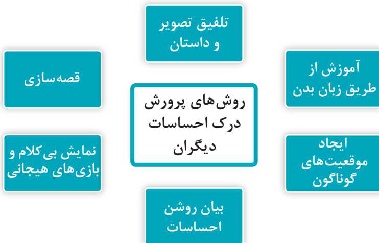
نمودار ۱- روش‌های پرورش درک احساسات دیگران

روش‌های پرورش درک احساسات دیگران در نمودار ۱ نشان داده شده است.