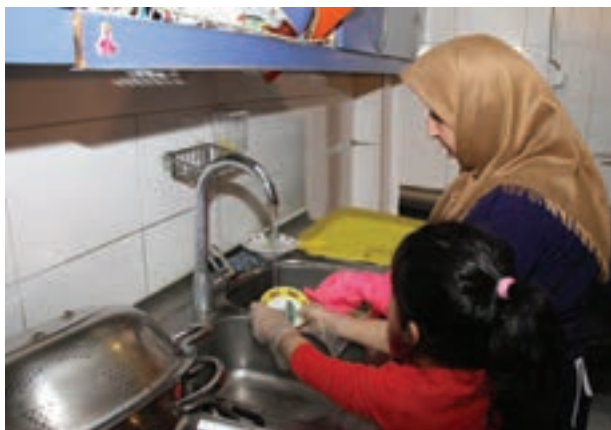
شکل ۵- کمک به دیگران و رفتار نوع دوستانه در کودکان

فعالیت ۱۱: در گروه‌های کلاسی در مورد تصویر بالا و احساس کودکان گفت‌وگو کنید و نتیجه را در کلاس ارائه دهید.