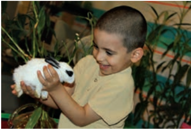
شکل ۷ - مهربانی

کودک در میان بگذارید و تجربه‌های او را بشنوید. تجربه‌های احتمالی خود در این باره را نیز (مثلاً دادن صندلی خود به یک فرد ناتوان در اتوبوس) در میان بگذارید (شکل ۷).