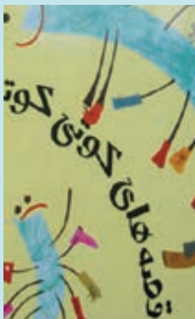
شکل ۶- قصه های کوتی کوتی

فعالیت ۱۸: داستان زیر را بخوانید و به پرسش‌های مطرح شده پاسخ دهید.