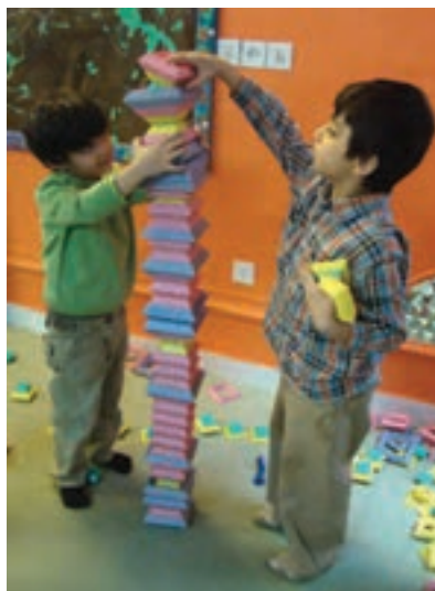
شکل ۱- ارتباط کودکان

فعالیت ۱: در گروه‌های کلاسی، با توجه به تصاویر بالا، در مورد احساس و ارتباط بین کودکان گفت‌وگو کنید و نتیجه را در کلاس ارائه دهید.