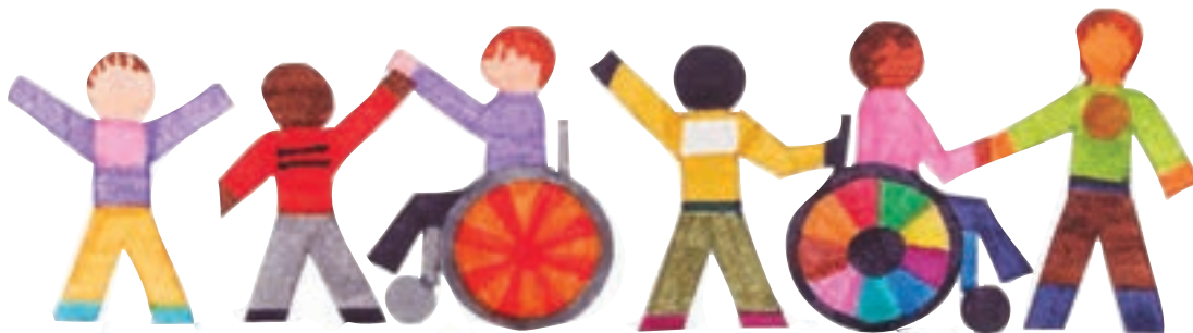
شکل ۴- بازی با کودکان دارای نیازهای ویژه

انواع بازی با کودکان دارای نیازهای ویژه شامل موارد زیر است (نمودار ۴):