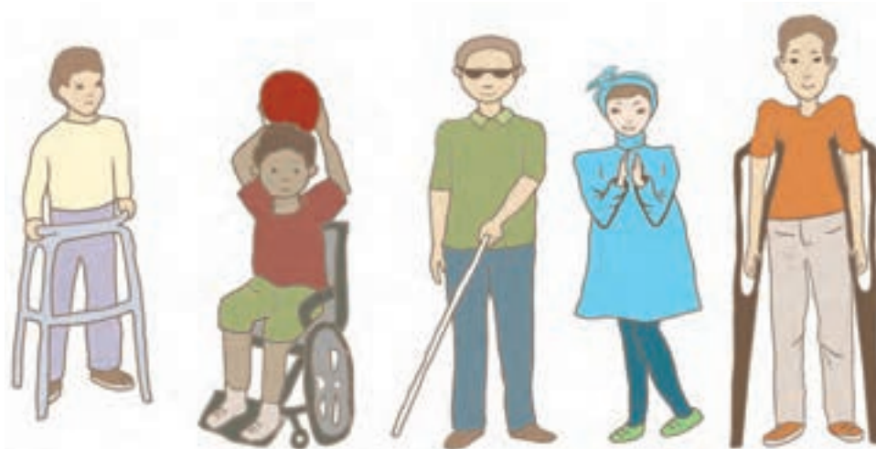
شکل ۳- کودکان دارای نیاز ویژه

هرگونه محدودیت یا فقدان در توانایی اجرای فعالیت‌هایی که در سطح طبیعی از هر کودکی انتظار می‌رود، بیانگر آن است که کودک دارای نیازهای ویژه است. البته منظور تنها مشکلات جسمانی این کودکان نیست، بلکه مشکلات ذهنی آنها به مراتب بیشتر است.