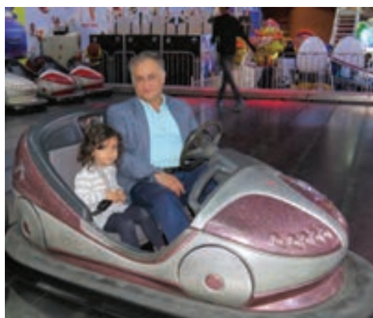
شکل ۲- انواع ارتباط کودک