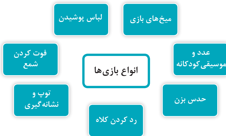
نمودار ۴- انواع بازی جهت ارتباط با کودکان دارای نیازهای ویژه

انواع بازی با کودکان دارای نیازهای ویژه شامل موارد زیر است (نمودار ۴):