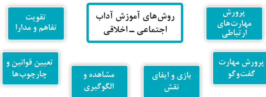
نمودار ۲- روش‌های آموزش آداب اجتماعی - اخلاقی

برای پرورش آگاهی‌های کودک از فرهنگ جامعه و تقویت آداب اجتماعی - اخلاقی، روش‌هایی را می‌توان پیشنهاد کرد که در ادامه به چند روش اشاره می‌شود (نمودار ۲).