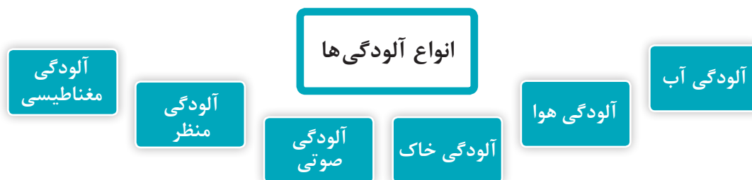
نمودار ۵- انواع آلودگی های محیط زیست

انواع آلودگی های محیط زیست در نمودار ۵ نشان داده شده است.