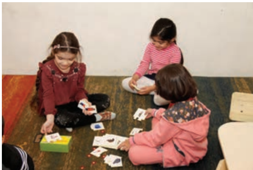
شکل ۳- بازی های گروهی

فعالیت ۷: با هم گروه های خود فهرستی از بازی های کودکانه مبتنی بر همدلی و مشارکت تهیه و یکی از آنها را در کلاس اجرا کنید. برای مثال، با درست کردن کاردستی به کمک کودک می توان، انواع آداب اجتماعی را به او آموزش داد؛ یا با مقوا یک چراغ راهنمایی و چند تابلوی راهنمایی رانندگی، درست کرد. با استفاده از چند ماشین کوچک، بازی رعایت قانون و مقررات و رعایت حق دیگران را نیز می توان به او یاد داد. این فعالیت را می توانید با کودکان انجام دهید.