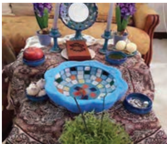
شکل ۱- آداب و رسوم

فعالیت ۱: با توجه به تصاویر بالا راجع به سؤالات زیر در گروه‌های خود گفت‌وگو کنید و نتیجه را در کلاس ارائه دهید.