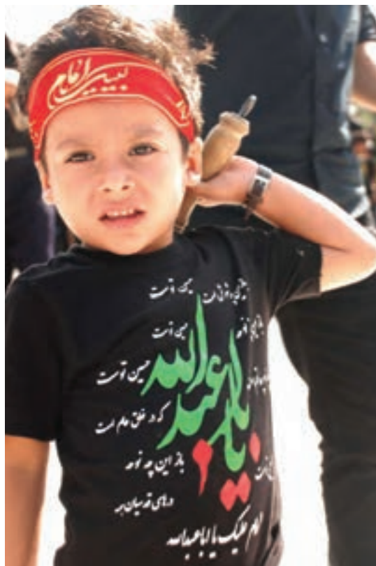
شکل ۵- حضور کودک در مناسبت‌های دینی و ملی