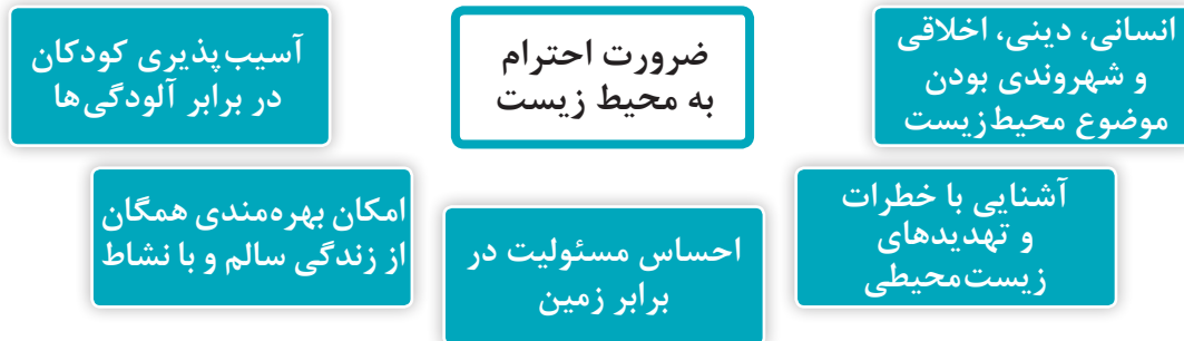
نمودار ۴- ضرورت های احترام به محیط زیست

بیشتر صاحب نظران اعتقاد دارند که در مورد اهمیت و ضرورت احترام به محیط زیست باید به نقش کودکان بیشتر توجه کرد و آگاهی آنها را با مسائل محیط زیست افزایش داد. ضرورت های احترام به محیط زیست در نمودار ۴ نشان داده می شود: