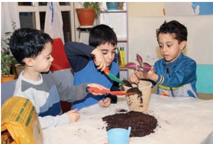
شکل ۶- همکاری کودک در نگهداری از محیط زیست

محیط زیست شامل مجموعه‌ای از عواملی است که انسان را احاطه کرده‌اند، (مانند آب، هوا، خاک، منابع طبیعی، گیاهان، حیوانات و اتمسفر) و بر زندگی ما تأثیر متقابل دارند. به موضوع محیط زیست، پژوهشگرانی از رشته‌های مختلف مانند: منابع طبیعی، کشاورزی، هواشناسی، زمین‌شناسی، زیست‌شناسی، حیات وحش، برنامه‌ریزی شهری، بهداشت، اقتصاد، حقوق و... توجه دارند و برای نگهداری آن اقدامات مختلفی را انجام می‌دهند. کره زمین در معرض انواع خطرهای تهدیدهای زیست‌محیطی قرار دارد و لازم است مسئله احترام به محیط زیست و حفظ و نگهداری از آن، از سنین کودکی آموزش داده شود (شکل ۶).