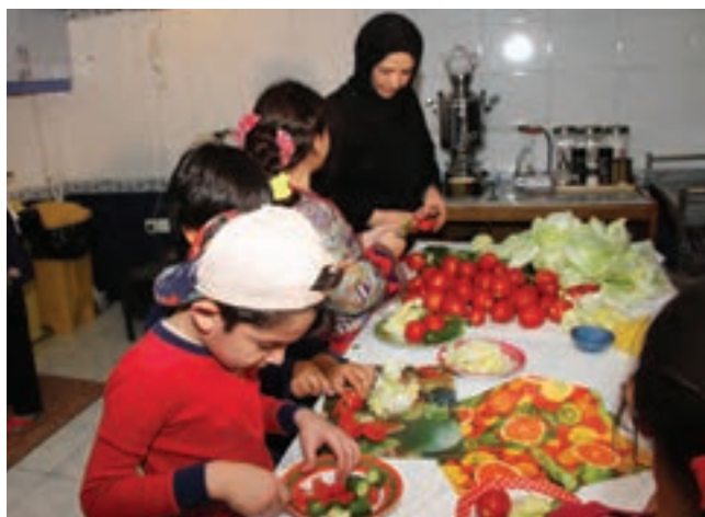
شکل ۴- همکاری و مشارکت کودک در انجام فعالیت‌های روزمره

کودک ممکن است در رفتارهای اجتماعی خود اشتباهاتی داشته باشد، مثلاً اسباب‌بازی‌ها را فقط برای خود بخواهد، زور بگوید، دعوا کند یا حرف‌های نامناسب بزند. در این گونه موارد، رفتار اصلاحی والدین و مربیان بسیار اهمیت دارد. رفتارهای همراه با عصبانیت، پرخاش، تحقیر و تنبیه نمی‌تواند در بهبود وضعیت تأثیر چندانی داشته باشد ۱ . بنابراین، خطاهای کودکان در رفتارهای اجتماعی و اخلاقی را با حوصله، ملایمت و صمیمانه تذکر دهید و از روش‌های تغییر رفتار استفاده کنید.