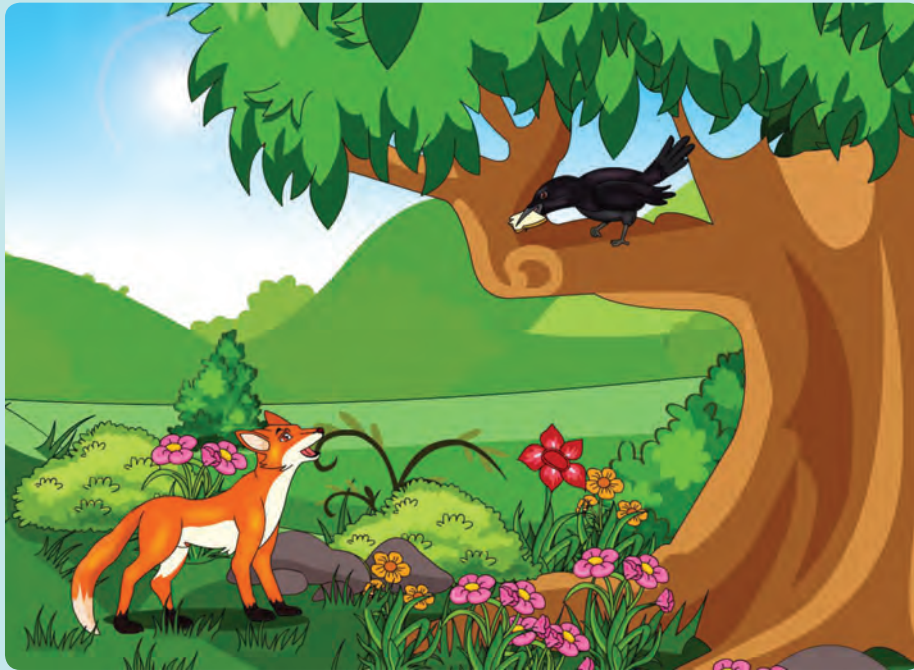
شکل ۳- قصه زاغک و روباه

فعالیت ۲: همه قصهٔ پند آموز ۱ زاغک و روباه را شنیده یا خوانده اید. جملات روباه تحسین بود یا تشویق؟ در این مورد گفت و گو کنید.