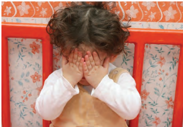
شکل ۱۰- کودک خجالتی

به یاد داشته باشید که این گروه کودکان خود را بی‌دفاع نشان می‌دهند و دوست دارند دیگران به آنها کمک کنند و این حالت مرتب بیشتر و بیشتر می‌شود و چنانچه از این طریق نتوانند رضایت خاطر به دست آورند، مأیوس می‌شوند و روش غیر مفید دیگری را انتخاب می‌کنند. با توجه به عزت نفس ۱ بسیار ضعیفی که این کودکان دارند، احساس می‌کنند با این روش، خود را در پس این ناتوانی‌ها بیشتر پنهان کنند و مورد ارزیابی نیز قرار نگیرند. طبیعی است که او به ندرت در فعالیت سایر کودکان شرکت می‌کند، ضمن اینکه دیگران نیز درخواستی از آنها نخواهند کرد. اغلب این کودکان بسیار توانا هستند، اما نقش یک ابله یا ناتوان را بر دیگر نقش‌ها ترجیح می‌دهند.