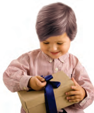
شکل ۲ - تشویق