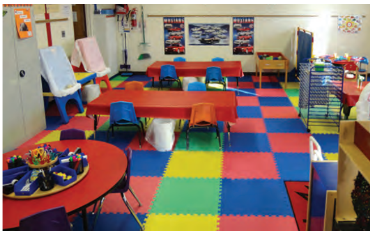
شکل ۴ - نمایی از کلاس