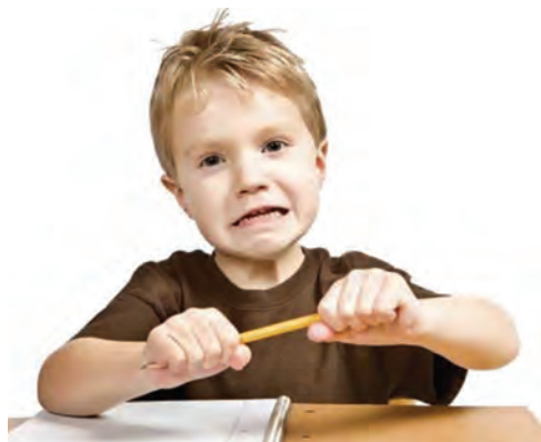
شکل ۹- کودک انتقام‌جو

چنین کودکی چنانکه اصلاح نشود به سمت کارهای پرخطر پیش می‌رود و سر دست گروه‌هایی چون خود می‌شود (دزدی، خرابکاری، شکستن شیشه‌ها و...). گاهی